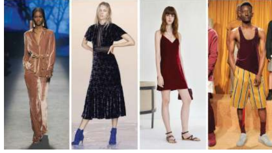
Resim 2. WGSN trend raporlarından. 11