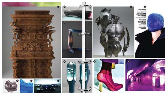
Resim 4. Promostyl trend raporlarından. 13

b. Model tamamlayan estetik ve teknik öğeler: Bunlar düğme, çitçit, fermuar, toka vb. takı nitelikli tamamlayıcılar gibi görülebilirler. Ancak koleksiyonda estetik katkıları çok