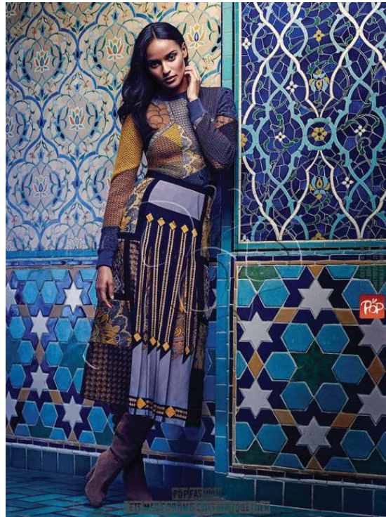
Resim 3. POP-fashion trend raporlarından. 12