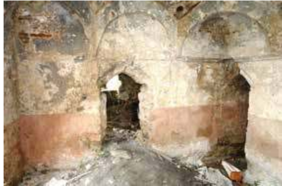
Fotoğraf 7: Beyobası Hamamı Sıcaklık Bölümü Batı ve Kuzey Cephesi

Eserin ılıklikğine doğu cephe aksında yer alan kapıdan sıcaklığa geçilmektedir (Fotoğraf 7). Hamamın sıcaklığı, kuzey-güney doğrultusunda enine düzenlenmiş bir plâna sahiptir 7 . Mer-