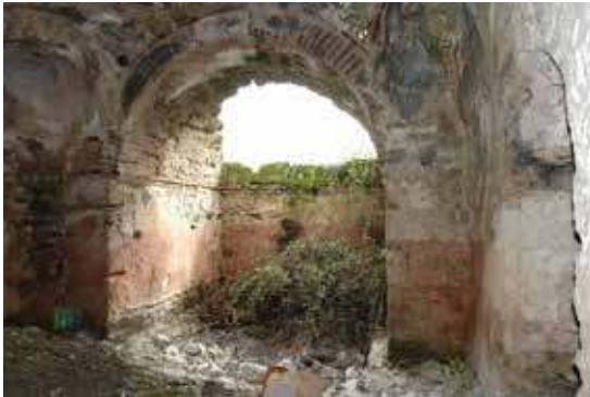
Fotoğraf 9: Beyobası Hamamı Sıcaklık Bölümü Güney Cephesindeki Eyvan

de tahribat görülmektedir (Fotoğraf 8). Aynı mekânın doğu cephe aksındaki açıklıktan su deposuna açılan pencere ile suyun kontrol edildiği anlaşılmaktadır. Orta mekânın güneyine ise buraya kemerle bağlanan ve üzeri beşik tonoz örtülü 2.89 x 2.89 m. boyutlarında tam kare plânlı eyvan eklenmiştir (Fotoğraf 9). Eyvanın beşik tonoz örtüsü tahrip olmuştur. Sıcaklık