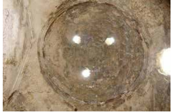
Fotoğraf 11: Beyobası Hamamı Sıcaklık Bölümü Kuzeyindeki Halvetin Kubbesi