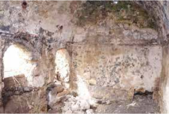
Fotoğraf 4: Beyobası Hamamı ılıklik Bölümünün Kuzey ve Batı Cephesi

Hamamın batı cephesindeki iki kapıdan, ku-zey-güney doğrultusunda uzanan, 4.86 x 3.28 m. boyutlarında dikdörtgen plânlı ılıklik mekânına girilmektedir (Fotoğraf 4). Sivri beşik tonozla