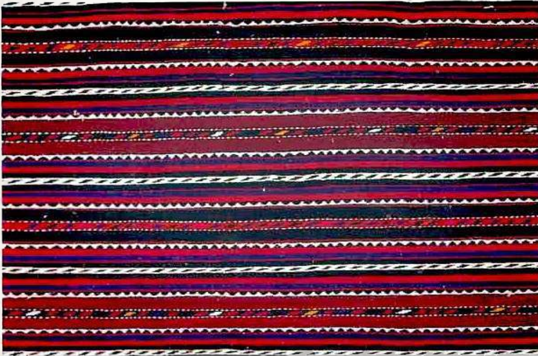
1. Palas. Bakı. Azerbaycan. XX y.y. Evvəli. Şəxsi kolleksiyon.

Günümüzde geçmişin manevi mirasının derinden öğrenilmesi, korunması ve herbir kesin bilinçaltı nesnesine dönüşmesi çok önemlidir. Azerbaycan'ın çağdaş cemiyetinin gelişiminde kültürel mirasın tetkiki, etnik kendine haslığın ifadesi ve belirlenmesi önemli hususlardandır.