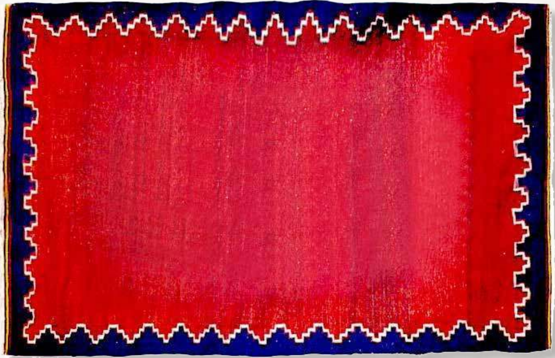
13. Şal-şedde. Muğan. Azerbaycan. XX y.y. evveli.