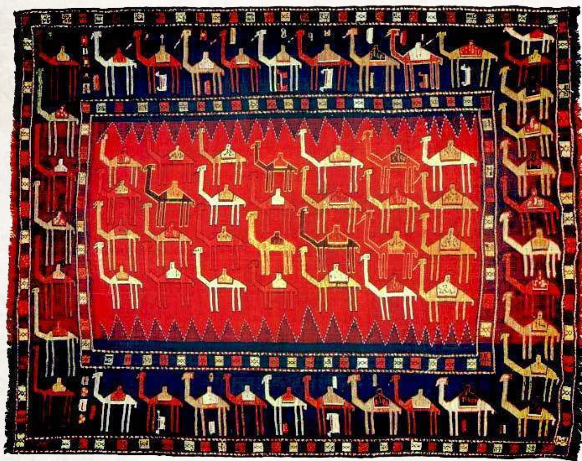
16. Şedde. Qarabağ. Azərbaycan. XX. y.y. evveli.