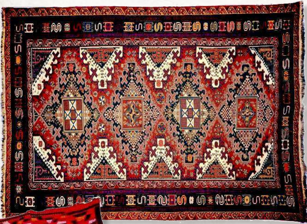
9. Sumax. Şirvan. Azerbaycan. XX y.y. Azerbaycan Halısı ve Halq Tatbiki Sanatı Devlet Muzesi.