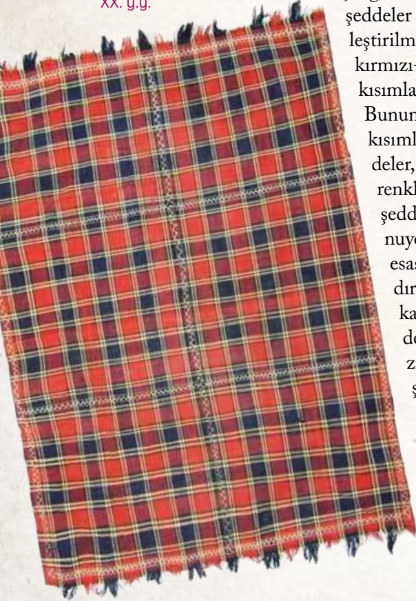
14. Dama-dama Şedde. Gazah. Azerbaycan. XX. y.y.

Havsız dokuma türlerinden olan şedde yün, pamuk ve ipek ipliklerden dokunuyor. Şeddenin yapısını iki tür iplik oluşturuyor: çözgü ve atkı. Genelde şeddeler birbiriyle birleştirilmiş kırmızı veya kırmızı-lacivert renkli kısımlardan oluşuyor. Bununla beraber tek kısımlı kırmızı şeddeler, kırmızı, lacivert renkli dikey çizgili şeddeler de dokunuyordu. Şeddelerin esasen üç türü vardır: tekrenkli-şal; kareli-damalı şedde ve mezmunlu zili şedde, develi şedde (Fotoğraf 13, 14, 15, 16). Günlük yaşamda şeddeden tören perde ve örtüleri gibi (çile şeddesi) faydalanılı-