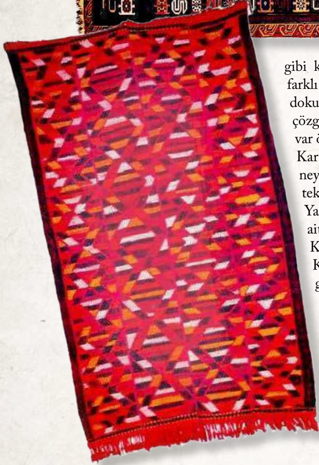
7. Ladı. Qarabağ. Azerbaycan. XX y.y. ortaları. Azerbaycan Halısı ve Halq Tatbiki Sanatı Devlet Muzesi.

gibi kısımlarla, ensiz, çözümleri renkli, fakat cecimden farklı olarak tek renk geriliyor ve atıklar aynı renkte dokunuyorlar. Sonuçta yerliği tek renkli ve cecim gibi çözümlü oluyorlar. Ladı günlük yaşamda döşek, duvar örtüsü vs. gibi kullanılıyordu. Ladılar Azerbaycan'ın Karabağ, Kazah, Tovuz, Yardımlı bölgelerinde ve Güney Azerbaycan'da dokunuyorlar. Günümüzde ladı tekniğinde çalışan dokumacıların çoğu Azerbaycan'ın Yardımlı, Astara ve Lerik bölgelerinin dağ köylerine ait kişilerdirler. Ladı havsız dokumalarına Kazah ve Karabağ'da zili, Göyçe, Kazah ve Karabağ'da derme, Kazah, Göyçe, Borcalı' da derme kilim, Lenkeran'da geçirme palas deniliyor.