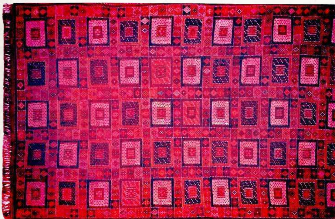
15. Şedde. Qarabağ. Azərbaycan. XX. y.y. evveli.