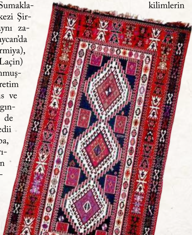
11. Gezmeli Kilim. Şirvan. Azərbaycan. XX y.y. evveli. Azərbaycan Halısı ve Halq Tatbiki Sanati Devlet Muzesi.

iri ve küçük romblardan, gamaya benzer elemanlardan, kabarıklık desenlerden oluşuyor (Fotoğraf 10, 11).