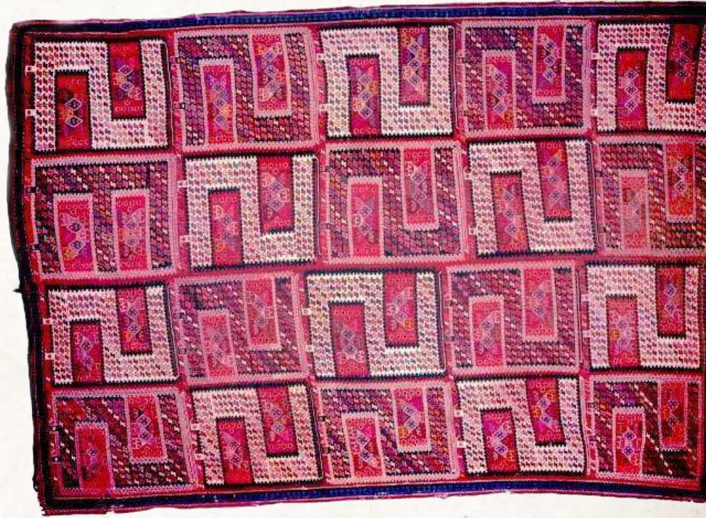
12. Verni. Qarabağ. Azərbaycan. XX y.y. Azərbaycan Halısı ve Halq Tatbiki Sanatı Devlet Muzesi.

Vernilerin esas üretim merkezleri Karabağ (Berde, Susa, Ağcabedi, Cebrayıl, Lemberan), Kazah, Nahcevan ve Güney Azerbaycan'dır. Karabağ vernisinin süslemesinin esas elemanı neredeyse dokumanın tüm sahasını kapsayan "S" veya "Z" şekilli stilize edilmiş ejderha tasviridir. Ejderha bereket sembolü ve