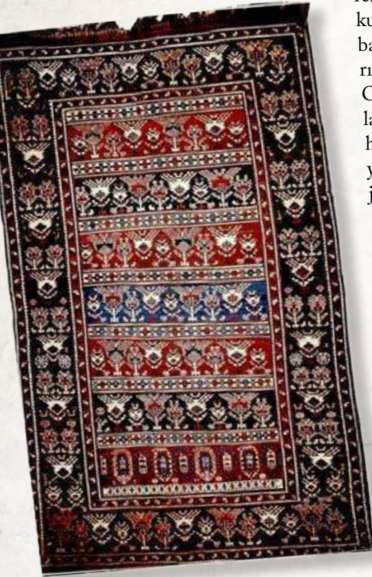
5. Zili. Bakı. Azerbaycan. XX y.y. Azerbaycan Halısı ve Halq Tatbiki Sanati Devlet Muzesi.

yer alıyorlar. Başlıca zili üretim merkezleri Karabağ, Kazah, Bakü, Nahcevan, Göyçe ve Güney Azerbaycan'dır. Zili tekniğine göre: karımış fers, kullanımına göre: namazlık, bedii özelliklerine göre: damarlı ve zili kuşlu, zili şedde, hacı nağı zilisi,