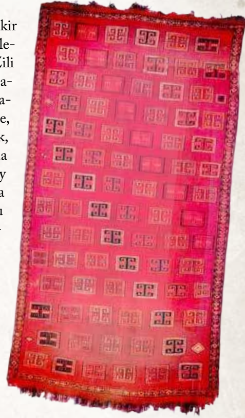
6. Zili. Qazax. Azerbaycan. XX y.y. evveli. Azerbaycan Halısı ve Halq Tatbiki Sanati Devlet Muzesi.