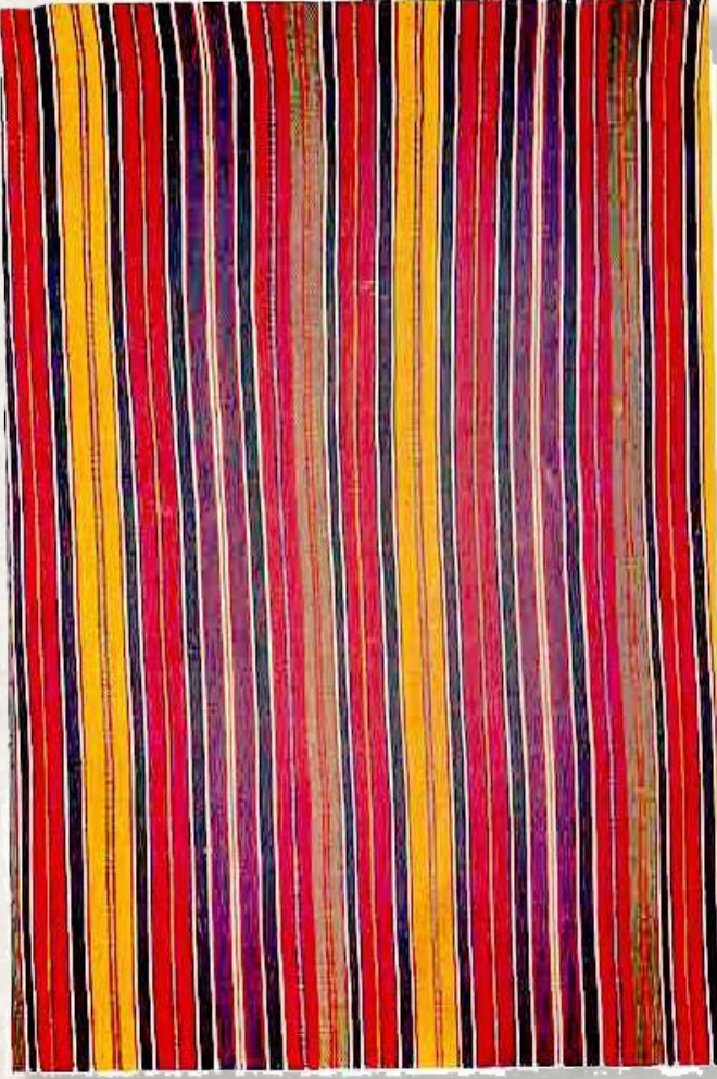
3. Cecim. Qarabağ. Azərbaycan. XX y.y. Evveli. Azərbaycan Halısı ve Halq Tatbiki Sanatı Devlet Muzesi.

luyordu. Bazen pamuk veya pamukla yünün karışımından hazırlanmış cecimlerle de karşılaşmak mümkündür. Cecimin yapısını iki farklı sistemli iplik oluşturuyor: atkı ve çözgü. Çözgüleri renkli (beyaz, kırmızı, sarı, koyu bej vs.) ipliklerden geriliyor ve bunların arasından geçirme tekniği ile tekrenkli atkı iplikleri tekbir-çapraz geçiriliyor. Çözgü ve atkının sıklığı eşit olmuyor, genelde çözgü iplikleri çok sıkı gerilir, boyanmamış atkı iplikleri bir alt bir üst sıkıca geçirilerek çözgülerin arasında saklanıyor ki, böylece çözgü yüzlü "cecim" oluşuyordu. Atkı iplikleri çözgü iplikleriyle nispette kalın olduğu için cecimin yüz kısmı kabarık oluyordu. Bu tarz dokumalar genelde yatay yer tezgahında yapılıyordu. Cecimin eni 25-30 cm.-i geçmezken uzunluğu 15m.