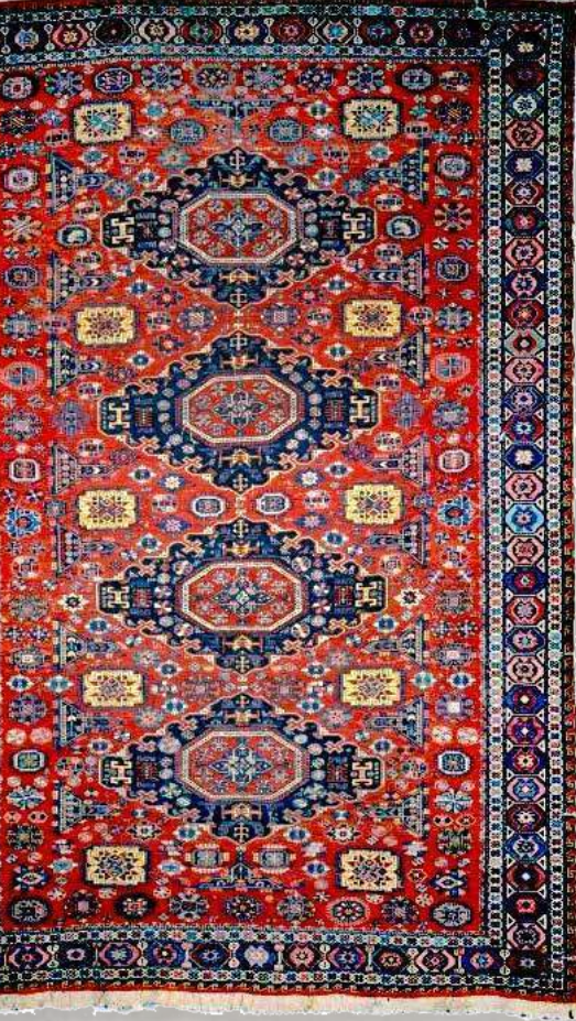
8. Sumax. Quba. Azərbaycan. XX y.y. birinci yarısı. Azərbaycan Halısı ve Halq Tatbiki Sanati Devlet Muzesi.

veya saç örgüsünü anımsatıyor. Her bir ilmek sıralamasından sonra bir alt, bir üst atkı doyumlu geçiriliyor.