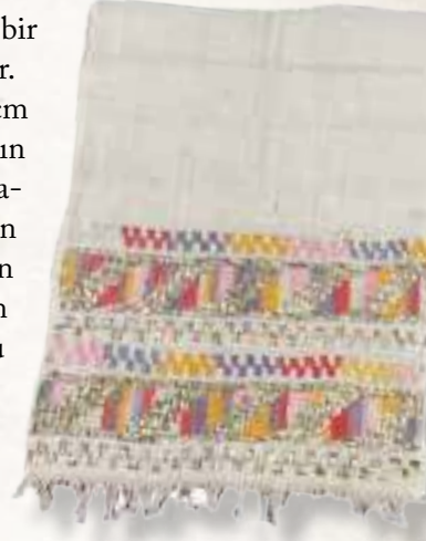
Fotoğraf: 8. 5.1.80 envanter numaralı keten peşkir

Alanın basit sıralı olarak düzenlendiği birinci örnek geometrik motifli peşkir olup, Fotoğraf 9a,b 'de görülmektedir.