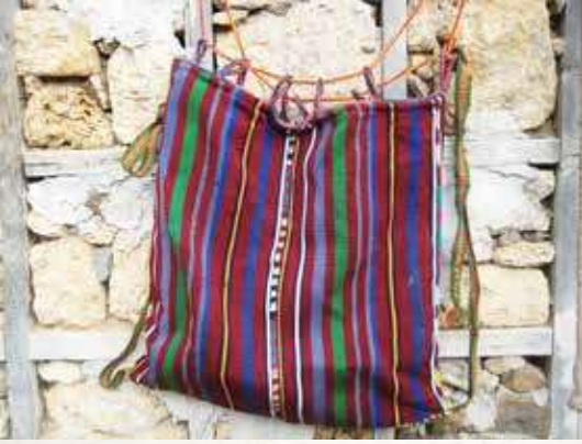
Fotoğraf 6. Düz dasdarla dokunmuş ve birleştirerek çanta haline getirilmiş heybe

zor elde edilir hale gelmiştir. Bu hal, gençlerin geleneksel meslek dalına ilgi duymamasını da yanında getirmiştir. Bugün artık kilim ve halı dokuma tezgâhları neredeyse kullanımdan kalkmış depolarda tozlar arasına terk edilmiştir. Bölgede dokumacılığın daha kolay hali olan dasdar dokuma türü tercih edilmektedir.