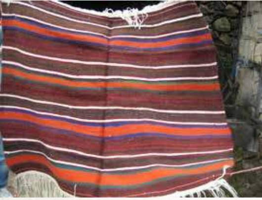
Fotoğraf 5. Kök boya ile elde edilen saf yünden dokunmuş düz dasdar