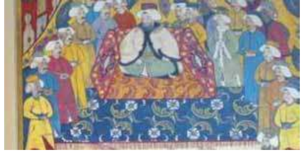
Levnî, Surname-i Vehbi Minyatürden detay

Padişah, koyu mavi zeminli kıvrık yaprak ve minelerle bezeli bir halı üstünde kurulu tahtta oturmaktadır.