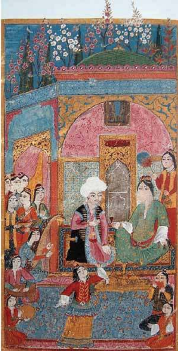
1595, Divan-ı Baki, LBL, Or. 7084, y. 10b Minyatür