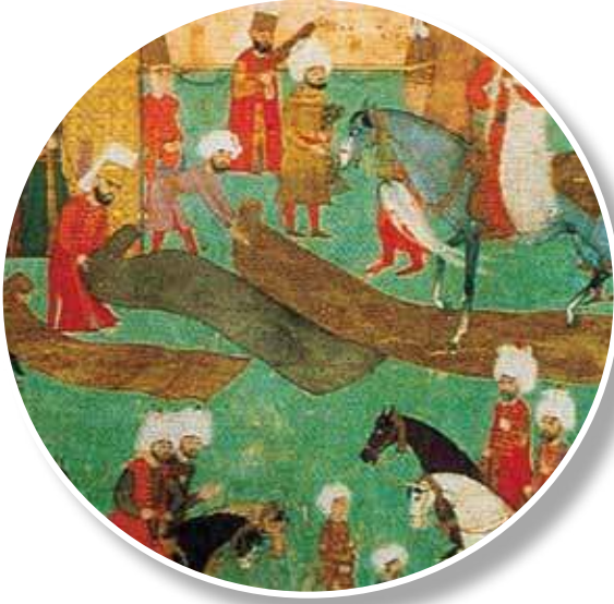
1587, Sûmâme-i Hümayûn, 1587 (TSM. H. 1344), 12a Minyatürden detay