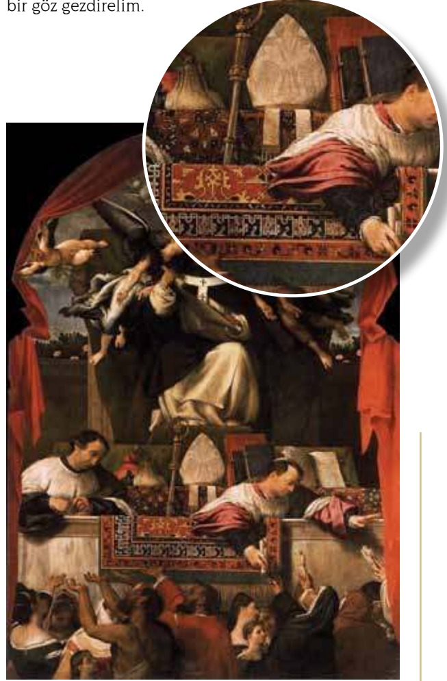
Lorenzo Lotto, (1480-1557)'in 1542 tarihli eseri

XV-XVI. yüzyıllardan itibaren batılı ressamın resimlerine girecek kadar Avrupa sosyal hayatında kullanılan halılar elbette orta şark minyatürlerinde de bulunmalıydı. Şimdi de minyatürlerdeki halılara bir göz gezdirelim.