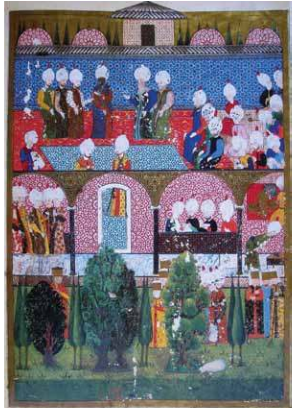
1558, Arifi, Süleymannâme Minyatür