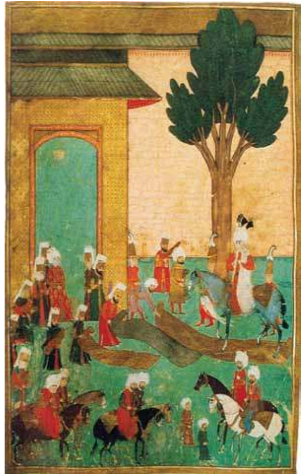
1587, Sûrnâme-i Hümâyûn, 1587 (TSM. H.1344), 12a Minyatür

Şehzade Mehmed, İbrahim Paşa sarayına atının ayağı altına yolluklar serilerek girmiştir.