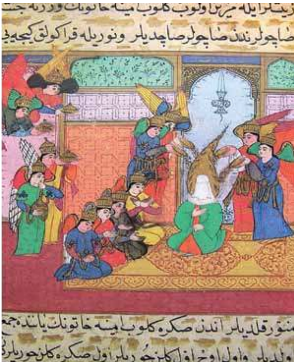
1595, Siyer-i Nebi I, TSMK H. 1221, 21b Minyatür