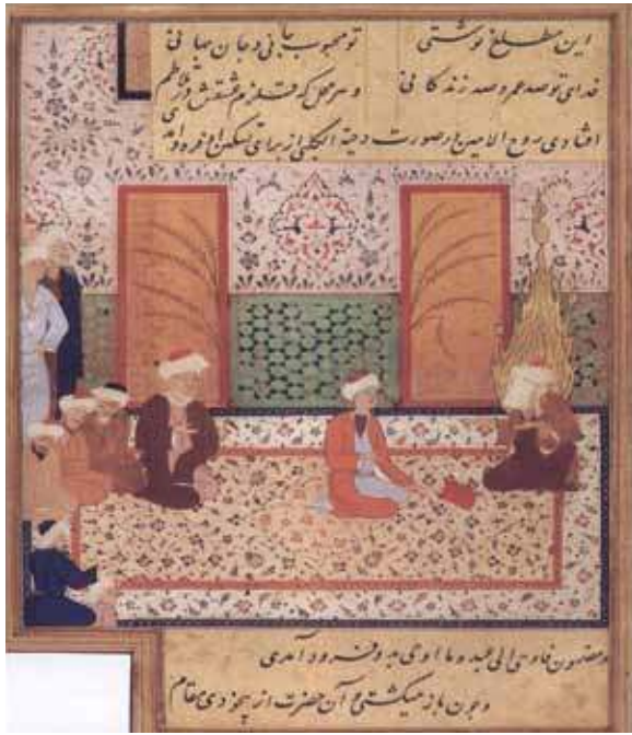
1469, Mansur, Herat Minyatür