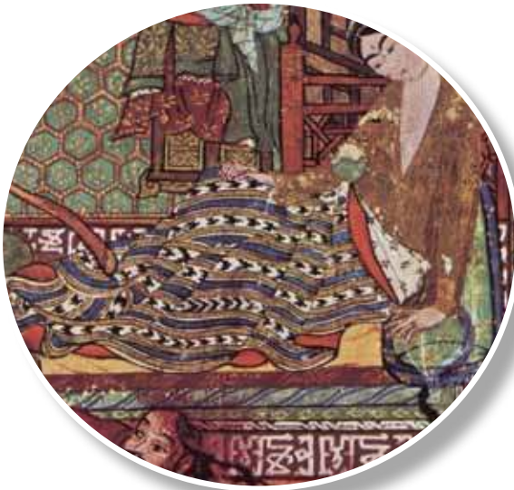
1360-1374, Kelile ve Dimne, Tebriz. Mihiyatürden detay