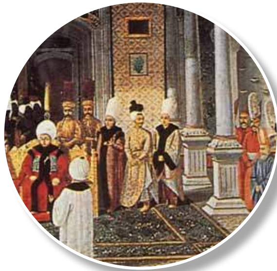
III. Selim detay