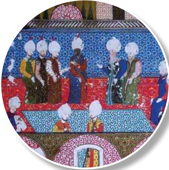
1558, Arifi, Süleymannâme Minyatürden detay

Kanunî Sultan Süleyman bir divan toplantısını büyük bir halı üstünde yapmaktadır. Kırmızı zeminli halının içi rumi kıvrımlarla bezenmiş göbekli bir halıdır.