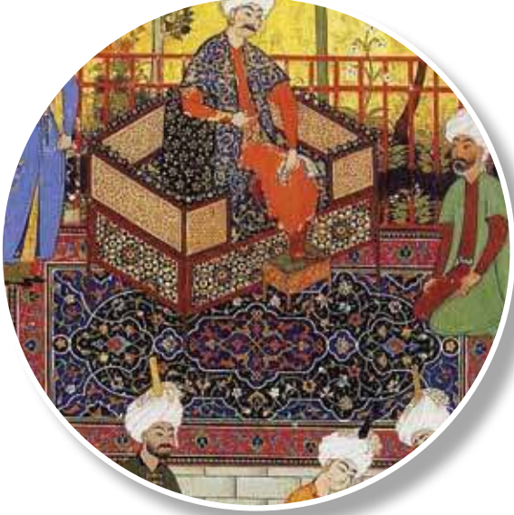
1524-1525, Nizami, Hamse, Tebriz Minyatür detay

1524-25, Nizami, Hamse, Tebriz 24 . “İskender Hakan’ın Kabulünde”.