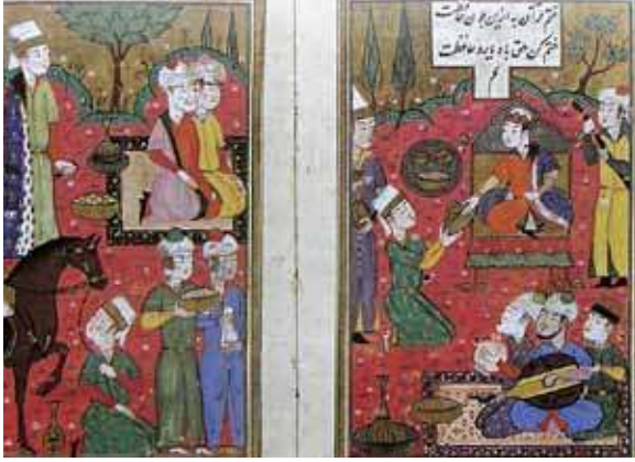
1460, Külliyyat-ı Kâtibî Minyatür

1460, Külliyyat-ı Kâtibî, Sultanın meclisi 10 . Sultan ve meclise iştirak edenler kahverengi zeminli bir halı üstünde tasvir edilmiştir.