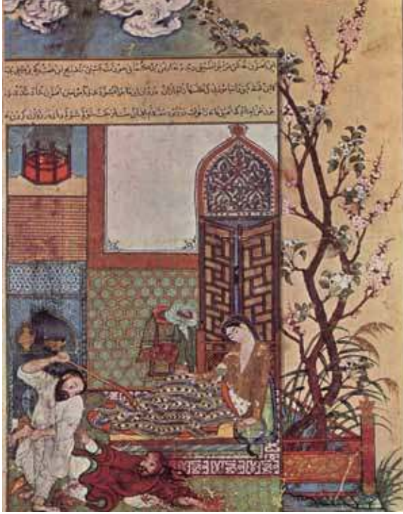
1360-1374, Kelile ve Dimne, Tebriz. Mihiyatür

Buradaki yatağın altında bir halı yer almaktadır: XIV. yüzyıl Tebriz ekolü eseri. Koyu kırmızı zeminli, kufi bezek bordürlü bir halı ile karşı karşıyayız.