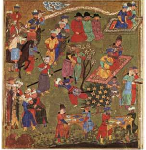
1444, Firdevsi, Şehname, Şiraz. Minyatür

Tabiat ortasına serilmiş iki ayrı halı üzerine oturmuş kişiler ile karşı karşıyayız. Üstteki parçada kırmızı zeminli, koyu renkli bordür içinde kûfi bezekli bir halı görülmektedir.