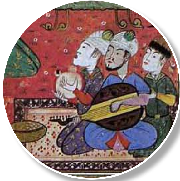
1460, Külliyyat-ı Kâtibî Minyatürden detay

1460, Külliyyat-ı Kâtibî, Sultanın meclisi 11 .