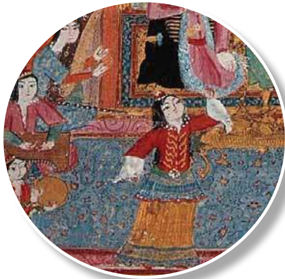
1595, Divan-ı Baki, LBL, Or. 7084, y. 10b Minyatürden detay

1595-1600, Humayunname, TSMK, 843, y. 163b 43 . Haremde hekim, halıların üstüne oturmuş hasta muayene ederken görülmektedir. Sürahi tutan kadın kenar bordürü açık mavi, koyu yeşil yaprak ve minelerle bezekli orta zemini deve tüyü renginde, kırmızı göbekli bir halı üstünde otururken tasvir edilmiştir.