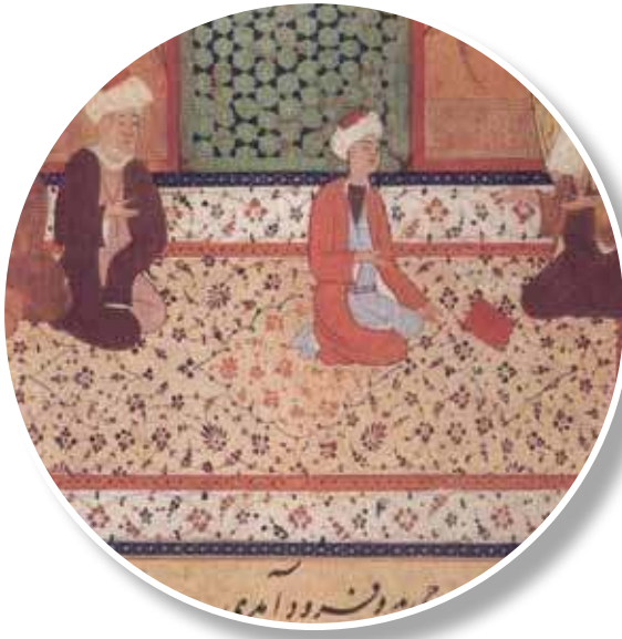
1469, Mansur, Herat Minyatürden detay

Kenar bordürü koyu ve içindeki desenli kısmı beyaz renkli, küçük yaprak ve çiçeklerle bezeli bir halı ile karşı karşıyayız. Ortada oturan şahsın altında yine aynı desenden bir de göbek bulunmaktadır.