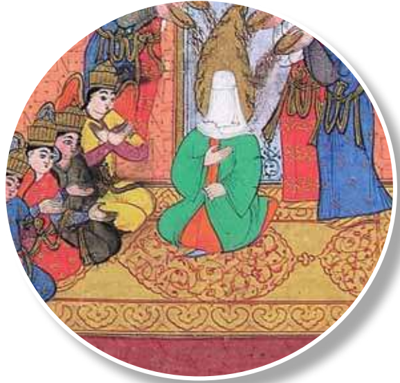
1595, Siyer-i Nebi I, TSMK H. 1221, 21b Minyatürden detay

Hazret-i Muhammed'in doğumu bir önceki minyatürden farklı olarak bir hasır üzerinde gerçekleşmiş olarak tasvir edilmiştir.