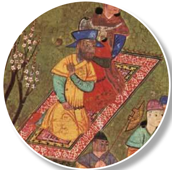
1444, Firdevsi, Şehname, Şiraz. Minyatürden detay