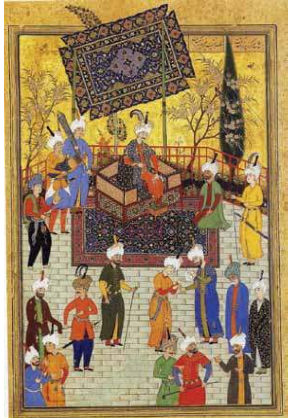
1524-1525, Nizami, Hamse, Tebriz Minyatür

1524-1525, Nizami, Hamse, Tebriz 23 . Şehzade Hüsrev'in tahta çıkması.