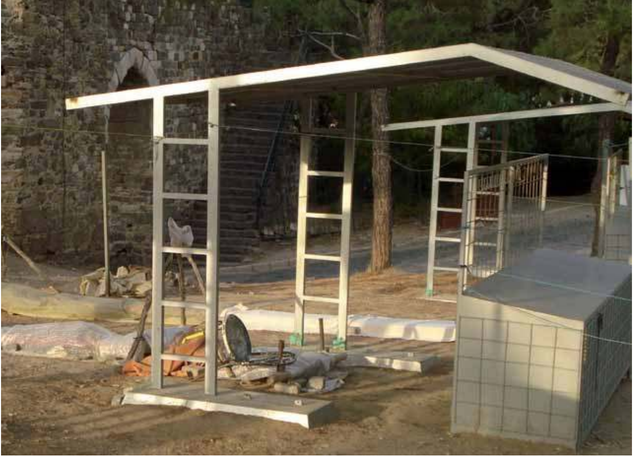
Foto 2. Kadifekale'nin ana giriş kapısı içindeki tezgahlar

memiş dokumalar bulunmaktadır Bunlar hiçbir açıklık kalmayacak şekilde muşambalarla sıkıca sarılıp, kış şartlarından korunarak bekletilmektedir. İlkbahar ile birlikte dokumanın tekrar canlandığı bölgede, yağışlar başlayınca kadar dokuma faaliyetleri sürmektedir. Bazı dokumacılar kış aylarında, havanın ılık olduğu yağışsız günlerde de dokumalarını yapmaktadır (Foto 2-3).