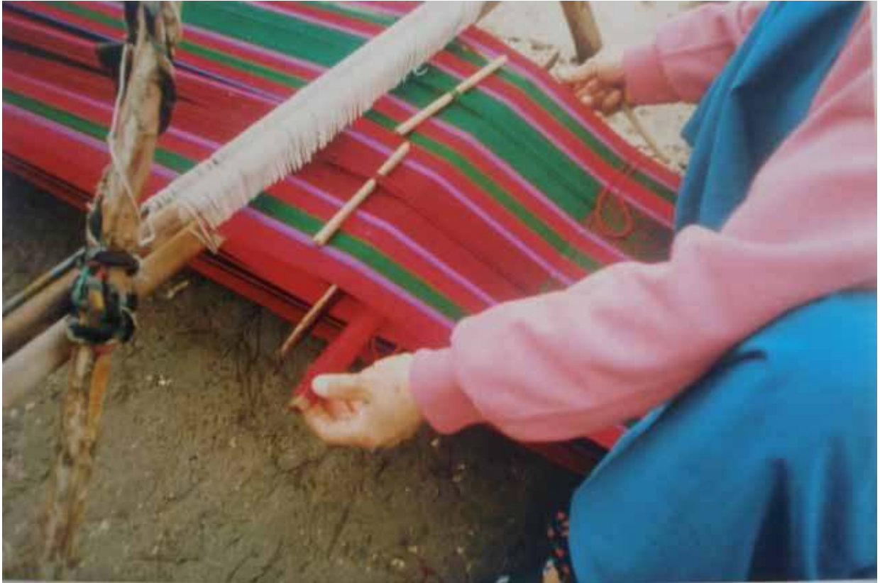
Foto 7. Dokumada kullanılan desen çubukları

güde birden fazla renkte çözüğü ipliği kullanılırken, atkıda ise tek renk atkı ipliği tercih edilmektedir. Dokumanın üzerindeki desenler dokuma sırasında kullanılan küçük çubukların yardımıyla, çözüğü ipliklerine elle bir hareket verilmesi sonucu oluşturulmaktadır. Yani desen hareketi dokuma sırasında elle verilmektedir. Desenin oluşturulduğu kısımlardan atkı ipliği geçirilirken, açılan ağızlığın dışında dokumacı, desen için de desen çubukları yardımıyla bir ağızlık daha açmaktadır. Her atkı sırasında desene göre açılan bu ağızlık ile çözüğü ipliklerinin hareketi değiştirilerek istenilen desen oluşturulmaktadır. İlk bakışta bu dokumalar cicim dokumalar ile karıştırılabilir. Cicim, desen atkısı kullanılan bir dokuma tekniğidir. Bu teknikte desenler farklı renkte desen ipliği kullanılarak oluşturulur. Ancak Tevni dokumacılığında desen için ayrıca bir iplik kullanılmamakta ve çözüğü ipliklerinden desen oluşmaktadır. Bir başka deyişle çözüğüden desenlendirme yapılmaktadır (Foto 7).