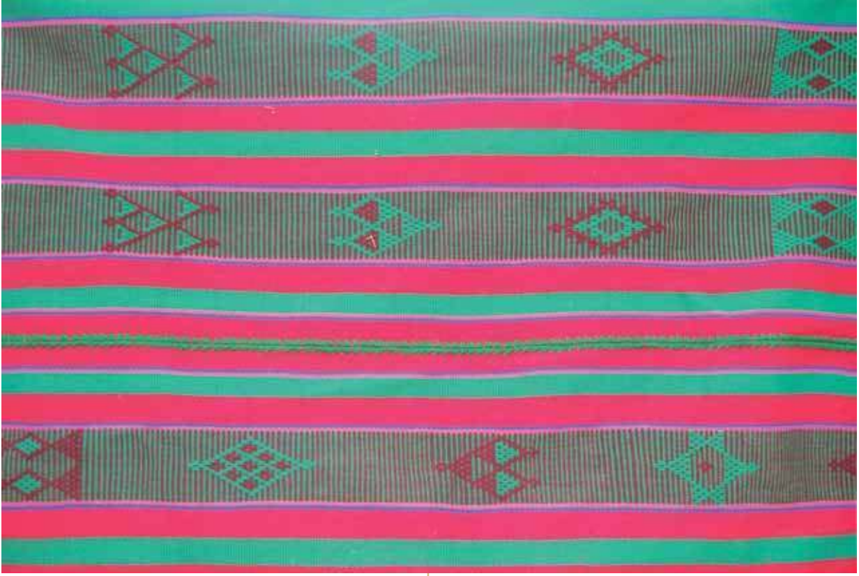
Foto 5. Dokuma örneği