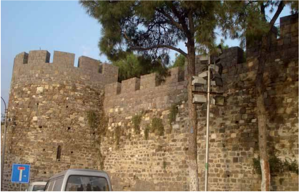
Foto 1. İzmir Kadifekale'nin genel görünümü.