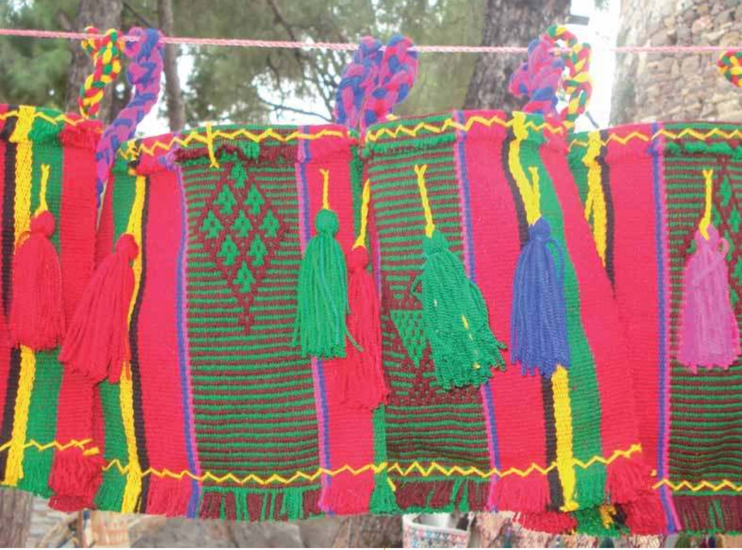
Foto 17. Hediyelik heybeler