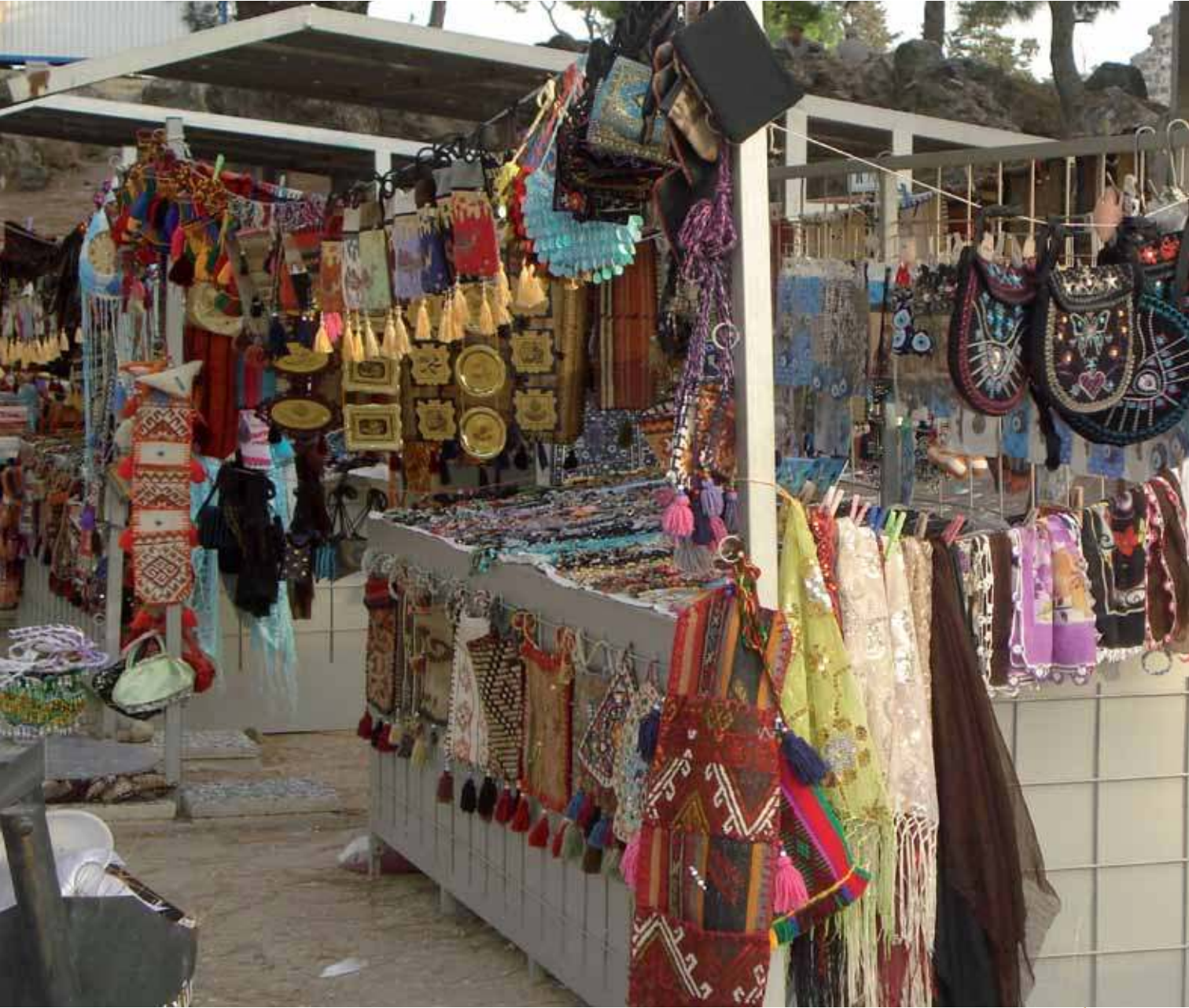
Foto. 18 - Kadifekale içindeki hediyelik eşya satış yeri

ları değerlendirerek oluşturulacak tanıtım ve pazarlama kolaylığından yararlanılabilir. Tevni dokumacılığı gibi diğer pek çok yöresel dokuma ve el sanatı ürünlerimizde de benzer tanıtımlar bireysel olarak ulaşamayacağımız dünyanın farklı yerlerine ulaşma imkânı sağlayacaktır. Çeşitli yerlerde (sempozyum, kongre, sergi, bienall, belediye etkinliği, festival, fuar v.b.) görsel sunum ve aktif tanıtımlar ile kişilerin ilgisini çekmek ve merak uyandırmak mümkün olacaktır. Geleneksel olarak yapılan dokumacılıkta kullanılan hammadde, renk, boyut, desenler, kullanım şekli mutlaka bilinmeli ve bu özellikte üretimleri yapılmalıdır. Fakat yeni fikir ve öneriler doğ-