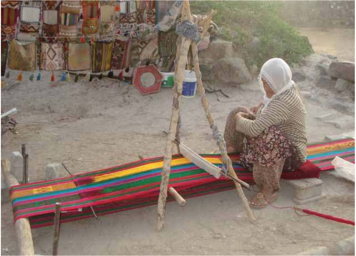
Foto 4. Tevni dokumasının yapıldığı tezgahın genel görünümü

lan Tevni dokumacılığı, son yıllarda birkaç aile tarafından özellikle günlük kullanım ve çeyizlik amacı ile üretilmektedir. Dokumalarda hammadde olarak yün ve keçi kılı ile ipliklerini kendileri eğirip boyadıktan sonra dokuma yapılmaktadır. Bu dokumalar yer yaygısı, yiyecek çuvalı, şal, heybe, namazlık, divan örtüsü, bebek beşiği için örtü amacıyla kullanılan, yörede aile kadınlarının günlük işlerinden artan zamanda sadece kendi ihtiyaçları için yaptıkları dokumadır.