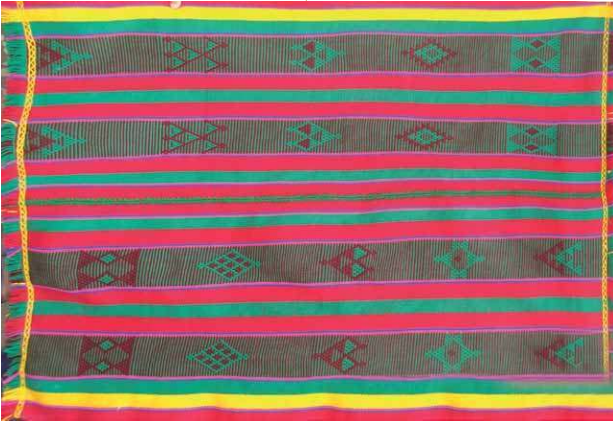
Foto 6. Dokumadan detay görünüm