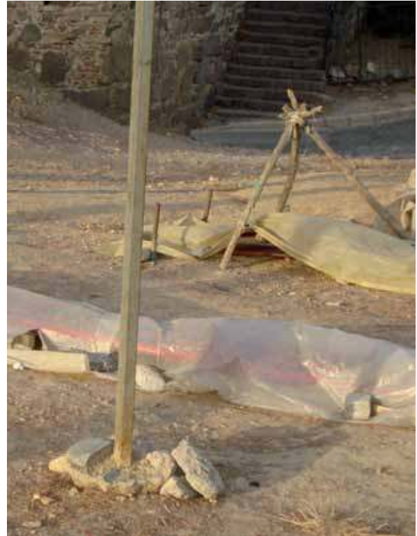
Foto 3. Kış dönemi üzeri örtülmüş Tenvi dokumacılığının yapıldığı tezgahlar

Mardin ve çevresindeki köylerde (Kutlubey, Akarsu Köyleri v.b.) eskiden her evde geleneksel olarak yapı-