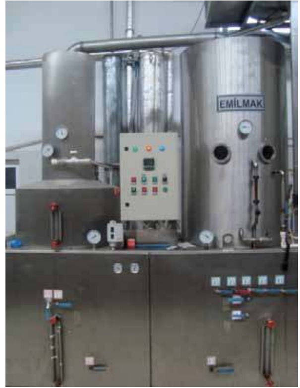
Foto 6. Emilmak Makinesi

sıcaklık ve besleme oranı makine üzerindeki kontrol panelinden ayarlanır (Foto 5).