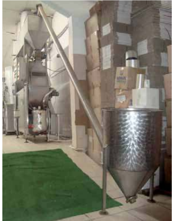
Foto 4. Besleme Tankı

Öğütülmüş kızılcam kabukları ve % 20 saf su ile alkol oranı yaklaşık % 78'e düşürülen etil alkol, azot gazı altında 40°C'de 4 saat karıştırılır. Karışım süresi,