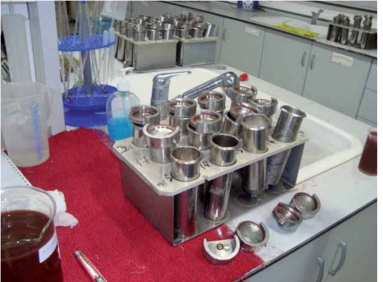
Foto 11. Test Kapları