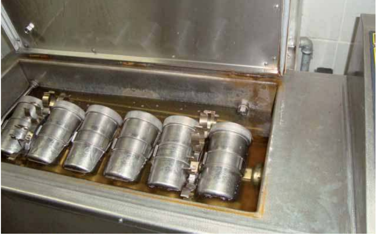
Foto 10. Termal Boya Makinesi