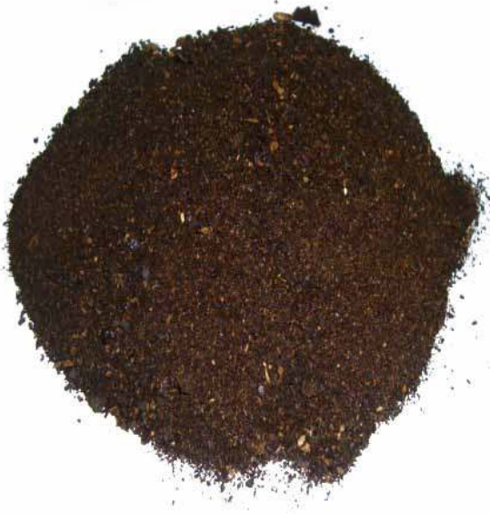
Foto 8. Kızıldaam Pigmenti

lanmıştır. Behrelere konulan hammadde ve mordan miktarları şöyledir;