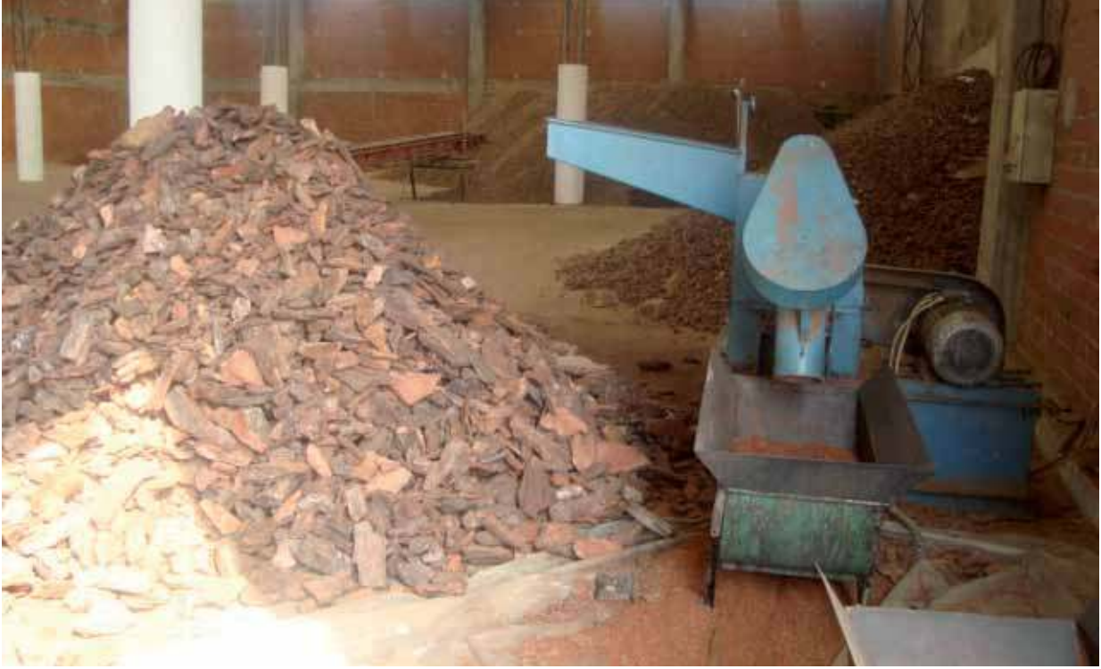
Foto 2. Öğütme Makinesi

risinde bulunan yabancı maddeler (metal parçalar, taş vs.) işçiler tarafından elle ayıklanarak temizlenir, öğütme makinesinde küçük parçalar (işletmedeki tanımıyla kırık bulgur tanesi) haline getirilip düşük sıcaklıkta, gölgede ortalama 24 saat kurumaya bırakılır (Foto 2). Kurutma işleminde nem derecesinin yaklaşık % 10 civarında olması beklenmekle birlikte yüzey alanın geniş tutulması her bölgenin eşit miktarda kurumasını sağlar (Foto 3).