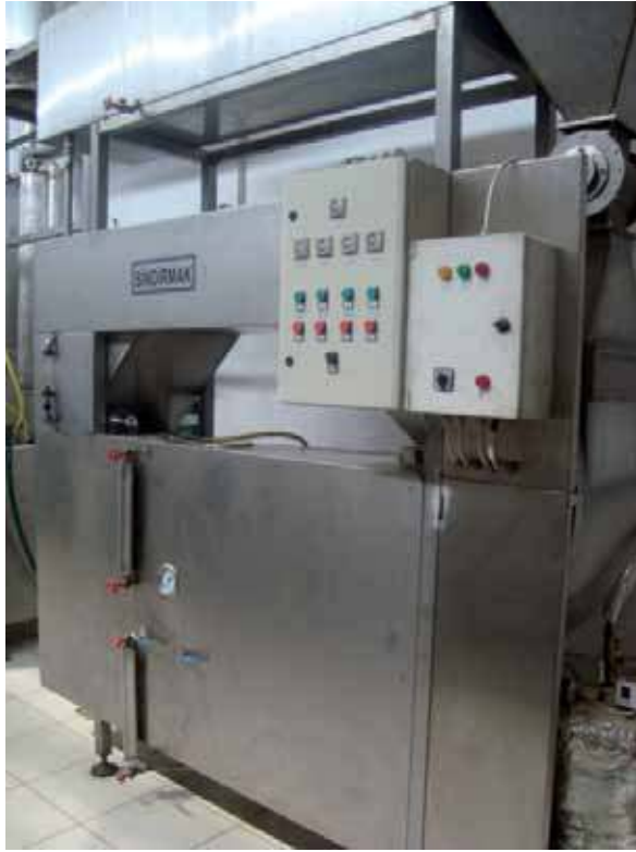
Foto 5. Sindirmek Makinesi