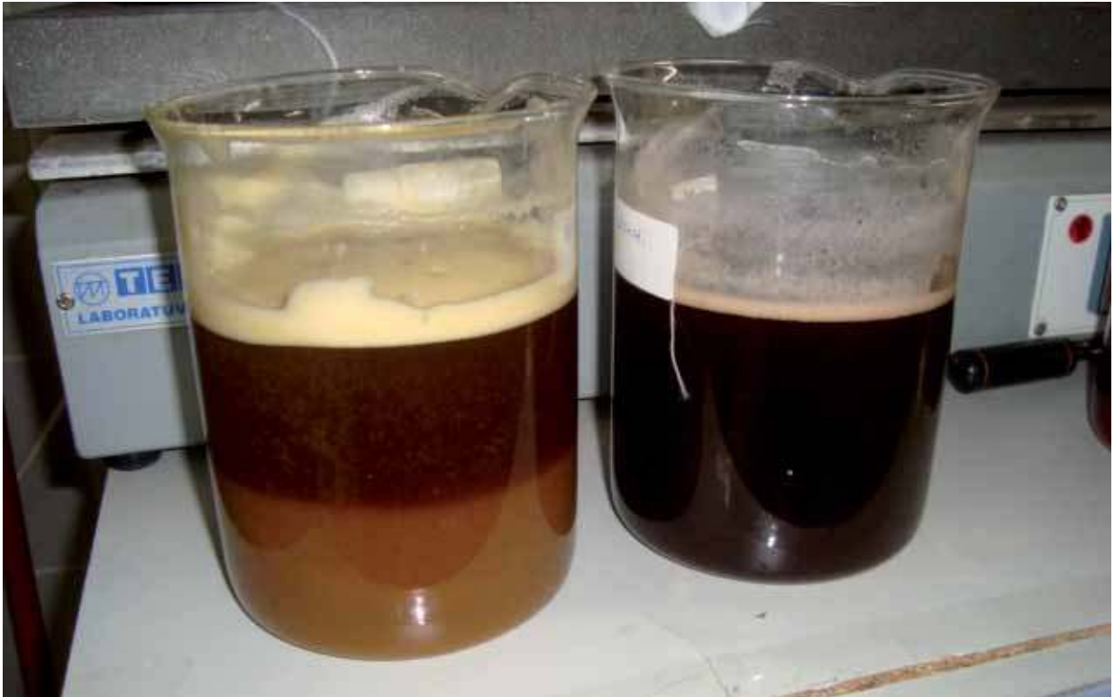
Foto 9. Çözeltiler

"CIELab" birimleri cinsinden iki renk arasındaki renk farklılıkları ( \Delta E ) değeri;