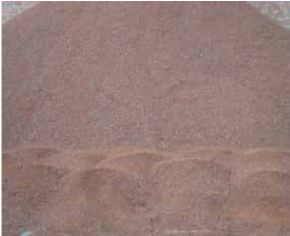
Foto 3. Öğütülerek Kurumaya Bırakılan Kızılcam Kabukları

Kurutulmuş kızılcam kabukları besleme tankına boşaltıldıktan sonra helezon sistemi olarak adlandırılan kıvrımlı silindirler yardımıyla besleme hunisine iletilir. Beslenecek kabuk miktarı ve besleme süresi makine üzerindeki kontrol panelinden ayarlanabilir