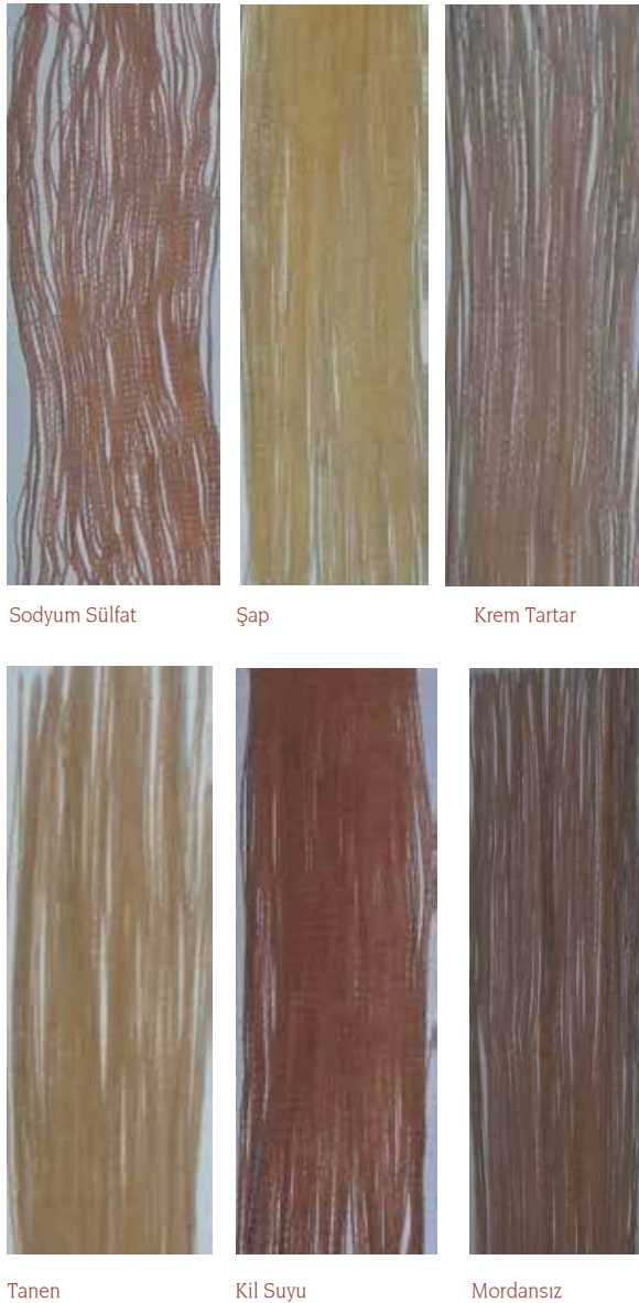
Foto 12. Kızılcım Pigmenti İle Boyanmış Yün İplikleri