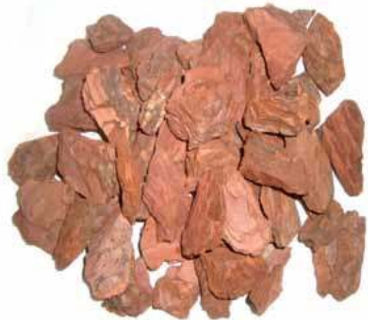
Foto 1. Kıızılcım Kabukları