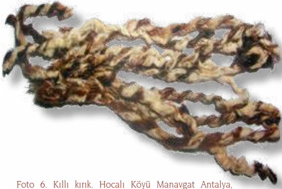
Foto 6. Kılı kırık. Hocalı Köyü Manavgat Antalya