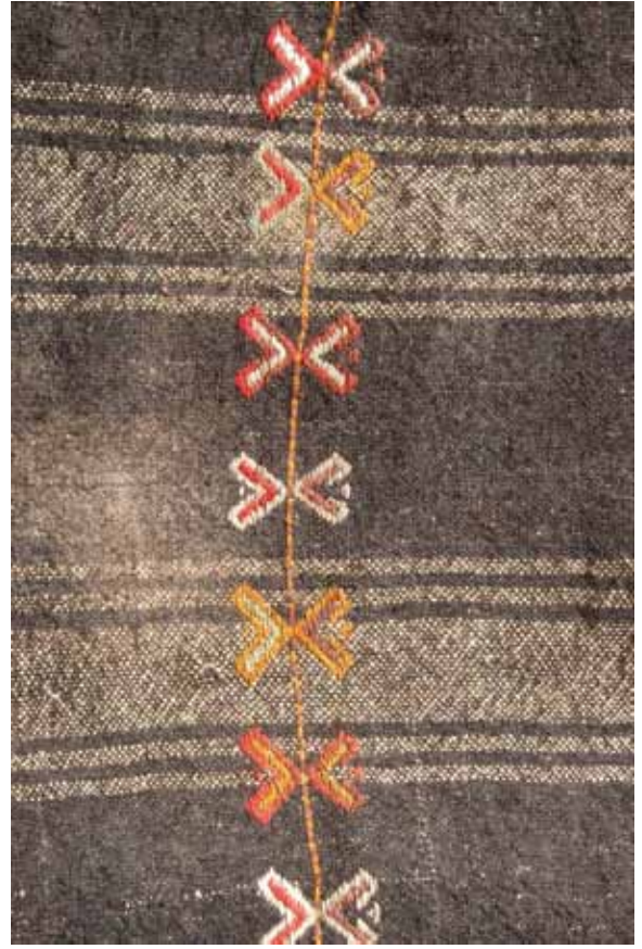
Foto 12. Keçi Kılı Bağcıklı Çuval Detayı, 115x66 cm Kilim ve Cicim, Ali Yıldırım Evi, Ö. Aydın, 2008