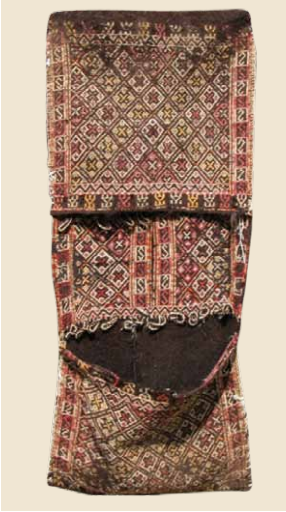
Foto 3. Sıyırmaç Atın Kınacı Heybesi, 55 (en) x 45 (boy) + 30 + 45cm Sumak Zili tekniği ile dokunmuş, Hasan Güzel Evi, Öznurtepe Köyü. B. Deniz, 2008.