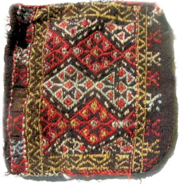
Foto 9. Sapsız ve Kilitli Torba, 40x37 cm Eğri Sili Tekniği ile dokunmuş, Sivashlı Köyü Eşe Şahiner evi, Ö. Aydın, 2008.