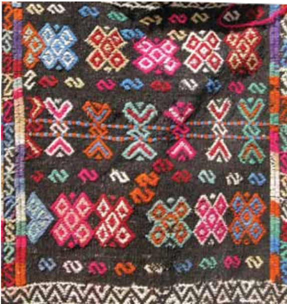
Foto 8. Cicim Desenli Heybe, 60x56 boy 144 cm Cicim Desenli Heybe, Ali Yıldırım Evi, Ö. Aydın, 2008.