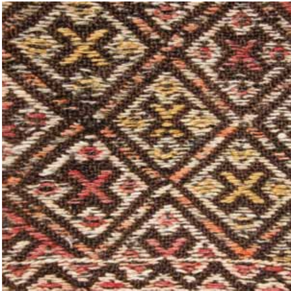
Foto 4. Sıyırmaç Atın Kınacı Heybesi Detayı, Sumak Zili tekniği ile dokunmuş, Hasan Güzel Evi, Öznurtepe Köyü. B. Deniz, 2008.