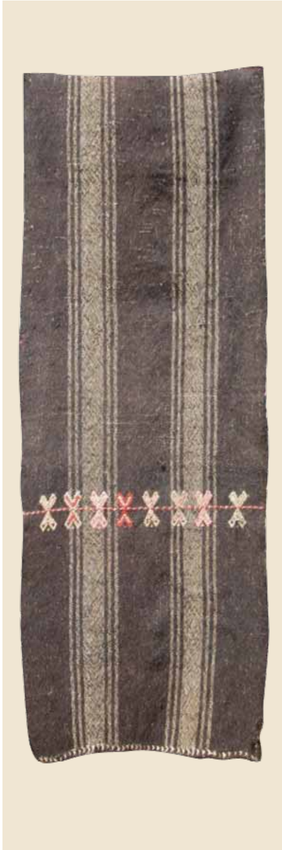
Foto 11. Keçi Kılı Bağcıklı Çuval, 115x66 cm Kilim ve Cicim, Ali Yıldırım Evi, Ö. Aydın, 2008