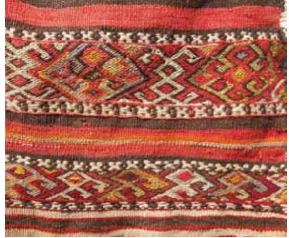
Foto 6. Alaçuval, Alasıkara Daş Detayı, 124x84 cm Sumak, Ali Yıldırım Evi, Ö. Aydın, 2008

nır. Ala kelimesi çuval dokumalarının tek renkli olmadığını, zengin motif ve renklerle bezenmiş olduğunu anlatır. Göçebe yaşamında kullanılan ala çuvallar; giysilerini, takılarını ve değer verdikleri eşyalarını koydukları çuvallardır. Günümüzdeki sandığın yerini tutmuştur. Bu çuvallar kıl ve keçe çadırlarda yan yana dizilerek alanları süsler. (Foto 6.)