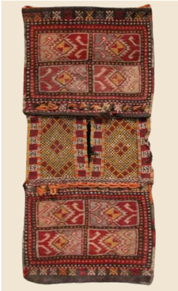
Foto 1. Kınacı Heybesi 56(en)x51+30+51(boy) cm Sumak Zili tekniği ile dokunmuş, Gazipaşa Halk Eğitim Merkezi, Ö. Aydın, 2008

Torba: Türkçe bir kelimedir. İçerisine yiyecek, iç çamaşırı koyulan ve duvar süsü olarak kullanılan örneklerde çoğunlukla çobanlar tarafından sırtta taşınır. Ayrıca içlerine iç çamaşırı konularak esvap çuvallarının içinde de kullanıldığına rastlanılmıştır. Dikiş aletlerinin konulduğu gelin ve kızların odasında duvara asılı örnekleri de bulunmaktadır. 2