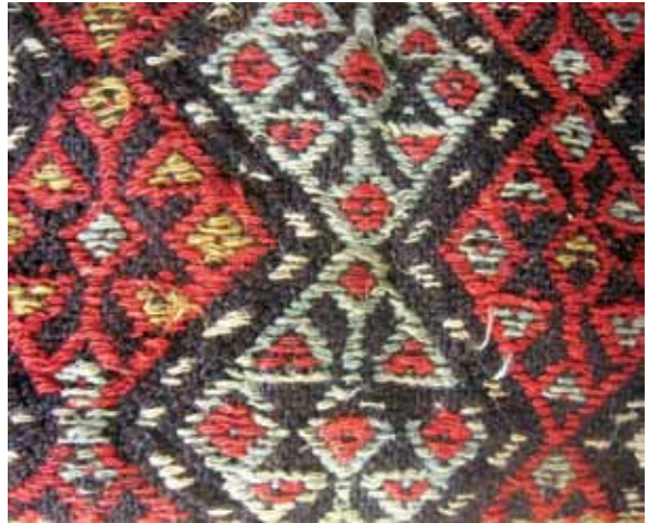
Foto 10. Sapsız ve Kilitli Torba Detayı, 40x37 cm Eğri Sili Tekniği ile dokunmuş, Sivashlı Köyü Eşe Şahiner evi, Ö. Aydın, 2008.