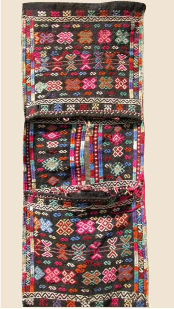
Foto 7. Cicim Desenli Heybe, 60x56 boy 144 cm Cicim Desenli Heybe, Ali Yıldırım Evi, Ö. Aydın, 2008.