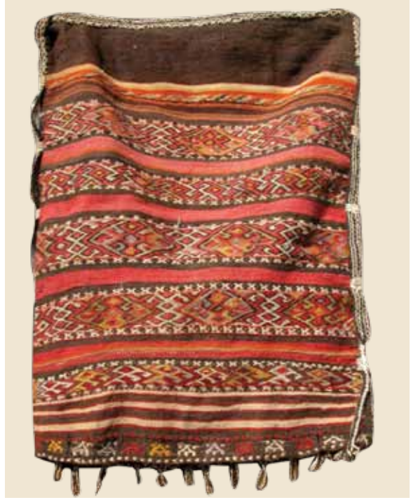
Foto 5. Alaçuval, Alasıkardaş, 124x84 cm Sumak, Ali Yıldırım Evi, Ö. Aydın, 2008.

konuldukları için yük adı da verildiği görülmüştür. Hayvan sırtlarına yüklendiği için de yük (denk) denir. (Foto 5.)