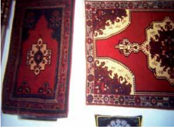
Foto 1. Duvara asılı halılar - Yenikent Kasabası / Aksaray