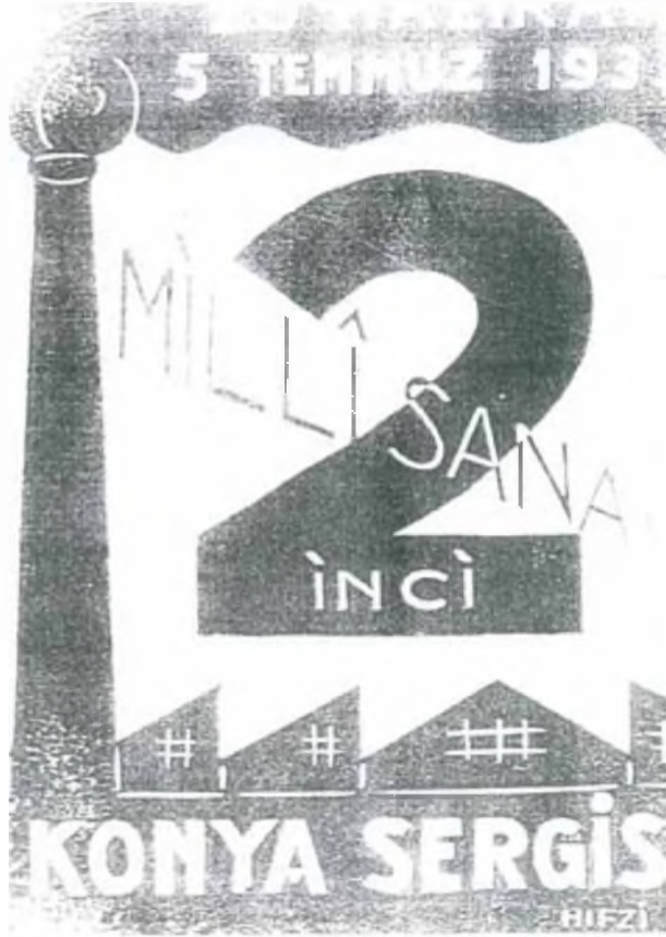
Foto 1. 2. Milli Sanayi Sergisi Afışı

Cumhuriyet öncesinde Sille'de 1000'e yakın halı tezgâhı bulunmaktaydı. Cumhuriyetin ilanı ile birlikte Sille'deki Rumların Pire ve Korfu'ya gönderilmeleri neticesinde buradaki halı tezgâh sayısı %90 azalmıştır. Böylece Sille halı dokumacılığındaki önemini yavaş yavaş kaybetmeye başlamıştır. 4