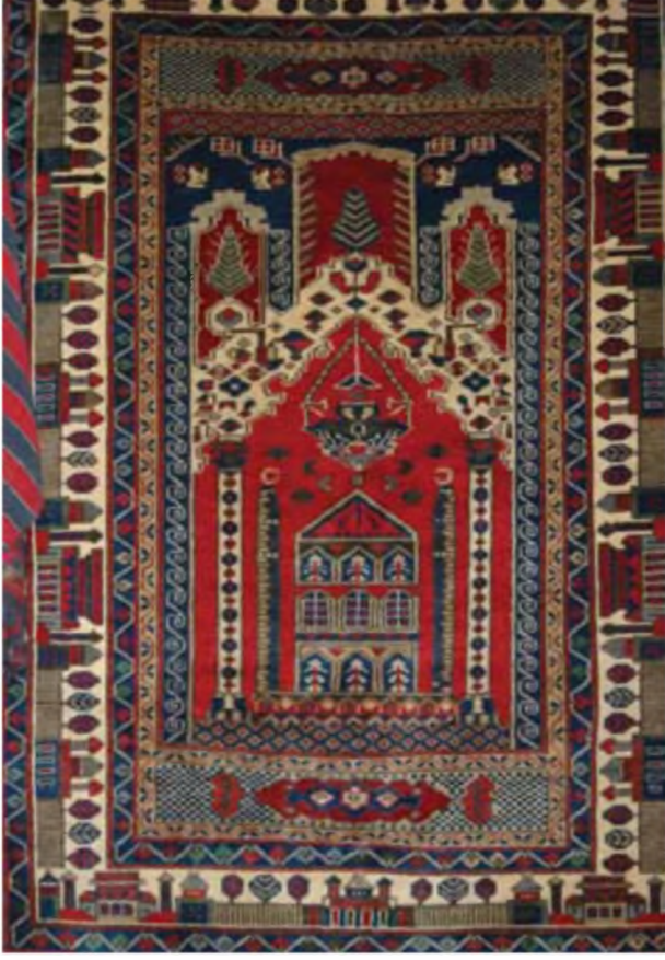
Foto 7. Çekirdekçi Halıcılıkta 1983–1994 Yılları Arasında Üretilen Halılar, Konya 2008.

leri tasarlanarak, yeniden dokunmuştur. Ayrıca kendi modellerini de yaratmışlar ve bu şekilde firma kendi tarzını ortaya koymuştur. Bu dönemde dokunan halıların %99'u ihraç edilmiştir. Firma bir dönem Kayseri, Nuzumla, Keçimuhsine ve Uşak-Eşme'de kilim ve cicim dokutmuştur (Foto 7). 1981'de 200 tezgâhla başlayan üretim; Konya merkez, Karapınar, Kütahya-Simav ve köyleri, Ereğli, Işıklar (Emirgazi), Emirgazi, Seydişehir, Beyşehir, Diyarbakır-Lice, Kars- Kağızman gibi şehirlerde 1987–1988 yıllarında 1500 tezgâhla devam etmiştir. Profil veya ağaç tezgâhlar kullanıldığı, köylünün kendi tezgâhını da kullandığı belirtilmiştir. Çalışanlara düğüm başına 30 kuruş ile 80 kuruş ücret ödendiği ifade edilmiştir. İpliklerin renklendirilmesinde indigo, Alman alizarin ve kökboya kullanılmaktaydı. Alizarinden kırmızının elde edildiği, bu rengin Uşak'ta bir firmaya boyatıldığı, indigonun ise kendi iplik fabrikalarında kullanıldığı, indigo ile mavi, lacivert, yeşil ve tonlarının elde edildiği ifade edilmiştir. 17