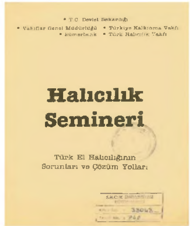
Foto 3. Halıcılık Semineri