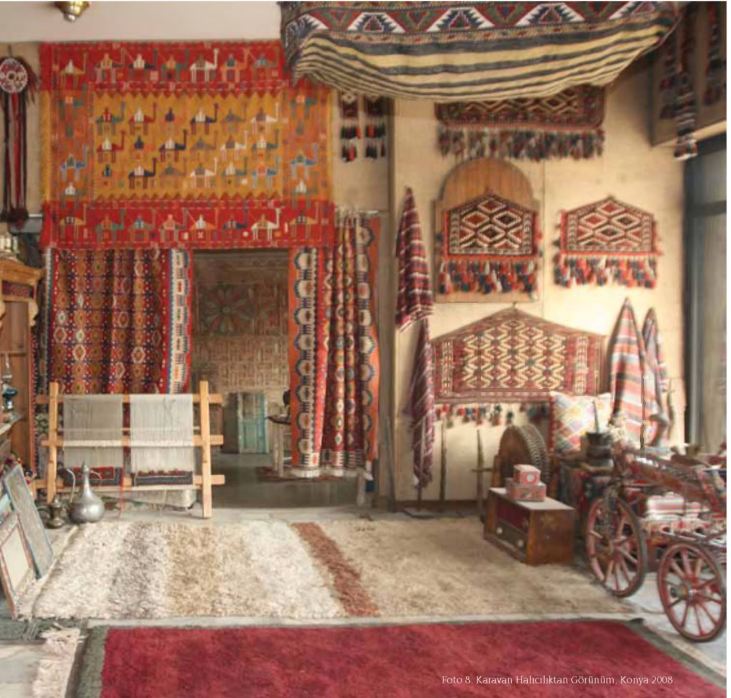
Foto 8. Karavan Halıcılıktan Görünüm, Konya 2008.

nın yaklaşık %15'ini üstlenmektedir. 19 İmalatın ilk yıllarında sadece halı üretimi yapıldığı, kazak modeli olarak bilinen türün yaygın olarak dokutulduğu belirtilmiştir. İmalatın yoğun yapıldığı yıllarda firma bünyesinde imalatı organize etmekte görevlendirilen üç personel çalıştırılmaktaydı, her biri 50 tezgâhtan sorumluydu. Firmanın 150 tezgâhta üretim yaptırdığı ifade edilmiştir. Bu üretimin Çukurçimen, Akviran, Kayasu (May) gibi merkeze yakın köylerde planlan-