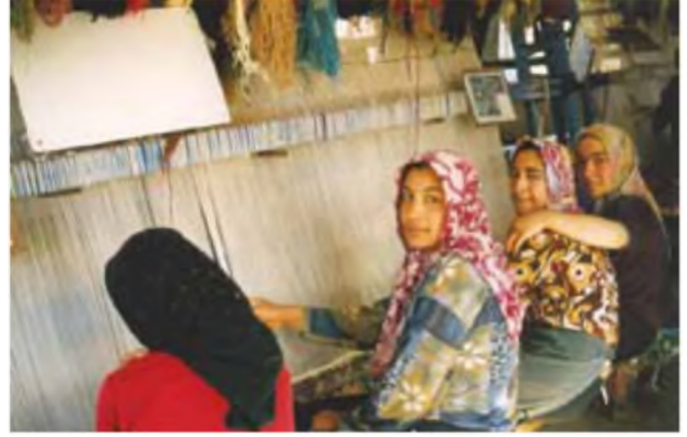
Foto 15. Sızma Halı Atölyesi, Sızma 2005.

ya çıkması ve işçilik kalitesindeki bozulmalar nedeni ile pazarlamak üzere sürdürülen halı dokumacılığı sona ermiştir. Bu atölyelerin dışında yörede köy halısı olarak adlandırılan yan halı tipinde çift olarak üretilen örnekler çeyizlik amacı ile dokunmuştur (Foto 14.) Günümüzde dokuma faaliyetleri hem ticari boyutta, hem de yöresel olarak yapılmamaktadır. Eski örnekler Lâdik evlerinde ulaşılabilir. 36