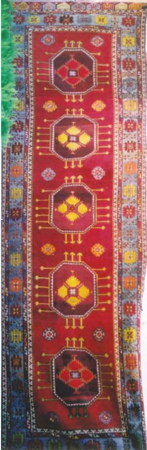
Foto 14. Lâdik Köy Halıları, Lâdik 2003.