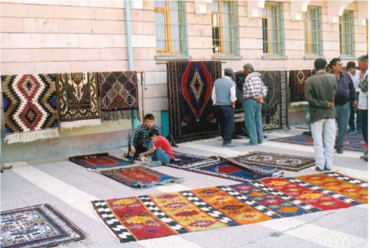
Foto 17. Ereğli Halı Pazarı, Ereğli 2002