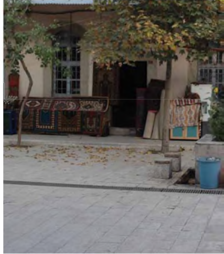
Foto 2. Konya Eski Dellal Pazarı, Konya 2008

1940 yılına ait verilerin bulunduğu bir yayında; bitkisel boyarmaddelerin bulunmasından dolayı Konya'da halıcılığın gelişmiş olduğu Sızma, Lâdik, Sille, Sarayönü'nde yetişen kökboya ve zencifreden elde edilen kırmızı boya sayesinde bu uğraşın yaygınlaşmış olduğu ifade edilmektedir. Konya ve çevresinde dokunan halıların Anadolu halıcılığı içinde Lâdik başta olmak üzere önem arz ettiği vurgulanmaktadır. Bu yayma göre bu yıllarda Konya'da dokunan halıların başlıcaları; Konya-Mezarlıklı, Konya-Lâdik, Konya-Karapınar, Konya-Keçimuhsine, Konya-Sille, Konya-Kavak, Konya-Saray, Konya-