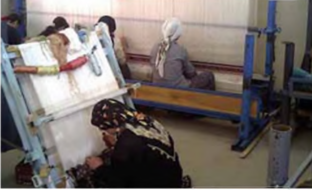
Foto 18. Akşehir İpek Halı Atölyesi, Akşehir 2003.

lığı olumlu yönde etkileyen ve sürdürülebilirliğini sağlayan en önemli unsur küçükbaş hayvancılığın yoğun olarak yapılmasıdır. Yörede halkın Direkli Karapınar, Salur halısı, Karapınar Lâdiği, Bulutlu halı (manzaralı), Hataplı (merdivenli) halı, Çavuşlu kilim, Saf seccade isimleri ile bildikleri dokuma örneklerini sıkça görmek mümkündür. Bölgenin potansiyelini değerlendirmek amacıyla, 2002 yılında Hotamış yöresinde "Hotamış Türkmen Kilimleri Projesi" hayata geçirilmiştir (Foto 16). Proje bir dönem sürdürülmüş ancak maddi kaynakların sınırlı olması nedeniyle durdurulmuştur.