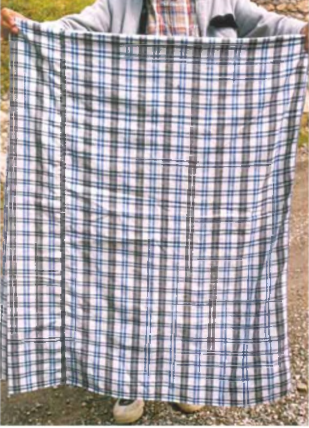
Foto 20. Hadim Bezi, Hadim 2004.