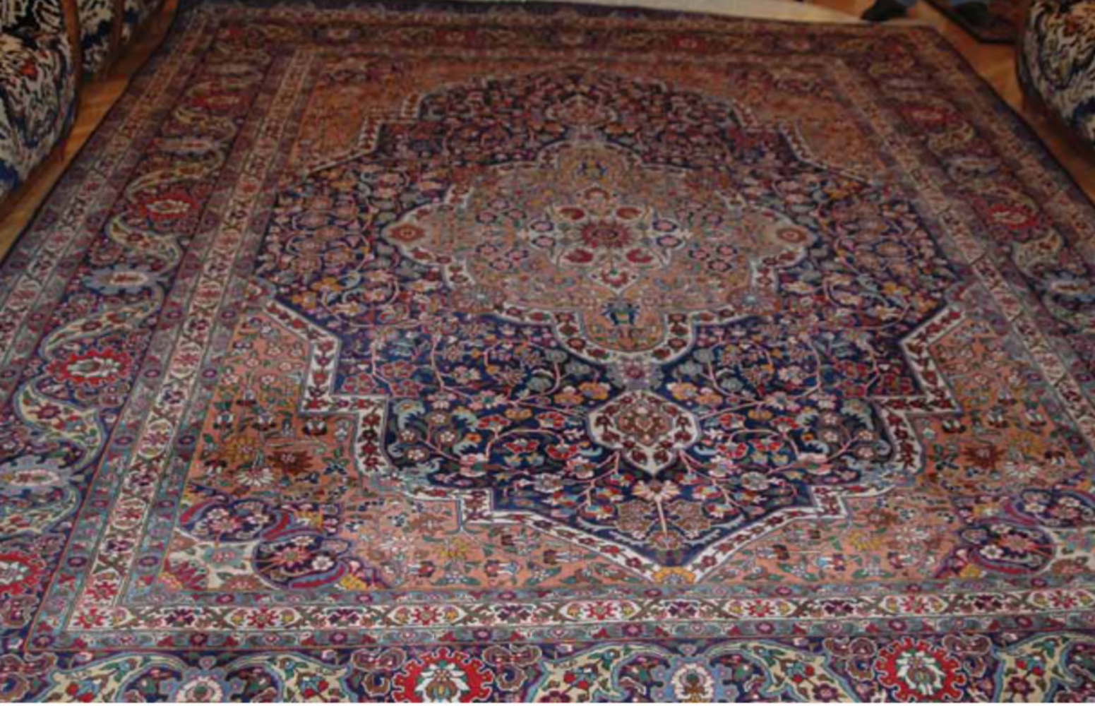
Foto 5. 1950' lerde Çekirdekçi Halıcılıkta Üretilen Halı