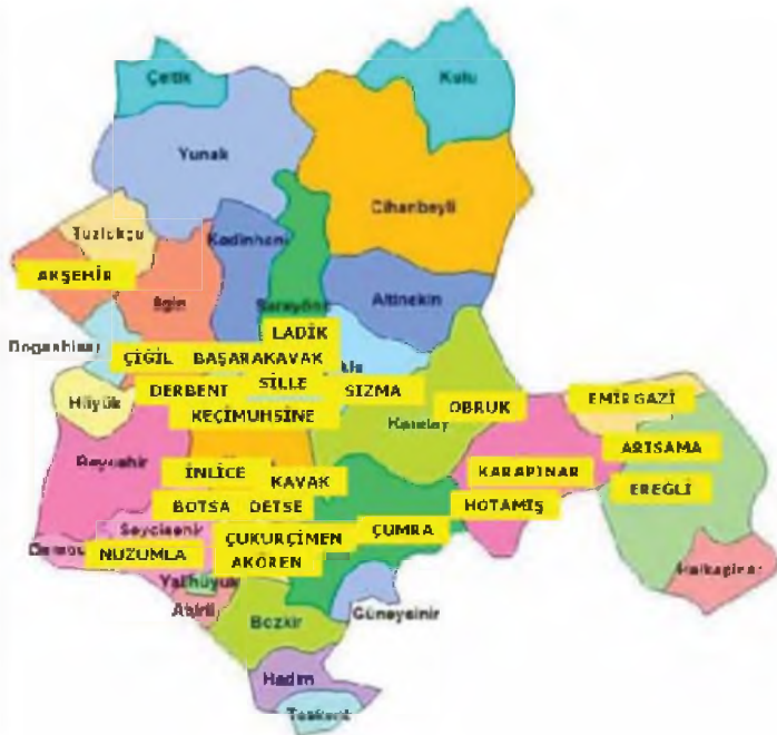
Harita 1. Konya Haritası

Konya, Selçuklular ve Osmanlı döneminden bu yana önemli bir dokuma merkezi olma özelliğini sürdürmüş, Cumhuriyet döneminde de bu önemli özelliğini korumuştur. Konya'da halen dokumacılığın sürdürüldüğü ve bilinen dokuma merkezleri Lâdik, Karapınar, Hotamış, Ereğli, Arısama, Emirgazi, Sille, Sızma, Keçimuhsine, Başarakavak, Derbent, Yaylacık (Nuzumlu), İnlice, Çukurçimen, Kavak, Detse, Botsa, Akören, Akşehir, Çiğil, Obruk, Çumra gibi yerleşim yerleridir (Harita 1). Bu merkezlerde coğrafi nedenlerden dolayı geniş ölçüde hayvancılığın yapıyor olması ve boyarmadde olarak kullanılan bitkilerin çeşitliliği, dokumacılığın gelişmesinde ve sürdürülmesinde etkili olmuştur.