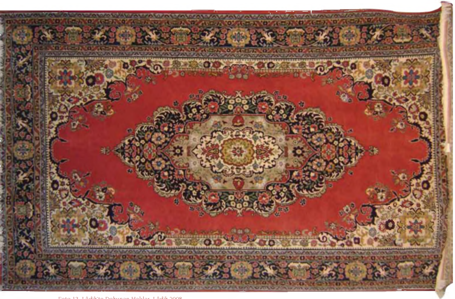
Foto 13. Lâdik'te Dokunan Halılar, Lâdik 2008.

rilmiştir. Bunlardan bazıları Akşehir Hereke Tarzı İpek Halı Üretimi Projesi, Hotamış Türkmen Kilimi Projesi, Çiğil Kilimi Üretim ve Dokuma Merkezi Projesidir. Bu projelerden bazıları devam etmekle birlikte, bu projeler kapsamında yörede tespit edilen eski örneklerden yola çıkılarak yeni örnekler üretilmeye devam etmektedir. 34