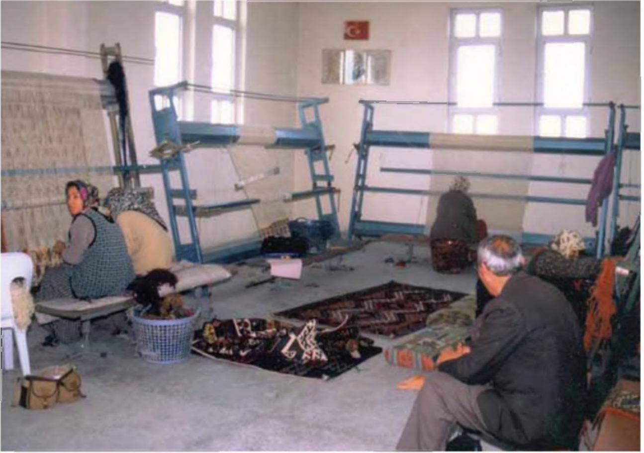
Foto 16. Hotamış Kilim Atölyesi, Hotamış 2002.