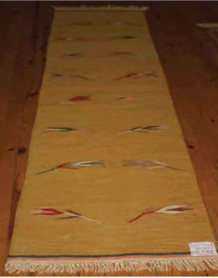
Foto 9. Genç Ortaklar Halıcılıkta Son Yıllarda Üretilen Laleli Kilim, Konya 2008.

da Konya'nın Hotamış, Obruk, Derbent, Detse, Botsa, İnlice, Kavak, Lâdik, Çiğil gibi tanınmış kilim örneklerini imal etmişlerdir (Foto 9). Bu üretimlerde yöresel özelliklerden taviz verilmediği belirtilmiştir. 21