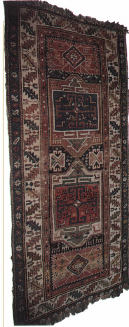
Resim/Picture 11 Halı Kafkas, 19. yüzyıl 1979, yılında satin alınmıştır. 99x205 cm. Env. No. 23662 99x205 cm 19 th century Carpet of Caucasian origin, purchased in 1979, Inv. 23662.

Carpet and kilim collections as well as paraperalia used by the weavers from such carpet-making centres as Bergama, Gördes, Karaman, Kırşehir, Kula, Ladik, Milas, Niğde and Uşak may also be seen in this Museum. Among the well-preserved examples of the anatolian metalworking art are the Mamluk cauldrons from 15 th century, ottoman sherbet pots, water dispensers, laundering bowls, trays, pans and candle scissors. Ottoman arches and arrows, flint pistols, muskets, swords and scimitars, Kütahya porcelains, objects worn and used by monks and fine examples of Turkish calligraphic art are also among the exhibited items. Throne from thirteenth century of Seljuk Emperor Keyhusrev III, coffin from fourteenth century of Ahi Sherafettin, altar from twelfth century of Taşgın Pasha Mosque at Damsa Village of Ürgüp in Nevşehir, lecterette from twelfth century of Ulu Mosque in Siirt and Portal from fifteenth century of Chelebi Sultan Medresseh in Merzifonare among the valuable objects of the Museum as some of the best examples of Turkish woodworking craftsmen's work.