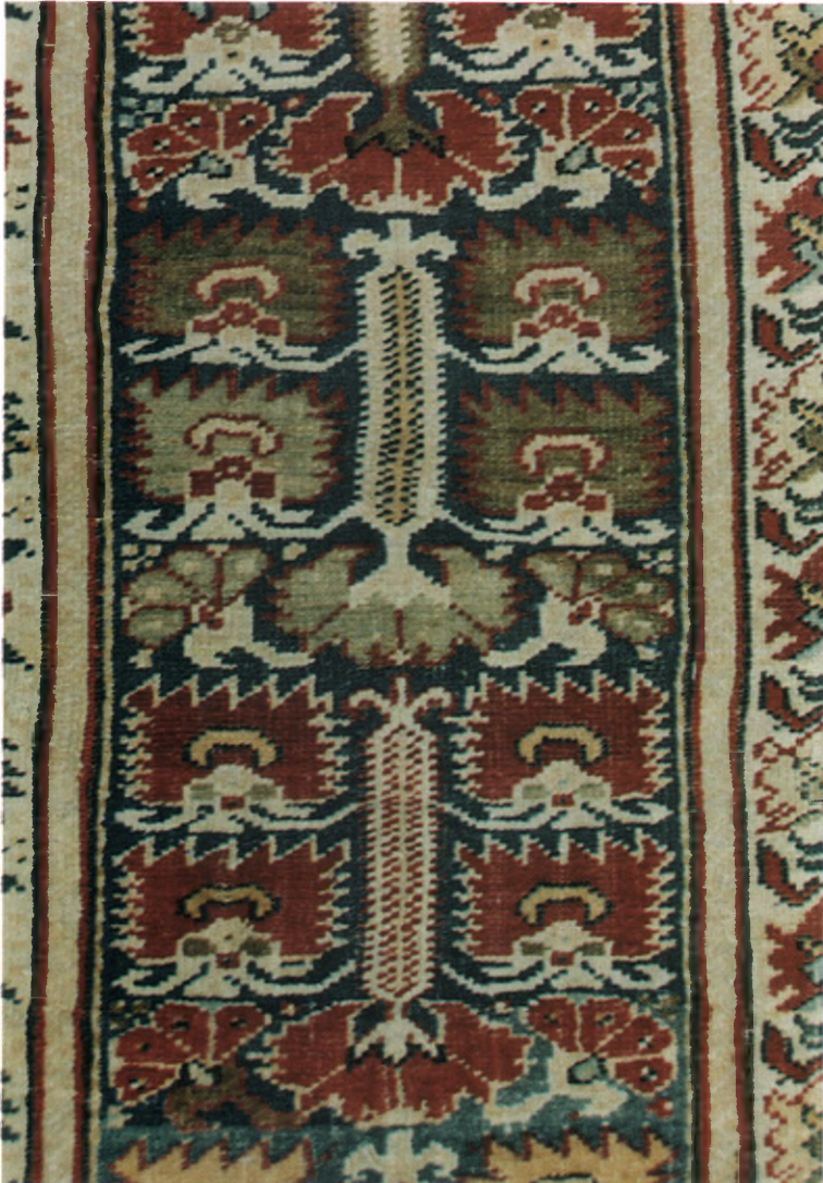
Resim/Picture 19 Resim 8'den ayrıntı. Detail of from Picture 8.