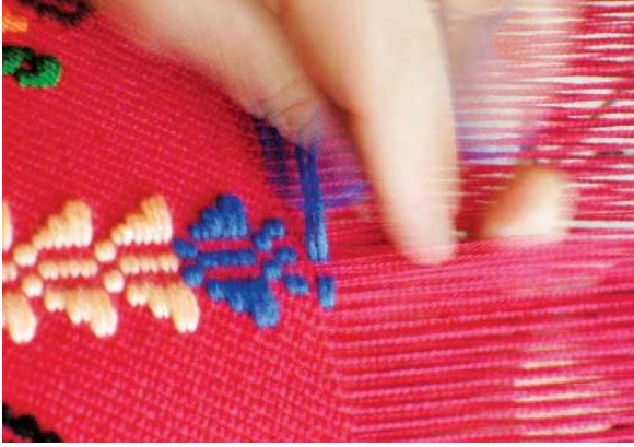
Fotoğraf 19: Karacakılavuz dokuma atölyesi ve dokuma örneği (Başaran, Yarmacı, 2017: 27-35)

Yurdumuzda üretilen el dokumalarına göre teknik olarak farklı özellikler taşıyan Karacakılavuz dokumaları, 4 gücülü dokuma tezgahlarında üretilmektedir. Zemin örgüsü dimi olan bu dokumalarda ayrıca renkli ipliklerle dokuma anında desenleme yapılmakta, desen iplikleri motif genişliğine bağlı olarak çözgü ipliklerinin üzerinden atlamalar yaparak oluşturulmaktadır.