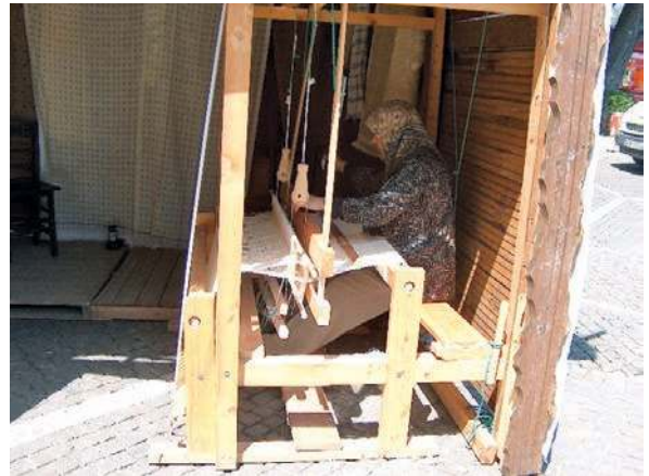
Fotoğraf 1: Eham dokumacılığında kullanılan tezgah (Başaran 2006)