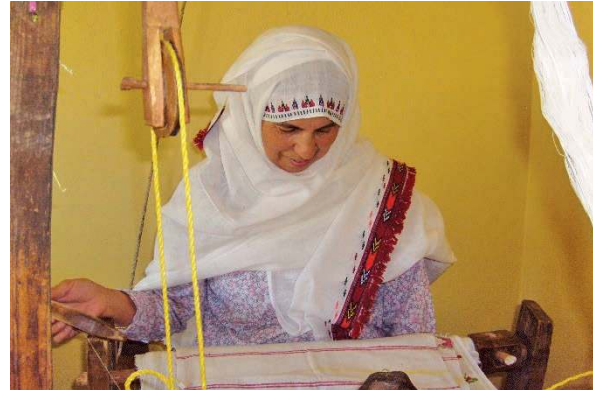
Fotoğraf 4-5: Tokalı örtmelerde desen dökümü ve dokuma işlemi (Başaran 2009)

Kastamonu’nun Selalmaz köyünde üretilen dokumalar da bezayağı örgü yapısındadır. Yörede “düz dokuma” olarak anılan bu bezlerin çözgü ve atkısında pamuk ile keten iplikler kullanılmaktadır. İplik numaraları çözgüde 20/2, 30/2, 40/2 ve 60/2, atkıda ise 20/1, 30/1, 40/1 ve 60/1’dir. Çözgü ve atkı ipliğinin dışında desen oluşturmak için bezeme ipliklerinden de yararlanılmaktadır. Düz