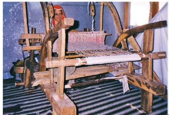
Fotoğraf 17-18: Pomak gelin kıyafeti ve dokuma tezgahı (Başaran 1996)