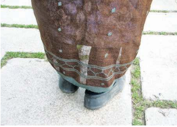
Fotoğraf 2: Ebrahim kullanımı (Prof.Dr. H. Feriha Akpınarlı arşivi, 2009)

Yöresel olarak renk açısından “beyaz eham, boz eham, mor eham vb” (Emir, 2005; 36); desenleme açısından ise “çiçekli ve düz ehamlar” olarak dokunmaktadır. Düz ehamlarda zemin ve renkli ipliklerle ek bir desenleme yapılmadan bezayağı tekniği ile çizgiler uygulanmakta, desenli ehamlarda ise düz zemin üzerine ilave renkli ipliklerle brokar tekniğine benzer şekilde desenleme yapılmaktadır. Günümüzde bu amaçla kullanılan bazı ipliklerin orlon olduğu gözlenmektedir. Bahsedilen yörelerde geleneksel yöntemlerle evlerde veya atölye ortamlarında yaşatılmaya çalışılmaktadır.