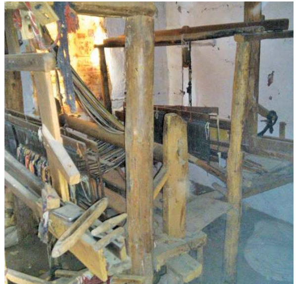
Fotoğraf 20-21: Kullanılamaz duruma gelmiş dokuma tezgahları (Arslan, 2016)