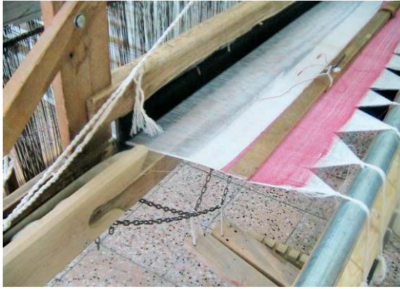
Fotoğraf 6-7: Selalmaz dokuma tezgahı (Özcan ve Başaran, 2016:116).

Şanlıurfa'da cülhacılık olarak anılan bez dokumalar hışvalı, şakkalı, direkli, puşu vb. isimlerle anılmaktadır. Bu bezlerin en büyük özelliği atkı ve çözüsünde düzenli olarak kullanılan çizgilemeler ile elde edilen kareli/ekoseli görünüm ve üretiminde kullanılan 4 gücülü çukur tezgahlardır. Atkı ve çözüsünde pamuk ve floş iplikler kullanılan ve sonrasında makinede işleme ile desenlendirilen dokumalar yöresel giysi ve ev dekorasyonlarında