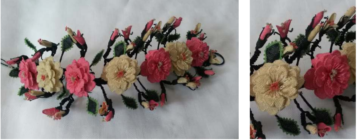
Fotoğraf 1: Gül Oyası Fotoğraf 1a: Detay görünüm (Kaynak Kişi: Nurten Güner)

Gül oyası, seksen yıl önce yapılmış bir taç oyasıdır. Taç gülü, baş gülü de denilmektedir. Gelin tacı olarak kullanılmaktadır. Gül oyasında, ipek iplik ile krem, pembe, yeşil, siyah renkler, at kılı, ince tel, kalın tel kullanılmıştır. Üçgen ve kare ilmek ile bitkisel ve geometrik motifler kullanılarak yapılmış, üç boyutlu bir oyadır. Yaprak kenarları, dik durmaları için at kılı ile çevrilmiştir. Saplar üzerine, yedi adet gül çiçekleri ile çevresine tomurcuklar ve dörtgen şeklindeki yapraklar ana-ara motifin aralıklı tekrarı olarak yerleştirilmiştir.