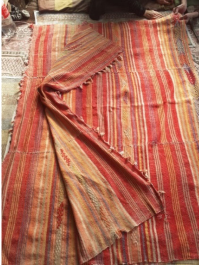
Resim 2: Kızılihram (Şavkar, 2019).

Kızılihramların süslemesinde renkli şeritlerin yanında ilave atkıyla yapılan cicim tekniği kullanılmaktadır. “Cicim, bezayağı dokumalar üzerine renkli ilave atkıyla yapılan havsız bir dokuma çeşididir.” 11