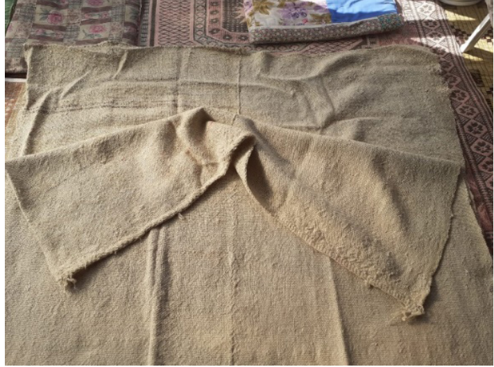
Resim 3: Akihram (Şavkar, 2019).

Yörüklerin yaptığı dokumalar arasında en kıymetlisi kabul edilen ince kalitedeki Kızılihramlar dokumada düz zemininde kırmızı rengin hakim olmasından dolayı bu ismi almıştır. 12 Yaşam biçimleri dolayısıyla çeyiz kültürünün pek gelişemediği Yörüklerde kızların en önemli çeyizleri rengârenk ve üzeri motiflerle süslenmiş olan Kızılihramlardır.