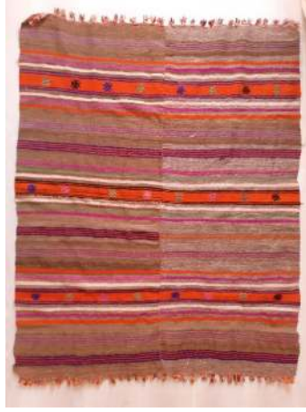
Resim 4: Ton Değişikliği Bulunan Kızılihram (Şavkar, 2019).

Geleneksel dokumalarımızı değerli kılan özgün desenlerinin yanı sıra kullanılan doğal boyarmaddelerdir. Doğal boyarmaddelerle yapılan boyamacılık sentetik boyalarla yapılan boyama işlemine göre biraz zahmetli olmakla beraber daha sağlıklı ve uzun ömürlü olmaktadır. Ham olarak doğal rengi ile kullanılan krem yün aynı zamanda çeşitli bitki türlerinin kök, kabuk, yaprak ve tohumlarının kaynatılması ile elde edilen renklerle de boyanmaktadır.