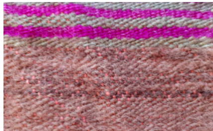
Resim 5: Deve Yününden Yapılan Kızılihram ve Detayı (Şavkar, 2019).

Daha çok koyun yününden yapılan ihramların, çok eski örneklerinde deve yününden yapılmış Kızılihram örnekleri bulunmaktadır (Resim 5). Kızılihramlarda farklı renk ve kalınlıklarda enine bantlar kullanılmıştır. Baş, orta ve son kısımlarındaki bantları cicim teknikli geometrik motifler süslemiştir. Dokuma yüzeyi boyunca yatay olarak kullanılan “çubuk motifi”, halk arasında “kuşak”, “tahta”, “yol” olarak da bilinmektedir (Resim 6). Ayrıca atkıda farklı renkte ipliklerle dokunmuş “dişeme” motifi kullanılmaktadır (Resim 7). Ayrıca cicim tekniğiyle “yaprak”, “göz”, “pıtrak”, “kelebek”, “su” gibi motiflerinin uygulandığı görülmektedir (Resim 8, 9,10,11,12).