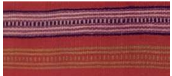
Resim 7: Dişeme Motifi (Şavkar, 2019).