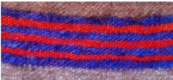
Resim 6: Çubuk Motifi (Şavkar, 2019).