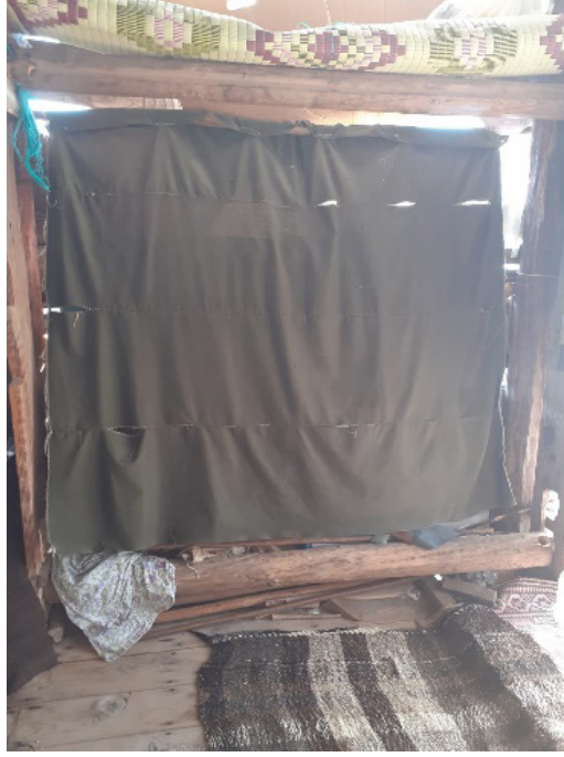
Resim 15: Istar Tezgâhı (Şavkar, 2019).