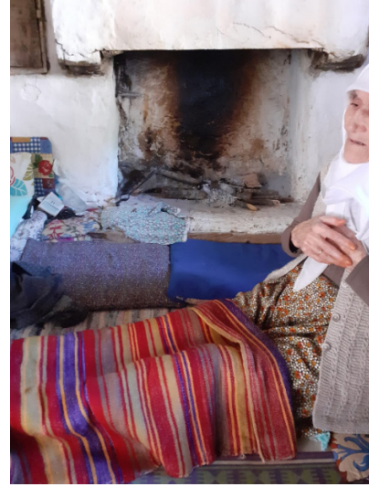
Resim 13: Seccade Olarak Kullanılan Kızılihramlar (Şavkar, 2019).

Yöredeki dokuma geleneği birçok merkezde olduğu gibi yaklaşık 30 yıl öncesine kadar devam etmiştir. Ekonomik gelişmeler, yöredeki tarım ve sera faaliyetleri, köyden kente göç ve bunun gibi çeşitli sebeplerden dolayı yaşanan değişimlerden sonra dokuma eylemi bırakılmıştır. Yörük yaşam tarzının ayrılmaz bir parçası olan dokumalar bugün çeyiz sandıklarında varlıklarını sürdürmektedir.