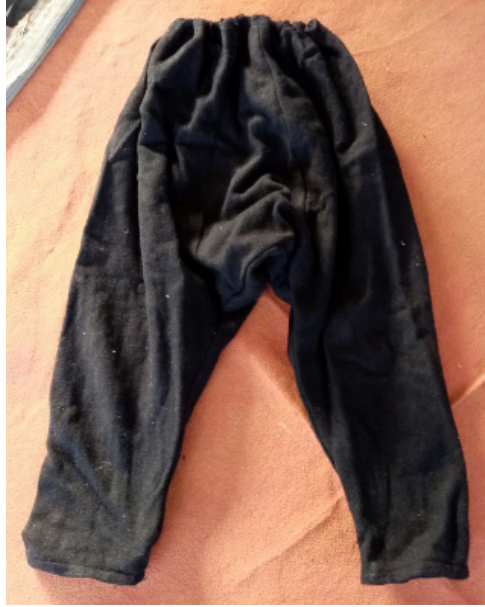
Resim 14: Dimi Örneği (Şavkar, 2019).

Akihramlar ise tek renk ya da sadece iki renkli olarak farklı kalınlıklarda enine bantlar şeklinde dokunmaktadır. Bu dokumada adından anlaşılacağı üzere yünün doğal rengi olan krem renginden adını almıştır. Sade dokumalar olup atkı yüzü dokuma tekniğinde dokunmuştur. Akihramlar ya da yöredeki bir diğer adı olan “gümül ihramlar” ise üzerinde motif bulunmayan göç sırasında yatak yorganların sarıldığı, susam çırpımda kullanılan dokumalardır. Ayrıca siyah yün ipliği ile dokunan Akihramlar erkeklere kuşakla bağlanan ve yörede “Dimi” denilen şalvar dikiminde kullanılmıştır (Resim 14).