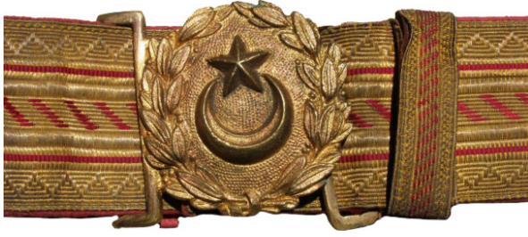
Fotoğraf 14: Erkân ve ümerâya mahsus sırma kemer takımı detay. 71