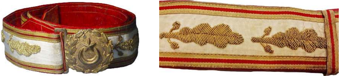
Fotoğraf 9: Merasimlerde büyük üniforma ile kullanılan sarı sırma işlemeli kemer ve işleme detayı. 64

Resmi tören ve ziyaretlerde sarı sırma kemer takılır. (Fotoğraf 9) Padişahların altın sırma ile imâl edilen kemerleri vardır. Tanzimattan sonra kemer tokaları Osmanlı Devleti arması ile gemi çapası, top namlusu ve güllesi, ayıldız gibi amblemler taşımıştır. 63 Süvâri sınıfına mensup paşalar arka kısmında küçük bir çanta bulunan sırma ile imâl edilmiş bir kemer kullanır.