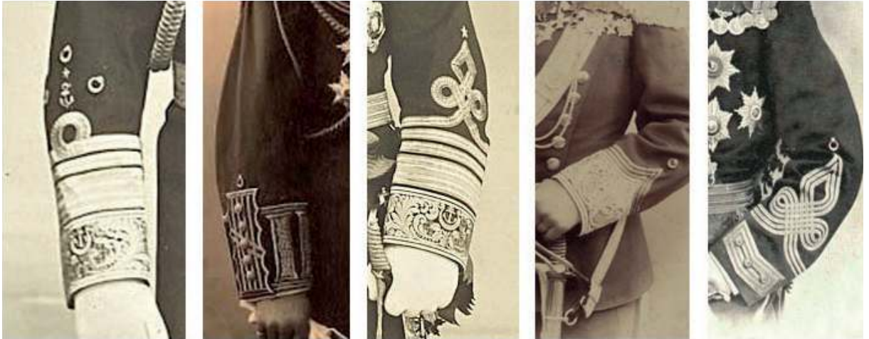
Fotoğraf 13: Üniformalarda işlemeli rütbe belirleyici kol detayı.