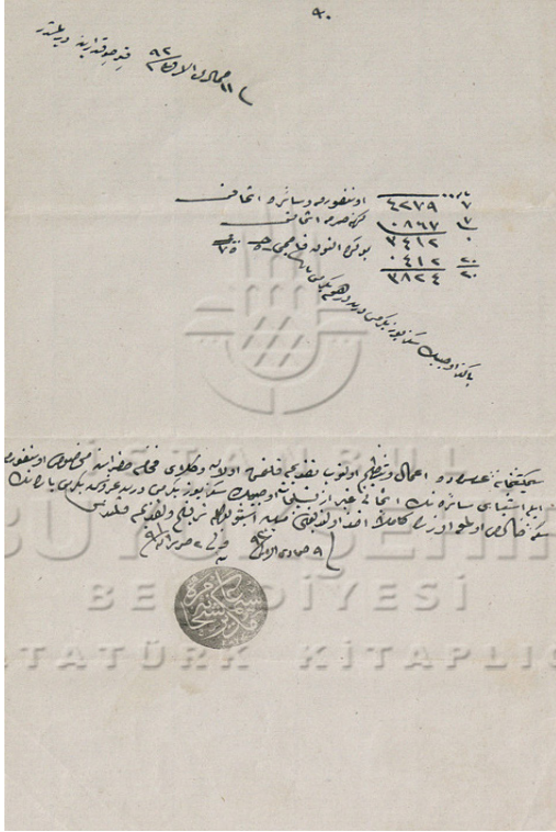
Ek-1: Simkeşhâne-i Âmire mühürlü makbuz senedi. 75