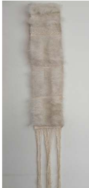
Fotoğraf 21: DÖNÜŞÜM, Siirt Battaniyesi Dokuma Tekniği, 70cm x18 cm, 2019, Mine Beşen Yalçın (Uluslararası III. SADA Disiplinlerarası Sanat Sempozyumu Sergisi, 29 Kasım 2019, Ankara)

Çalışmada, “Siirt battaniyesi dokuma tekniği” kullanılmıştır. Malzemesi, tiftik ipliği ve pamuk ipliğidir. Bezayağı (1/1), Dimi (2/2), Dimi 1/3, Saten (1/7) örgüsü kullanılmıştır. Dokuma sonrasında, yüzeyin bazı bölümleri tarama yapılarak tüylendirilmiş, bazı bölümler ise kullanılan örgünün dokumaya etkisini görmek adına tüyleri kesilerek kısaltılmıştır. Çünkü; İki boyutlu gibi algılansa da aslında boyu, eni herkesçe fark edilen ama derinliği hissedilen bir şeydi o. (Fotoğraf 21)