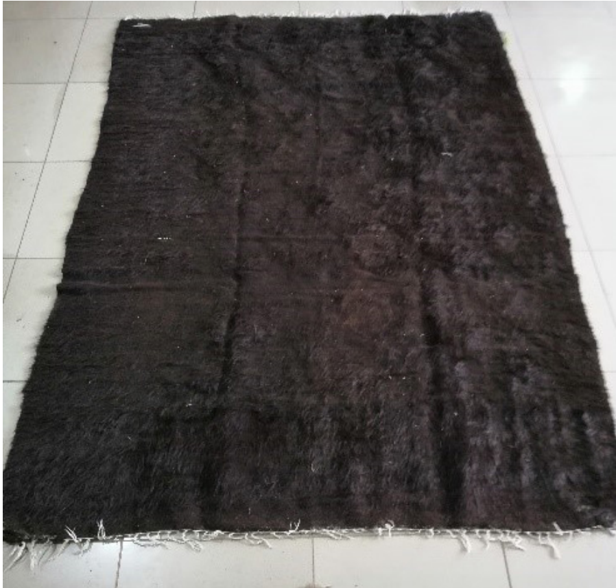
Fotoğraf 19: Siirt Battaniyesi, Fotoğraf: Mine Beşen Yalçın, 2018