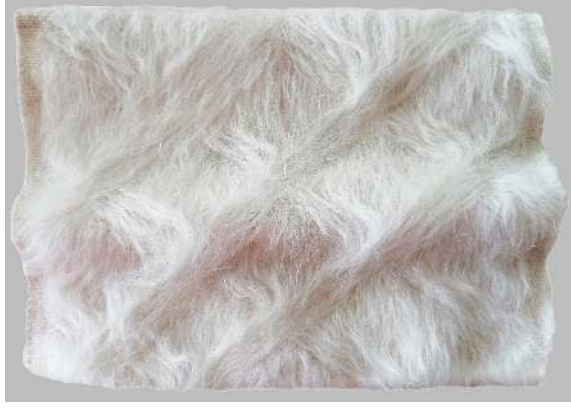
Fotoğraf 22: İSİMSİZ, Siirt Battaniyesi Dokuma Tekniği, 25 cm x 20 cm, 2020, Mine Beşen Yalçın.

Çalışmada, “Siirt battaniyesi dokuma tekniği” kullanılmıştır. Malzemesi, tiftik ve pamuk ipliğidir. Bezayağı B (1/1) örgüsü kullanılmıştır. Dokuma sonrası taranarak tüylendirme işlemi yapılmıştır. Tüylendirilmiş yüzeyde geometrik desen oluşturulmuştur. Tiftiğin parlaklığı ve uzunluğu sayesinde, tüylerinin taranması ile özel bir doku ile yüzeyde özgün bir hacim yaratılmıştır. Eğik hareketlerle sıradanlıktan kurtarılmak istenen bir hacim duygusunun en iyi ifadesi. (Fotoğraf 22)