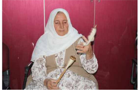
Fotoğraf 9: Siirt/Eruh, Kirmanda İp Eğiren Kadın, Günay Atalayer, Fotoğraf Arşivi, 2015 21