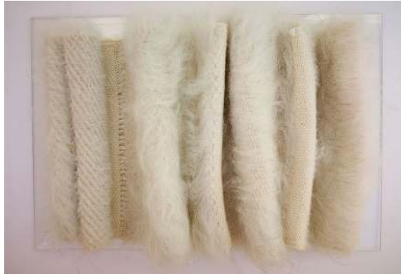
Fotoğraf 23: DÖNÜŞ, Siirt Battaniyesi Dokuma Tekniği, 25cm x 20 cm, 2020, Mine Beşen Yalçın.

Çalışmada, “Siirt battaniyesi dokuma tekniği” kullanılmıştır. Malzemesi, tiftik ve pamuk ipliğidir. Örgü: Bezayağı B (1/1) Dimi (2/2), Dimi 1/3, Saten (1/7) örgüsü, sıralı düzenli bir rapor ile kullanılmıştır. Dokuma sonrasında, yüzeyin bazı bölümleri tarama yapılarak tüylendirilmiş tüylü ve düz bölümlerde desen yapılmıştır. Dokuma belli aralıklarda katlanarak bir form oluşturulmuştur. Yalnızca dokumanın yüzeyinde dokulu bir zemin oluşturmaktan uzaklaşarak, hareket yaratmak için zeminin kendisi yükseltilmiş ve lifin özelliği ile boyutlandırma, ana hedef seçilmiştir. Eğer bir DÖNÜŞÜ tanımlamak isteseydim dokumada bu hareketi anlatmak için Büyük dalgalar diyebilirdim. (Fotoğraf 23)