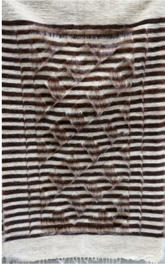
Fotoğraf 18: Tarama tekniđi ile Desenlendirilmiő Siirt Battaniyesi.