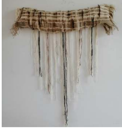
Fotoğraf 20: ANA, Siirt Battaniyesi Dokuma Tekniği, 100cm x40cm, 2019, Mine Beşen Yalçın (UMAY Dokuma Sanatçıları Sergisi, 12-18 Mart 2019, Mersin Üniversitesi GSF Sanat Galerisi)

nıldığı bölümlerde gerçekleşmiştir. Dokuma yatay bir şekilde, hacim oluşturularak sergilenmiştir. Görmek istediğimiz, tıpkı annemizin kolları gibi güçlü ve açık. (Fotoğraf 20)