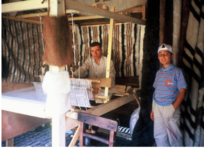
Fotoğraf 13: Siirt Battaniyesi Dokuma Aşaması. (Günay Atalayer, Fotoğraf Arşivi, 2015)

1.3. Tarama Tekniğiyle Tüylendirme: Dokuma yaklaşık 50 cm dokunduktan sonra, tüylendirme işlemi tezgâh üzerinde yapılır. (Fotoğraf 14) Tarama denilen bu işlemin amacı, ahşap tüylendirme tarağı aracılığıyla, atkıda kullanılan tiftik ipliğin taranarak tüylendirilmesidir. (Fotoğraf 15) Tarama işlemi sırasında dokuma gergin bir şekilde tutulur. Tiftik liflerinin dokuma yüzeyine çıkartılması sağlanır. Tarama sonrasında atkı da kullanılan tiftiğin bütün lifleri dokumanın arasından taranan yöne doğru dışarı çıkar. Böylece tüylendirme işlemi tamamlanır.