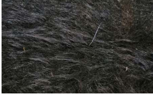
Ön Yüz (Detay)

“Siirt battaniyesinde” dokuma ile desenlendirme tekniği uygulanmaktadır. Bu tarama yöntemi ile desen yapma tekniğidir. Dokumanın yapısını tanımlamak gerekirse; çözgünün seyrek, atkının (kilim tekniğinde olduğu gibi) ince ve sık olduğunu, tüylendirmeye olanak sağlayan bir lifle yapıldığı ifade edilebilir. 4 çözgüye karşılık 16 atkı kullanılmaktadır. Bu sıklık ilişkisi dokuma analizlerinde görülmektedir. Tarama ve desenlendirme yapılmadan, bu haliyle sıradan bir kilim dokuma tekniğinden söz edebiliriz. Bu anlamda “Siirt battaniyesi” bir desenlendirme tekniği olarak ifade edilmelidir. Çünkü tüylendirip sonra tarama ile desen yapma, dokumanın temel özelliğini oluşturmaktadır.