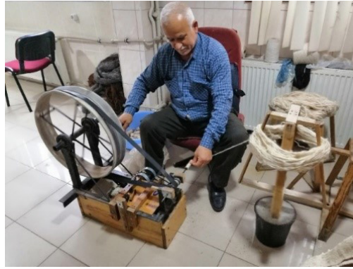
Fotoğraf 10: Tiftik Çilesinin Çıkrık Yardımıyla Masuraya Sarılması.