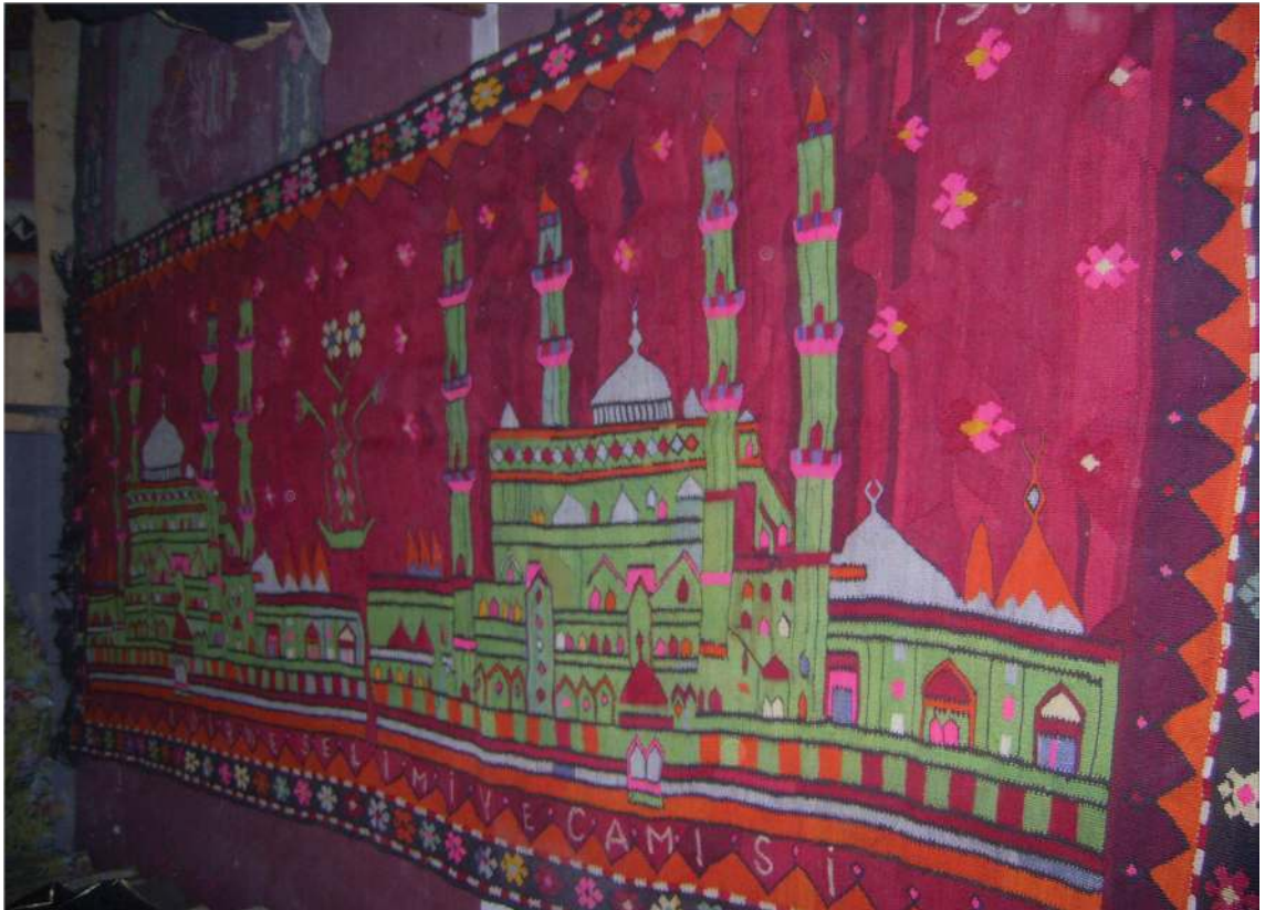
Fotoğraf 6: Cami Tasvirli Duvar Kilimi

Kırmızı zemin üzerinde iki adet cami kompoze edilmiştir. Cami, dört adet minare ve kubbeden meydana gelmektedir. Boşluklarda “purne motifi” (stilize çiçek) ve hayat ağacı motifleri yer almaktadır. Kilimin uzun kenarının bir tarafında “Edirne Selimiye Camisi, 1961” tarihli kitabe dikkati çekmektedir. İlikli kilim, iliksiz kilim ve konturlu kilim tekniğiyle dokunan kilimin saçakları, bükülerek temizlenmiştir. Yörede saçakların bu teknik ile temizlendiği farklı örnekler de incelenmiştir. Kilim sağlam olarak duvarda sergilenmekte ve muhafaza edilmektedir (Fotoğraf 6-7).