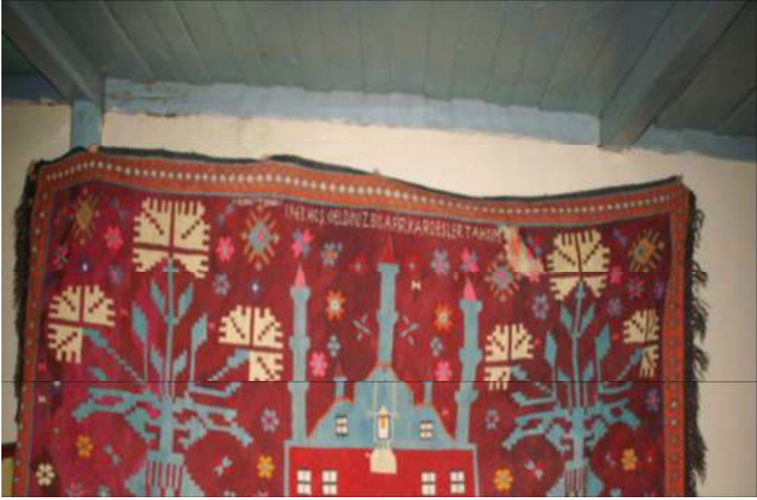
Fotoğraf 8: Cami tasvirli duvar kilimi