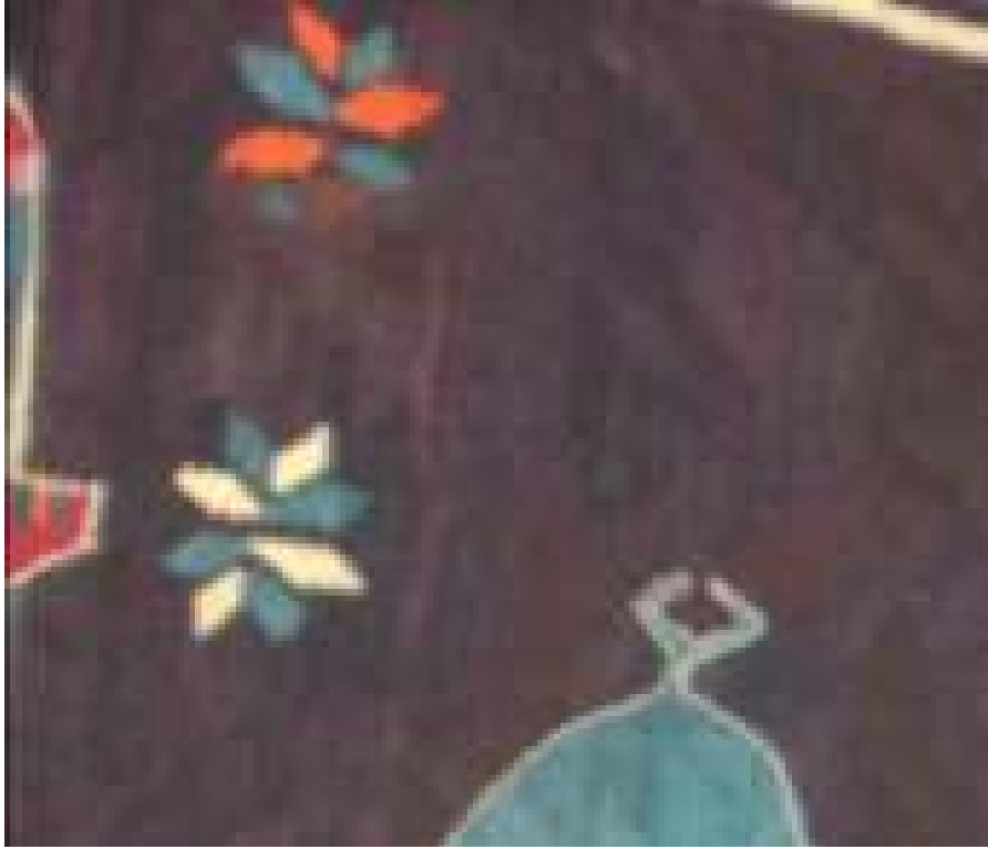
Fotoğraf 11: Serbest olarak zemine yerleştirilmiş “kilim yaprağı (yıldız) motifleri

Kompozisyon; Dokuma, kalın kenar kuşağı ve zeminden oluşmaktadır. Kenar kuşakta bordo zemin içinde dal ve yaprak motifi (stilize çiçek) görülmektedir. Kuşak; mavi, siyah, beyaz renklerden oluşan “taraklı” motifiyle (tarak) çevrenmiş, zemin üçe bölünmüş ve içi cami tasviri ile kompoze edilmiştir. Üç katlı olarak dokunan cami, kubbe ve minarelerden oluşmaktadır. Bu kompozisyon kilim eninde üç kez farklı renklerde tekrarlanmıştır. Boşluklarda “kilim yaprağı” motifleri (yıldız) serbest olarak yer almıştır. (Fotoğraf 11).