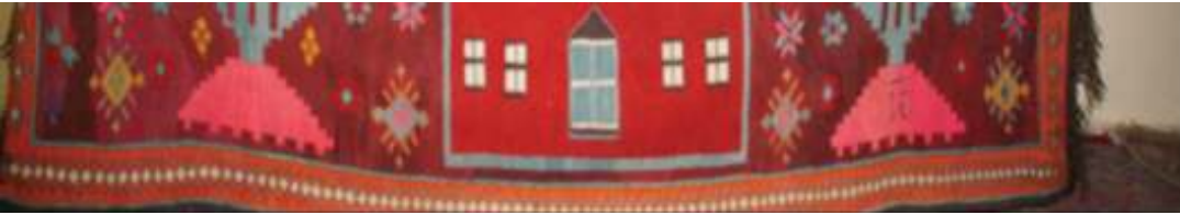
Fotoğraf 9: Cami tasvirli duvar kilimi detay