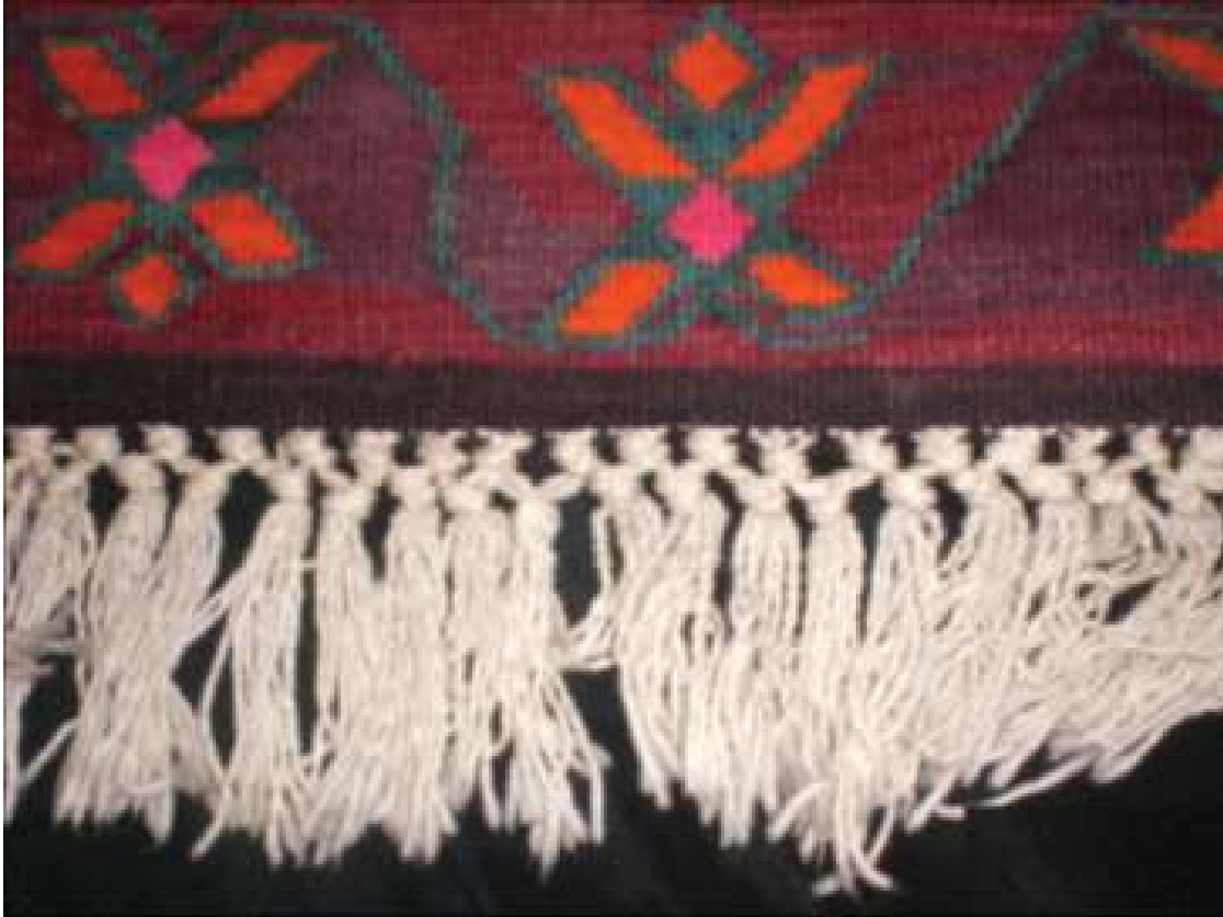
Fotoğraf 14: Cami tasvirli duvar kilimi saçak detayı