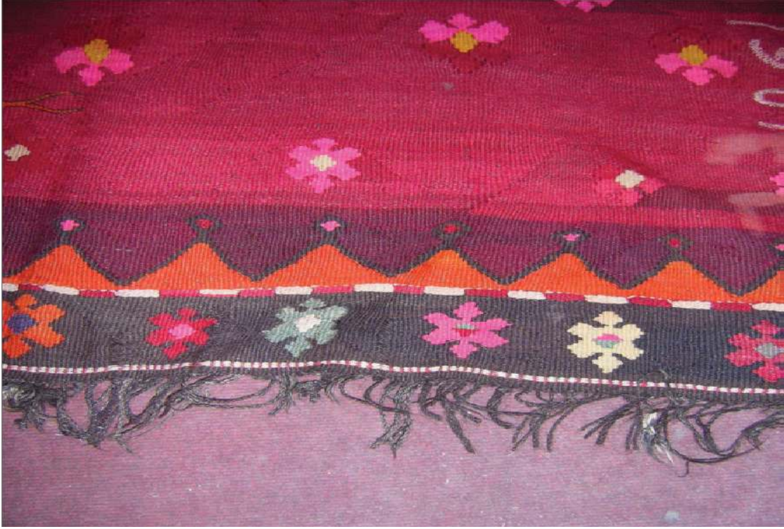
Fotoğraf 7: Cami Tasvirli Duvar Kilimi Saçak Detayı