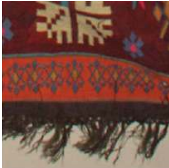
Fotoğraf 10: Cami tasvirli duvar kilimi saçak detayı