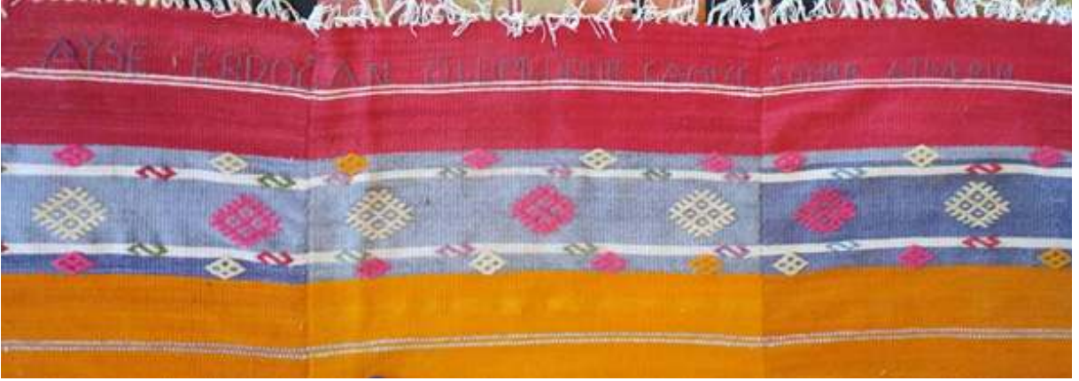
Fotoğraf 2: Ayşe Erdoğan'a ait ölümlük kilim (S. Sökmen, Çameli Kolak mahallesi camisi, 2019).