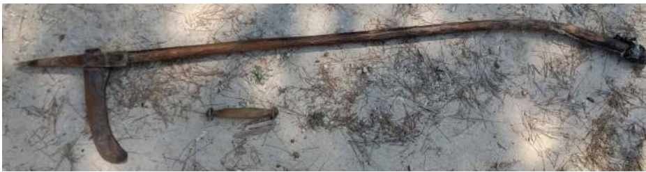
Fotoğraf 8: Yay ve Tokmağı (S. Sökmen, Cevizli Mahallesi Kavalcılar Mevki, 2019).

3.2.6. Yay ve Tokmağı: Kırkılıp temizlenmiş yün liflerin birbirinden ayrılması için yay ve tokmağı kullanılır (Fotoğraf 8). Ağaçtan yapılmış yaya, yörede giriş adı verilen ve keçi bağırsağından yapılmış ip takılır. Tokmak ile kirişe vurularak ipi oynattıkça yün kabartma işlemi gerçekleştirilir. 26