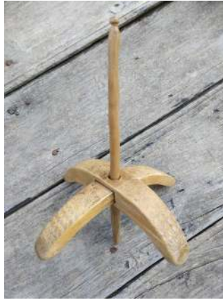
Fotoğraf 7: Kirmen(S. Sökmen, Cevizli Mahallesi Şervin Mevki, 2019).

3.2.5. Kirmen: İp eğirmek için kullanılan, yaklaşık 20-25 cm uzunluğunda, bir çubuğa (+) şeklinde geçirilmiş, iki ahşap parçadan meydana gelen alettir (Fotoğraf 7). 25