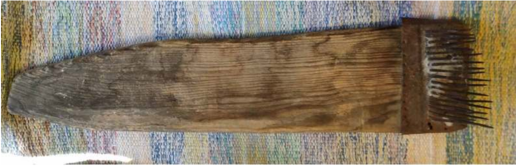
Fotoğraf 5: Yün Tarağı (S. Sökmen, Çameli Cevizli Mahallesi, 2019)

3.2.3. Yün Tarağı: Kemik saplı ve demir dişli bir alettir. 23 Çameli yöresinde kullanılan yün tarağı örneği fotoğraf 5’de görülmektedir.