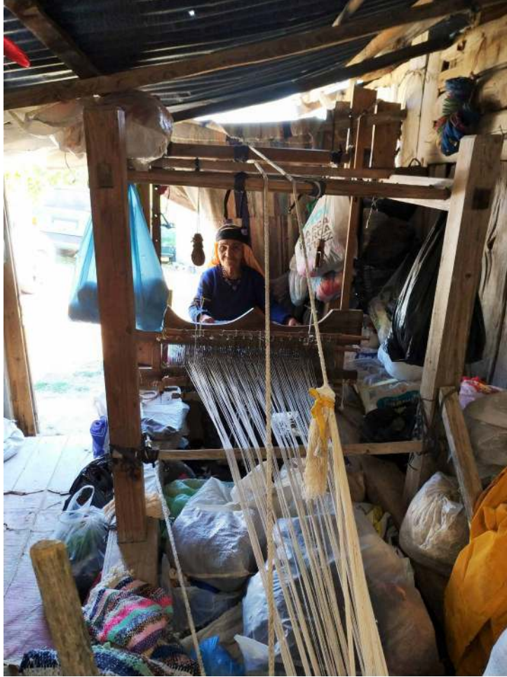
Fotoğraf 3: Durkadın Öğüt'e ait Mekikli Dokuma Tezgâhı (S. Sökmen, Cevizli Mahallesi Şervin Mevki, 2019).

Gücüler çirışlenerek kayganlığı ve dayanıklılığı arttırılmış pamuk ipliğinden oluşur. 20 Kilimler düvende parçalar halinde dokunup çatki dikişii ile birleřtirilmektedir (Fotoğraf 10). Yörede düvende dokunup birleřtirilen bu dokumalara “erhem” denilmektedir. 21