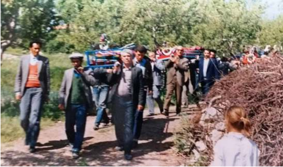
Fotoğraf 1: Çameli'de 1986 yılında çekilmiş bir fotoğrafta cenaze merasimi.

Fotoğraf 1'de Çameli ilçesinde 1986 yılında çekilmiş cenaze töreni fotoğrafında, cenazelerin kilime sarıldığı, sal denilen tabutlarda taşındığı görülmektedir. Cenazeden sonra kilimler camiye vakfedilmektedir. Fotoğraf 2'de Çameli Kolak mahallesi camisinde tespit edilen bir kilimde "Ayşe Erdoğan ölümlüdür camiye sonra atıverin" yazısı bu kilimin yöre tabiriyle "Ayşe Erdoğan'ın ölümlüğü" yani ölümlük kilimi olduğu ifade etmektedir.