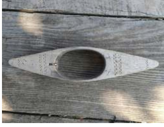
Fotoğraf 6: Mekik (S. Sökmen, Cevizli Mahallesi Şervin Mevki, 2019).

3.2.5. Kirmen: İp eğirmek için kullanılan, yaklaşık 20-25 cm uzunluğunda, bir çubuğa (+) şeklinde geçirilmiş, iki ahşap parçadan meydana gelen alettir (Fotoğraf 7). 25