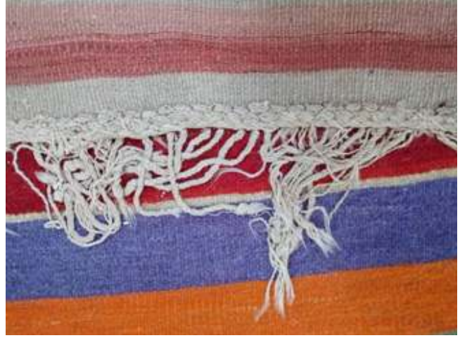
Fotoğraf 11: Toka Örgüsü ve Bükme Örgü (Sultan Sökmen, Çameli, 2019)