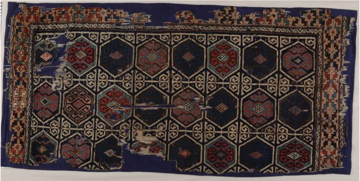
Fotoğraf 2: Batı Anadolu halısı, 18-19.yy. İstanbul Türk ve İslam Eserleri Müzesi

Fotoğraf 2'de İstanbul TİEM'de bulunan 291 envanter numaralı, Manisa'dan getirilmiş, 227x106 cm. ölçülerindeki 18-19. yüzyıl batı Anadolu halısında, koyu renk zemin üzerinde yanyana üç, üst üste sekiz sıra altıgen motif işlenmiştir. Bunların içlerinde dört yöne uzanmış karşılıklı koçboynuzu ve eli belinde motifleri bulunur. Altıgenlerin aralarında kalan boşluklarda beyaz renkli karşılıklı eli belinde motifleri işlenmiştir. Yerinde yapılan incelemede altıgenlerin içlerinde ve birçok yerde alternatif çözümlerin bağlandığı Türk düğümü görülmektedir.