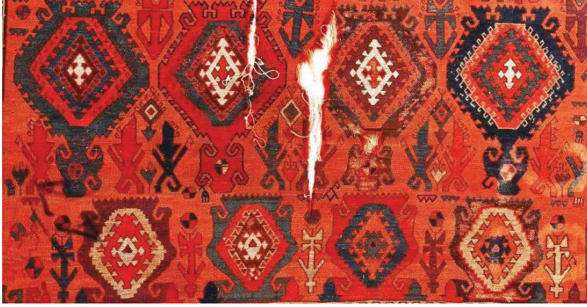
Fotoğraf 14: 17. yy. Şarkışla halısının sırtından görünüş. Sivas Gök Medrese Vakıf Müzesi (Müze Arşivi)

Fotoğraf 14'de Sivas Gök Medrese Vakıf Müzesinde bulunan 17. yüzyıla ait Şarkışla halısında, alternatif çözümlerin bağlandığı Türk düğümünün, halının sırtından görünüşü yer almaktadır.