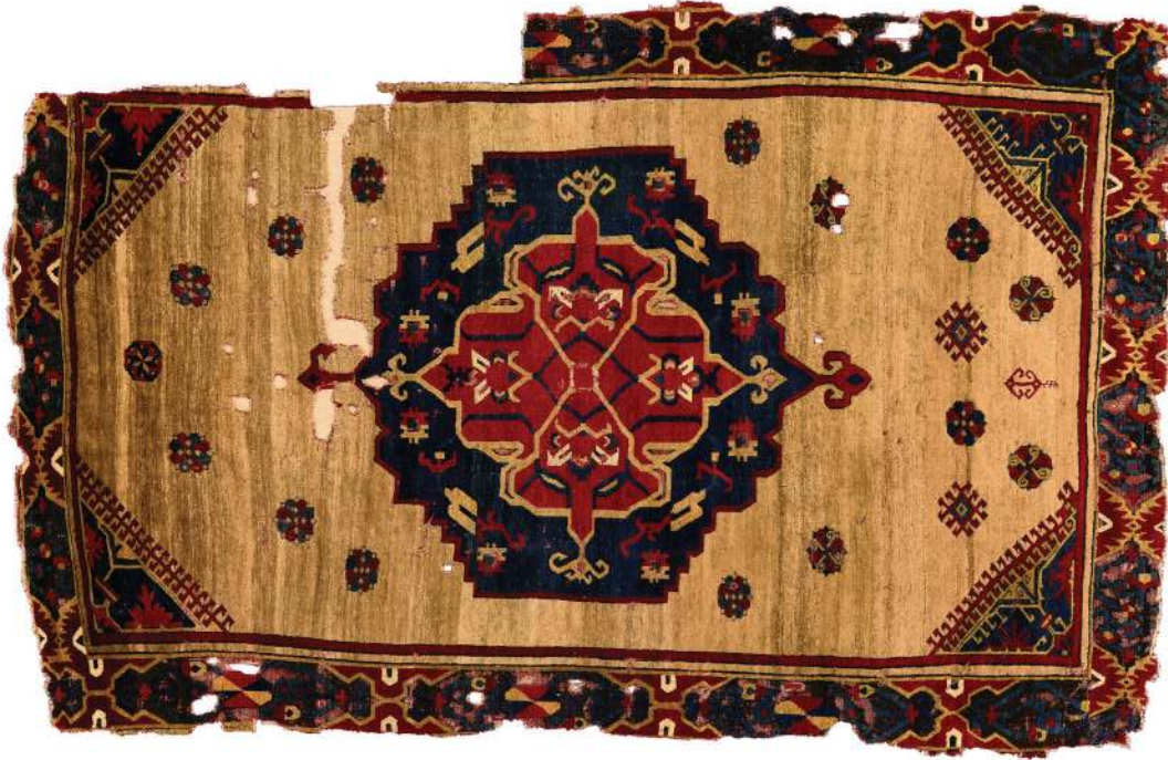
Fotoğraf 5: 16.yy. sonu madalyonlu orta Anadolu halısı. İstanbul Vakıflar Halı Müzesi

Fotoğraf 5'deki, İstanbul Vakıflar Halı Müzesinde bulunan E.22 envanter numaralı, Ankara Vakıflar Galerisinden getirilmiş, 257x161 cm. ölçülerindeki, 16. yüzyıl sonuna tarihlenen madalyonlu halının bazı kısımlarında, özellikle madalyonun içinde kaydırmalı düğüm sıraları yer almaktadır. 17 Hangi camiden alındığı bilinmeyen bu halının Konya Karapınar, Karaman veya Sivas yörelerinde dokunmuş olabileceği ifade edilmektedir. 18 Aynı madalyon şeması ve kaydırılmış düğüm kullanımı 16. yüzyıl Sivas halılarında da bulunmaktadır. Söz konusu halıda, madalyonun içindeki desenler, Konya Karapınar halılarından Salur modeli denilen göbekli Karapınar halılarının 19 18-19. yüzyıl örneklerine de benzemektedir.