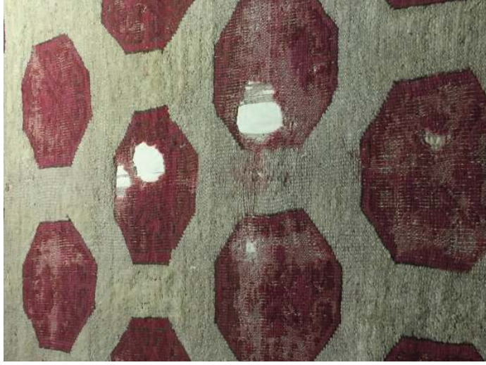
Fotoğraf 1: Devetabanı motifli Selçuklu halısından detay. İstanbul Türk ve İslam Eserleri Müzesi (S. Bayraktaroğlu)

Fotoğraf 2'de İstanbul TİEM'de bulunan 291 envanter numaralı, Manisa'dan getirilmiş, 227x106 cm. ölçülerindeki 18-19. yüzyıl batı Anadolu halısında, koyu renk zemin üzerinde yanyana üç, üst üste sekiz sıra altıgen motif işlenmiştir. Bunların içlerinde dört yöne uzanmış karşılıklı koçboynuzu ve eli belinde motifleri bulunur. Altıgenlerin aralarında kalan boşluklarda beyaz renkli karşılıklı eli belinde motifleri işlenmiştir. Yerinde yapılan incelemede altıgenlerin içlerinde ve birçok yerde alternatif çözümlerin bağlandığı Türk düğümü görülmektedir.