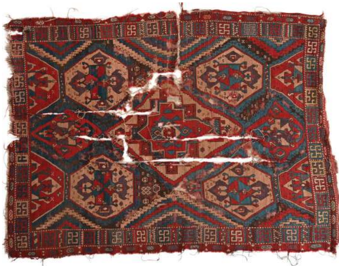
Fotoğraf 11: 17. yy. Şarkışla halısı, Sivas Gök Medrese Vakıf Müzesi

Fotoğraf 11'deki Sivas Şarkışla Büyük Camiinden Sivas Gök Medrese Vakıf Müzesine getirilen, 10 numaralı, 216 x 154 cm. ölçülerindeki, 17. yüzyıl Şarkışla halısında, içi farklı desenlerle dolgunlu, çeşitli ölçülerde ve konumlarda altıgenler işlenmiştir. Halının tamamında alternatif çözümlerin bağlandığı Türk düğümü bulunur.