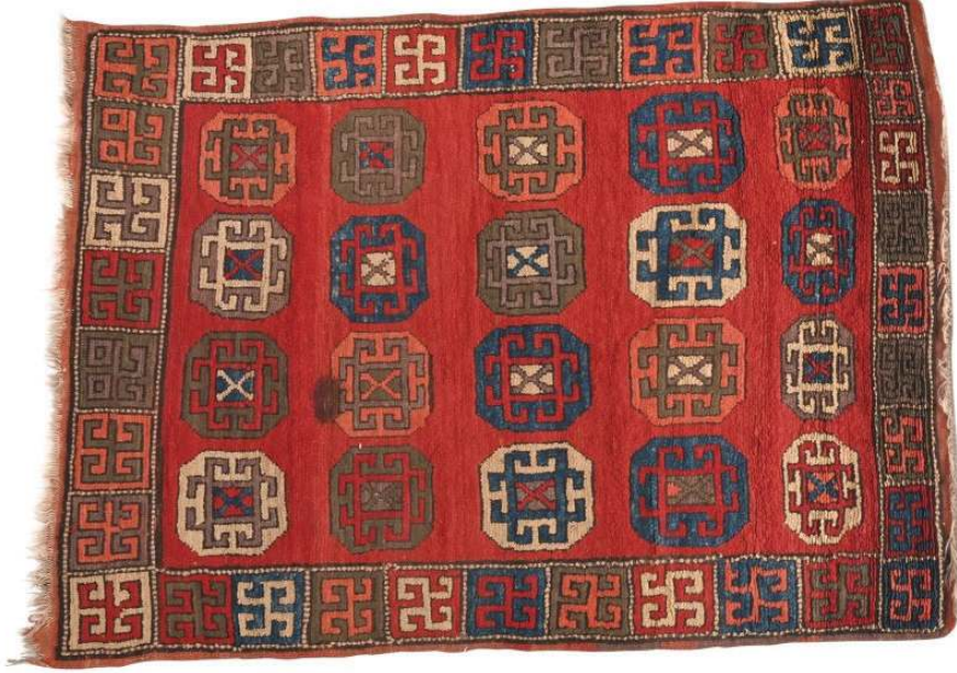
Fotoğraf 12: 17. yy. Şarkışla halısı. Sivas Gök Medrese Vakıf Müzesi (Müze arşivi)

Fotoğraf 12'deki Sivas Şarkışla Büyük Camiinden Sivas Gök Medrese Vakıf Müzesine getirilen, 2 numaralı, 124 x 178 cm. ölçülerindeki 17. yüzyıla ait Şarkışla halısında, içi koçboynuzu desenli, yanyana dört, boyuna beş sıra sekizgenler yerleştirilmiştir. Halının tamamında alternatif çözümlerin bağlandığı Türk düğümü bulunur.