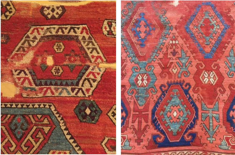
Fotoğraf 13 a-b: 17. yy. Şarkışla halılarından detaylar. Sivas Gök Medrese Vakıf Müzesi (S. Bayraktaroğlu)

Fotoğraf 13 a-b'de Sivas Gök Medrese Vakıf Müzesinde bulunan 17. yüzyıla ait Şarkışla halılarında, alternatif çözümlerin bağlandığı Türk düğümünün halı yüzeyindeki görünüşü yer almaktadır.