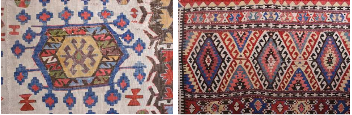
Fotoğraf 15 a-b: Anadolu kilimlerinden detaylar. Ankara Vakıf Eserleri Müzesi (Müze Arşivi)

Kaydırmalı düğümün kullanıldığı halılardaki desenlerin çoğu, Anadolu kilimlerinde de görülür. Örneğin Fotoğraf 15 a-b'de Ankara Vakıf Eserleri Müzesinde bulunan bir Orta Anadolu kiliminde "Türkmen Gülü" veya "göl" denilen altıgen madalyonlar ile aynı müzeden bir Fethiye kiliminde kenarları kancalı baklavalalar yer almaktadır. Bu örneklerden de anlaşıldığına göre Anadolu kilimleri ile kaydırmalı Türk düğümü kullanılan halılar arasında büyük oranda ortak yönler bulunmaktadır.