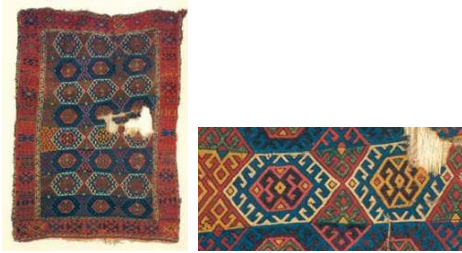
Fotoğraf 6 a-b: 17.yy. Elazığ-Malatya civarı halı ve detayı. İstanbul Vakıflar Halı Müzesi (Müze arşivi)

Fotoğraf 7'de Diyarbakır Çermik Ulu Camii'nden alınan ve Gaziantep Mevlevihane'si Vakıf Müzesinde bulunan 17. yüzyıl ait halı parçasında yanyana ve üst üste altıgenler işlenmiştir. Bunların içerisinde de kenarları kancalı altıgenler ve merkezde karşılıklı koçboynuzları bulunur. Koyu kırmızı, lacivert, sarı ve beyaz renkler kullanılmıştır. Halının tamamında alternatif çözümlerin bağlandığı Türk düğümü bulunur.