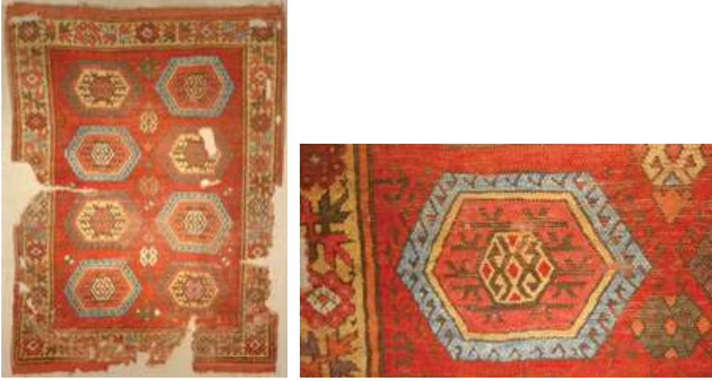
Fotoğraf 8 a-b: 17.yy. Şarkışla halısı ve detayı, Ankara Vakıf Eserleri Müzesi. (S. Bayraktaroğlu)

dalyonlar Türkmen halılarında “göl” motifi olarak adlandırılan sekizgen şeklindeki Salur Gölü motifiyle benzerlik göstermektedir. 21