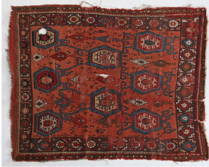
Fotoğraf 10: 17. yy. Şarkışla halısı, Sivas Gök Medrese Vakıf Müzesi (Müze arşivi)

Fotoğraf 10'daki Şarkışla Büyük Camiinden Sivas Gök Medrese Vakıf Müzesine getirilen 29 numaralı, 186 x 146 cm. ölçülerindeki 17. yüzyıla ait Şarkışla halısında, kaydırılmış eksenlerde yerleştirilmiş birbirine bağlı altıgenler işlenmiştir. Buradaki altıgenler Berlin Dahlem Müzesindeki Envanter 1. 46/59 numaralı halı parçasındaki altıgenlere ve Ankara Vakıf Eserleri Müzesindeki 2072 numaralı halıdaki altıgenlerle benzerdir. Halının ana bordürü ise Dahlem'deki halı (Fotoğraf 3), TIEM'deki 291 numaralı halı (Fotoğraf 2) ve Sivas Gök Medrese Vakıf Müzesindeki 609 numaralı Şarkışla halısı (Fotoğraf 8) ile aynı desene sahiptir. Halının tamamında alternatif çözümlerin bağlandığı Türk düğümü bulunur.