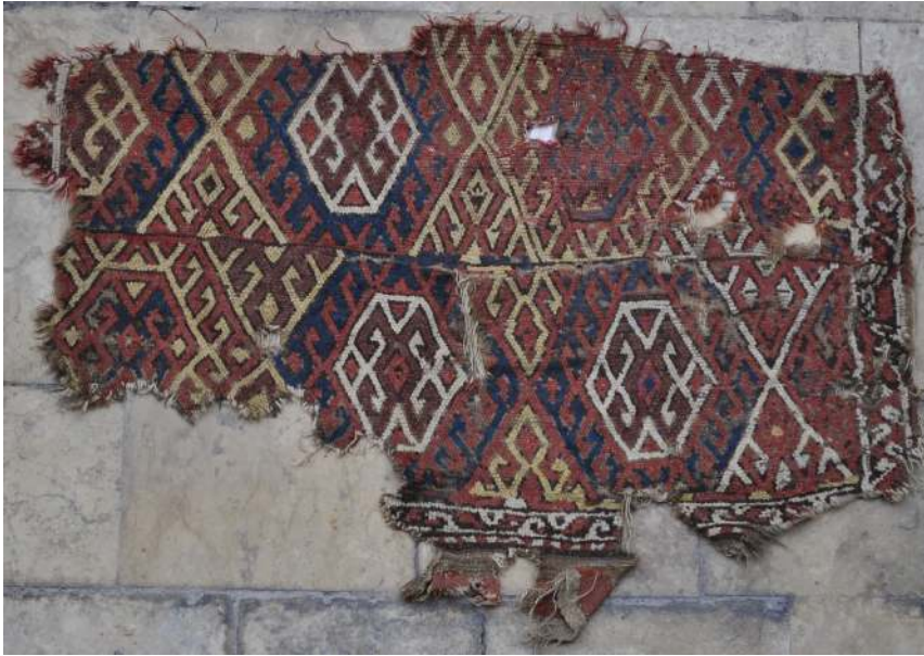
Fotoğraf 7: 17.yy. Malatya civarı halı. Gaziantep Mevlevihanesi Vakıf Müzesi (Müze arşivi)

Fotoğraf 7'de Diyarbakır Çermik Ulu Camii'nden alınan ve Gaziantep Mevlevihane'si Vakıf Müzesinde bulunan 17. yüzyıl ait halı parçasında yanyana ve üst üste altıgenler işlenmiştir. Bunların içerisinde de kenarları kancalı altıgenler ve merkezde karşılıklı koçboynuzları bulunur. Koyu kırmızı, lacivert, sarı ve beyaz renkler kullanılmıştır. Halının tamamında alternatif çözümlerin bağlandığı Türk düğümü bulunur.