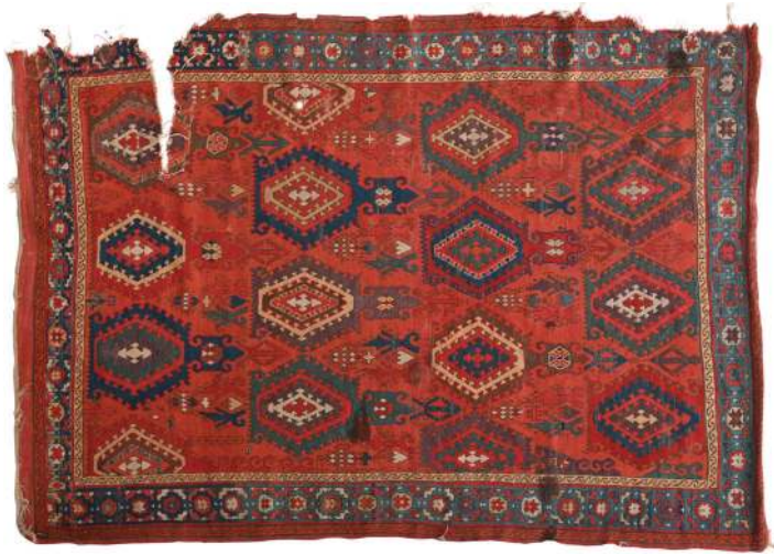
Fotoğraf 9: 17. yy. Şarkışla halısı, Sivas Gök Medrese Vakıf Müzesi (Müze arşivi)

Fotoğraf 9'daki Sivas Şarkışla Büyük Camiinden Sivas Gök Medrese Vakıf Müzesine getirilen 21 numaralı, 213 x 150 cm. ölçülerindeki 17. yüzyıla ait Şarkışla halısında, kaydırılmış eksenlerde yerleştirilmiş altıgenler işlenmiştir. Ancak bu altıgenlerde diğer örneklerdeki altıgenlerden farklı olarak alt ve üst uçlarında farklı uzantılar bulunmaktadır. Genel görünüm olarak diğer halılardan çok farklı olmakla birlikte, altıgenler ortak özellik olarak yer almaktadır. Halının ana bordür deseni ile birbirine bağlı S'lerden oluşan zincir şeklindeki ince bordürü, TIEM'de bulunan Manisa'dan getirilen halının (Fotoğraf 2) bordürleri ile aynıdır. Halının tamamında alternatif çözümlerin bağlandığı Türk düğümü bulunur.