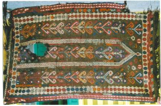
Fotoğraf 9: Çeşmelisebil-Sarayönü, Dal Yanışlı Namazlık, 93X145 cm., 11.10.2002.