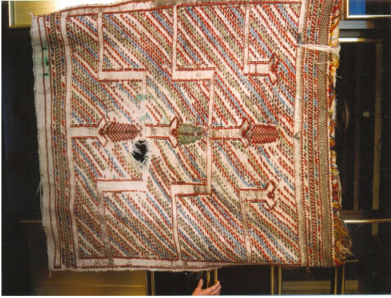
Fotoğraf 6a: Küçükmuhsine Cicim Namazlağı, Küçükmuhsine Köyü Aşağı Cami, 130X150 cm., 11.07.2004.