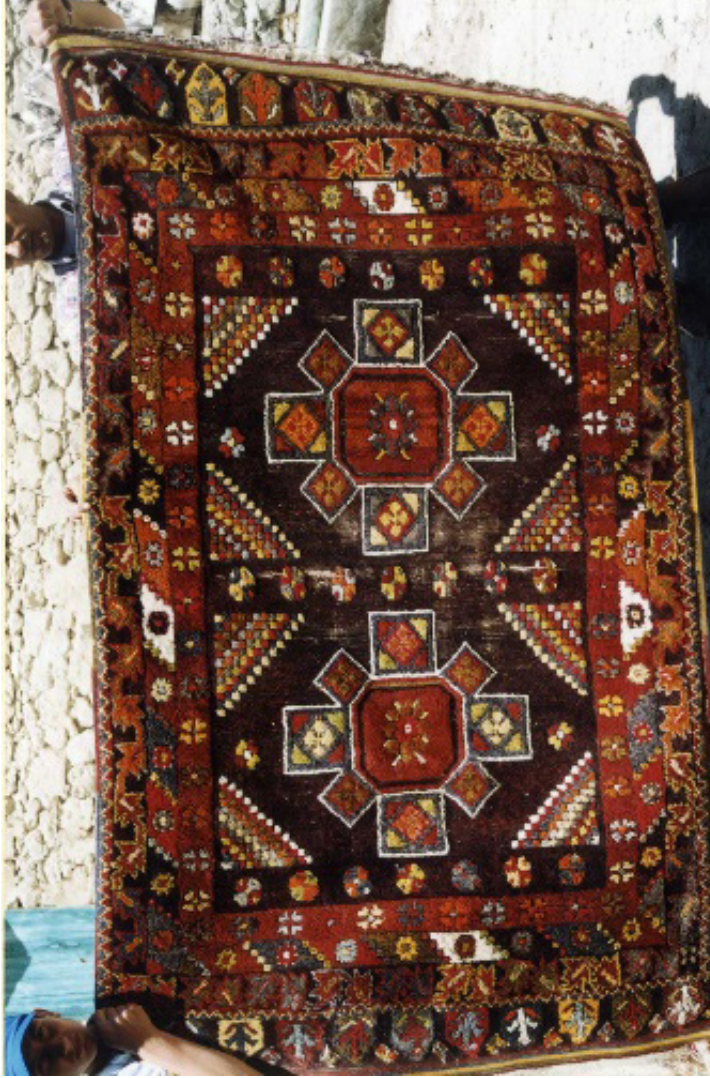
Fotoğraf 4: Yatak Halısı, Küçükmuhsine Aşağı Cami, 11.7.2004.

Bu halıların yanında küçük boyutlu yastık, heybe ve torba çeşitlerinde kendi ihtiyaçları için ürünler dokumuşlardır. Makaleye konu seçilen cicim yaygılar 2004 yılında köye yaptığımız ilk ziyarette dokunmadığı tespit edilmekle birlikte birkaç evde yöre halısının dokunduğu görülmüştür.