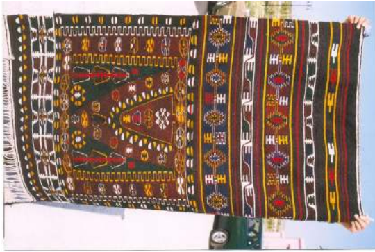
Fotoğraf 8: Yukarıçiğil-İlgın, Mihraplı Namazlağ, 92x150 cm., 23.07.2003.