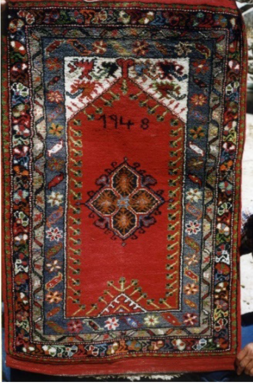
Fotoğraf 1: Seccade, Kitabeli, Küçükmuhsine Aşağı Cami, 78x120cm., 11.7.2004.