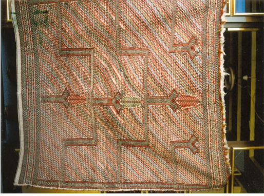
Fotoğraf 5a: Küçükmuhsine Cicim Namazlağı, Küçükmuhsine Köyü Aşağı Cami, 134X155 cm., 11.7.2004.

meydana getirdiği yörede “kozak” denilen motif dokunur. Bu motif çam kozalağına benzetildiği için bu isimle anılır. Bu motif bazı örneklerde mihrap nişlerinin her iki yanına zemin üzerine de dokunduğu olur. (Fotoğraf: 5a-b/6a-b) Zeminde mihraptan kalan boşluklar verev hat üzerine yerleştirilen göz benzeri motiflerle doldurulur. Namazlağı mihrapları da süsleyen geometrik motifli su çerçeveler. Kısa kenar üzerinde yörede “develi ve çakı nakışı” adı verilen üç sıra ilave kenar suyu yer alır. 14 (Çizim 1) Beyaz zemin üzerine kırmızı, kınalı sarı, mavi, yeşil renklerle 134x155 cm. 130x150 cm. ölçülerinde dokunur.