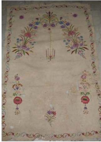
Fotoğraf 17: İstanbul Vakıflar Halı Müzesinde bulunan keçe seccade (Fotoğraf müze arşivi)

Keçe Seccade 16: İstanbul Vakıflar Halı Müzesinde bulunan 19. yüzyıla ait, 308 envanter numaralı, 157x98 cm. ölçülerindeki, İstanbul Fatih Camiinden getirilmiş olan keçe seccadede, üçerden altı adet çiçek demetinin oluşturduğu mihrap kemerinin temsil ettiği mihrap nişi bulunmaktadır. (Fotoğraf 16) Niş tepesinde alem niteliğinde bir çiçek demeti, buradan aşağı sarkan ikili askı, kemerin başlangıç noktalarından sarkan ikişer adet üçlü askı ve ayaklık kısmı ile köşeliklerde birer demet çiçek yer alır. Seccadeyi bir sıra kıvrım dal, yaprak ve çiçeklerden oluşan bitkisel desenli bordür çevirir.