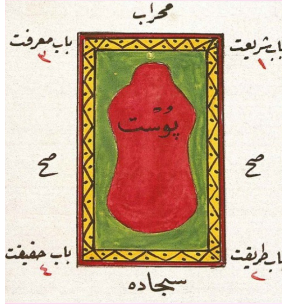
Çizim 1: Seccade Üzerinde Post. (Nurhan Atasoy'dan)

Agâh Efendi, “postun aslı hakkında bazı rivayetler vardır” demektedir. İbrahim’in oğlu İsmail’i kurban ederken “Cebrail tarafından İsmail’in yerine gönderilen koç, Âdem’in oğlu Habil’in tövbesinin karşılığında adadığı ve Allah katında kabul edilip göğe çıkan koçtur” diyerek böylece postun kutsallık kazandığını ve post üzerine oturmanın İbrahim ve İsmail’in sünneti olduğunu açıklamaktadır. 7