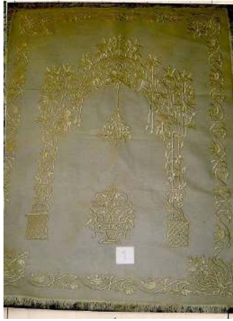
Fotoğraf 12: İstanbul Vakıflar Halı Müzesinde bulunan keçe seccade.

Keçe Seccade 11: Budapeşte'deki Gül Baba Türbesinde bulunan 19. yüzyıla ait keçe seccadede, doğal krem renkli ince keçe üzerine, keçeyle aynı tonda krem renkli iplerle dival tekniğinde desenler işlenmiştir. (Fotoğraf 11) Ortada ince sütunlarla taşınan ve bitkisel motiflerden oluşan çok zarif bir mihrap motifi, kenarlarda bir sıra halinde bitkisel karakterli bordür ve altta büyük bir çiçek demeti yer alır. Bordürün dört köşesinde içe doğru çiçek demetleri uzanır. Mihrap tepesinden aşağı doğru sarkan büyük bir asma kandil ve yanlarda daha küçük ölçülerde askılar yer alır. 21 Bu seccadenin çok benzeri Konya Etnoğrafya Müzesinde bulunan 2609 envanter numaralı keçe seccadedir. Bu seccade de doğal krem renkli olup üzerindeki bitkisel desenlerden oluşan mihrap motifi de, zeminle aynı krem-sarı renkli çamaşır ipeği ipe ve dival tekniğinde yapılmıştır. 22 Etrafı bir sıra saçakla çevrilmiştir.