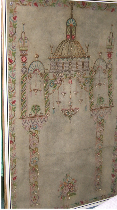
Fotoğraf 1: Bursa Üftade Tekkesinde bulunan keçe seccade.

Keçe Seccade 1: Bursa Üftade Tekkesinde bulunan 19. yüzyıla ait örnekte yünün doğal rengi olan krem renkli ince keçe üzerine çeşitli renklerde ipler ve altın telli iplerle, bitkisel desenler ve cami tasvirinin yer aldığı bir mihrap motifi işlenmiştir. (Fotoğraf 1) İki burmalı sütunla taşınan mihrap kemerinin tepesinden, niş içine doğru ortada bir adet büyük, yanlarda ikişer adet küçük, 5 adet kandil, en kenarda da birer küçük askı sarmaktadır. Ayak kısmında ise lale, şakayık, rozet çiçekleri ve kıvrık yapraklardan oluşan bir demet yer alır. Çiçek ve yapraklar sütunlara sarılarak yükselmiş ve sütunlara burmalı görünümünü vermiştir. Sütun başlıklarının mukarnaslı olduğu farkedilmektedir. Sütunların ve mihrap kemerinin üstünde yer alan cami, üç sahnı bir iç mekâna sahiptir. Sütunların üstüne gelen yan sahnı dar, kubbenin altına gelen orta sahnı geniştir. Orta sahnı üzerini örten kubbe, yüksek kasnaklı ve dilimlidir. Kasnakta pencereler bulunur. Kenarları sütunlarla kaplanmış yan sahnıların tepesinden de birer kandille ikişer askı sarmaktadır. Zemin kısmında palmiyeye benzeyen birer ağaç, üstlerinde kubbe ve alemler bulunur. En dıştaki sütunların üzerinde şerefe ve külahıyla birer minare tasvir edilmiştir. Seccadenin etrafını bir sıra dal, yaprak ve üzüm salkımlarından oluşan bordür çevirir. Gerek cami ve gerekse çiçeklerin üslubundan 19. yüzyıla ait olduğu anlaşılmaktadır. 17