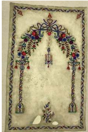
Fotoğraf 8: İstanbul Vakıflar Halı Müzesinde bulunan keçe seccade.

Keçe Seccade 7: Konya Sahip Ata Vakıf Müzesinde bulunan ve Konya Şemsi Tebrizi Camiinden getirilen keçe seccade, 19. yüzyıla ait olup, 90x153 cm. ölçülerindedir. (Fotoğraf 7) Doğal krem renkli ince keçe üzerinde çeşitli renklerde iplerle işleme tekniğinde yapılmış, iki sütunla taşınan yüksek kemerli gösterişli bir mihrap nişi bulunmaktadır. Sütunların kaideleri ve lale şeklindeki başlıkları detaylı bir şekilde belirtilmiştir. Mihrap kemeri kıvrım dallar üzerinde çeşitli şekillerde çiçeklerle süslenmiştir. Tepede alem niyetine büyük bir çiçek demeti bulunmakta, mihrap içine doğru damla şeklinde iri bir stilize kandil sarkmaktadır. Mihrap köşeliklerinde birer dal ucunda çiçek motifleri, ayaklık kısmında vazo içinde iri bir çiçek demeti yer almaktadır. Seccadenin etrafını bir sıra zikzak dal üzerine işlenmiş çiçek, yaprak, meyve motiflerinin yer aldığı bordür çevirmektedir.