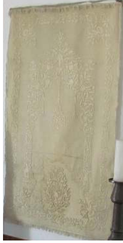
Fotoğraf 11: Budapeşte'deki Gül Baba Türbesinde bulunan keçe seccade. (Fotoğraf Y. Mimar Mehmet Emin Yılmaz)

Keçe Seccade 11: Budapeşte'deki Gül Baba Türbesinde bulunan 19. yüzyıla ait keçe seccadede, doğal krem renkli ince keçe üzerine, keçeyle aynı tonda krem renkli iplerle dival tekniğinde desenler işlenmiştir. (Fotoğraf 11) Ortada ince sütunlarla taşınan ve bitkisel motiflerden oluşan çok zarif bir mihrap motifi, kenarlarda bir sıra halinde bitkisel karakterli bordür ve altta büyük bir çiçek demeti yer alır. Bordürün dört köşesinde içe doğru çiçek demetleri uzanır. Mihrap tepesinden aşağı doğru sarkan büyük bir asma kandil ve yanlarda daha küçük ölçülerde askılar yer alır. 21 Bu seccadenin çok benzeri Konya Etnoğrafya Müzesinde bulunan 2609 envanter numaralı keçe seccadedir. Bu seccade de doğal krem renkli olup üzerindeki bitkisel desenlerden oluşan mihrap motifi de, zeminle aynı krem-sarı renkli çamaşır ipeği ipe ve dival tekniğinde yapılmıştır. 22 Etrafı bir sıra saçakla çevrilmiştir.