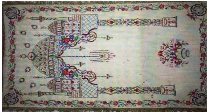
Fotoğraf 5: Konya Etnoğrafya Müzesinde bulunan 6030 envanter numaralı keçe seccade (Emine Nas-Şerife Doğan'dan)

Keçe Seccade 4: Konya Etnoğrafya Müzesinde bulunan 19. yüzyıla ait, 5076 envanter numaralı keçe seccade 95x156 cm. ölçülerindedir. (Fotoğraf 4) Doğal krem renkli tepme keçe üzerine dival işi, Türk işi ve süzeni teknikleri ile desenler işlenmiştir. Sütunlarla taşınan bir mihrap ve mihrap kemeri üzerinde dört minareli bir cami tasviri bulunmaktadır. Mihrap tepesinden aşağıya doğru ikisi küçük, biri büyük 3 adet kandil motifi sarkmakta, ayaklık kısmında vazo içinde bahçe çiçeklerinden oluşan bir buket yer almaktadır. Etrafı sarı renkli ipek saçakla çevrelenmiştir. 19