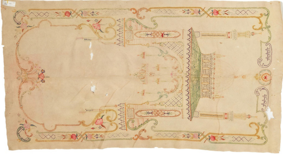
Fotoğraf 2: Ankara Vakıf Eserleri Müzesinde bulunan keçe seccade.

Keçe Seccade 2: Mihrap nişi üzerinde kubbeli bir cami tasvirinin yer aldığı bir örnek de Ankara Vakıf Eserleri Müzesi'nde bulunmaktadır. 1869 envanter numaralı, 105x175 cm. ölçülerindeki 19. yüzyıla ait seccadede desenler, doğal krem renkli ince keçe üzerine kırmızı, pembe, sarı, mor, yeşil, kahverengi renkli iplerle, işleme tekniğiyle yapılmıştır. (Fotoğraf 2) Mihrap nişinin kenarı kıvrımlı hatlarla belirlenmiş ve yanlarda sütun gibi yükselerek başlıkların olduğu yerde genişleyerek üzerine mukarnaslı sütun başlıkları oturtulmuştur. Bunun üzerine kıvrımlı dallarla mihrap kimeri ve üstündeki caminin duvarları yerleştirilmiştir. Mihrap kemerinin üstünde yeşil renkli, kenarları dilimli bir kırma çatı ve üzerinde pencereyi yüksek kasnaklı bir kubbe ve iki yanında zarif minareler bulunur. Mihrap içine doğru ise, bir büyük, dört küçük kandil sarkar. Ayaklık kısmında kıvrımlı kenar çizgisinin ortasında bir çiçek buketi bulunur. Seccadenin kenarını kıvrımlı hatlardan ve çiçeklerden oluşan bir sıra bordür çevirir. Seccadede hem dış hem iç mekan görüntüsü işlenmiştir.