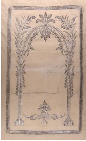
Fotoğraf 13: İstanbul Vakıflar Halı Müzesinde bulunan keçe seccade.

üzerine, sarı renkli sim veya metal iplerle dival tekniğinde desenler işlenmiştir. (Fotoğraf 12) Zeminde ince sütunlarla taşınan süslü bir mihrap motifi, kenarlarda bir sıra halinde zikzak dal üzerinde ince yaprak ve çiçeklerden oluşan bordür ve altta vazo içerisinde büyük bir çiçek demeti yer alır. Bordürün dört köşesinde içe doğru çiçek demetleri uzanır. Sütunların kaideleri kafes şeklinde dekore edilmiştir. Mihrap kemeri ince kıvrım dallar, çiçekler ve yapraklarla süslüdür. Mihrap tepesinden aşağı doğru sarkan büyük bir asma kandil ve yanlarda daha küçük ölçülerde askılar yer alır. Müzede aynı özelliklere sahip 4 adet keçe seccade daha bulunmaktadır.