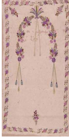
Fotoğraf 16: İstanbul Vakıflar Halı Müzesinde bulunan keçe seccade

Keçe Seccade 16: İstanbul Vakıflar Halı Müzesinde bulunan 19. yüzyıla ait, 308 envanter numaralı, 157x98 cm. ölçülerindeki, İstanbul Fatih Camiinden getirilmiş olan keçe seccadede, üçerden altı adet çiçek demetinin oluşturduğu mihrap kemerinin temsil ettiği mihrap nişi bulunmaktadır. (Fotoğraf 16) Niş tepesinde alem niteliğinde bir çiçek demeti, buradan aşağı sarkan ikili askı, kemerin başlangıç noktalarından sarkan ikişer adet üçlü askı ve ayaklık kısmı ile köşeliklerde birer demet çiçek yer alır. Seccadeyi bir sıra kıvrım dal, yaprak ve çiçeklerden oluşan bitkisel desenli bordür çevirir.