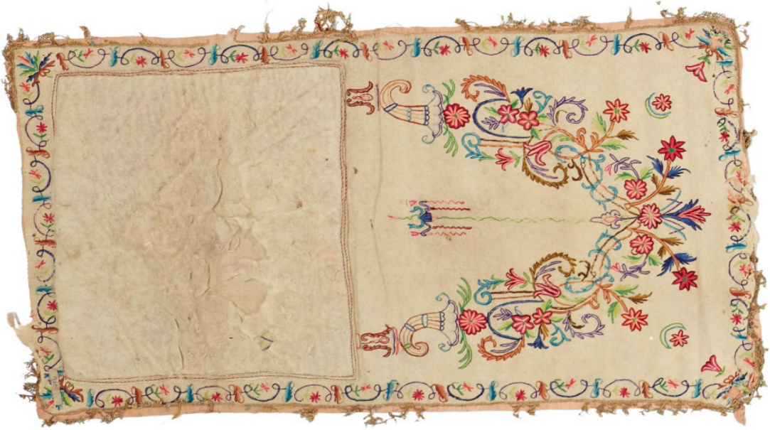
Fotoğraf 6: Ankara Vakıf Eserleri Müzesi'nde bulunan 174 envanter numaralı keçe seccade

İkinci Grupta yer alan süslü sütunlarla taşınan mihrap nişinin olduğu örnekler, sayı olarak diğerlerine göre daha fazladır.