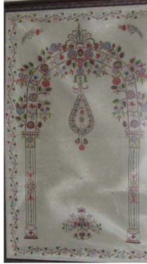
Fotoğraf 7: Konya Sahip Ata Vakıf Müzesinde bulunan keçe seccade.

Keçe Seccade 7: Konya Sahip Ata Vakıf Müzesinde bulunan ve Konya Şemsi Tebrizi Camiinden getirilen keçe seccade, 19. yüzyıla ait olup, 90x153 cm. ölçülerindedir. (Fotoğraf 7) Doğal krem renkli ince keçe üzerinde çeşitli renklerde iplerle işleme tekniğinde yapılmış, iki sütunla taşınan yüksek kemerli gösterişli bir mihrap nişi bulunmaktadır. Sütunların kaideleri ve lale şeklindeki başlıkları detaylı bir şekilde belirtilmiştir. Mihrap kemeri kıvrım dallar üzerinde çeşitli şekillerde çiçeklerle süslenmiştir. Tepede alem niyetine büyük bir çiçek demeti bulunmakta, mihrap içine doğru damla şeklinde iri bir stilize kandil sarkmaktadır. Mihrap köşeliklerinde birer dal ucunda çiçek motifleri, ayaklık kısmında vazo içinde iri bir çiçek demeti yer almaktadır. Seccadenin etrafını bir sıra zikzak dal üzerine işlenmiş çiçek, yaprak, meyve motiflerinin yer aldığı bordür çevirmektedir.