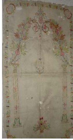
Fotoğraf 9: Bursa Üftade Tekkesinde bulunan keçe seccade.

Keçe Seccade 9: Bursa Üftade Tekkesinde bulunan 19. yüzyıla ait seccadede doğal krem renkli ince keçe üzerine kırmızı, yeşil, mavi, mor, turuncu renkli iplerle mihrap motifi işlenmiştir. (Fotoğraf 9) Mihrap, iki ince sütun üzerine oturan, karşılıklı simetrik, üzerinde çeşitli çiçekler ve yapraklar olan iki kıvrım dalın yer aldığı mihrap kemerinden oluşur. Mihrap kemerinin tepesinde yuvarlak bir çiçekten çıkan kıvrık yaprakların bulunduğu bir demet, bu çiçekten aşağı doğru sarkan üç zincirle bağlı bir asma kandil yer alır. Kandilin üzerinde iki adet zarif mum bulunur. Mihrap nişinin ayaklık kısmında vazo içerisinde simetrik olarak yerleştirilmiş çeşitli çiçekler yer alır. Mihrabı taşıyan sütunların kaide ve başlıkları simetriktir. Seccadeyi bitkisel hatlı bir sıra bordür çevirir.