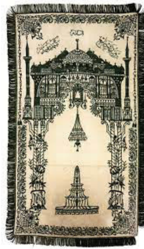
Fotoğraf 3: Konya Mevlana Müzesinde Bulunan 646 numaralı, Bursa Ulu Cami tasvirli keçe seccade

Keçe Seccade 2: Mihrap nişi üzerinde kubbeli bir cami tasvirinin yer aldığı bir örnek de Ankara Vakıf Eserleri Müzesi'nde bulunmaktadır. 1869 envanter numaralı, 105x175 cm. ölçülerindeki 19. yüzyıla ait seccadede desenler, doğal krem renkli ince keçe üzerine kırmızı, pembe, sarı, mor, yeşil, kahverengi renkli iplerle, işleme tekniğiyle yapılmıştır. (Fotoğraf 2) Mihrap nişinin kenarı kıvrımlı hatlarla belirlenmiş ve yanlarda sütun gibi yükselerek başlıkların olduğu yerde genişleyerek üzerine mukarnaslı sütun başlıkları oturtulmuştur. Bunun üzerine kıvrımlı dallarla mihrap kimeri ve üstündeki caminin duvarları yerleştirilmiştir. Mihrap kemerinin üstünde yeşil renkli, kenarları dilimli bir kırma çatı ve üzerinde pencereyi yüksek kasnaklı bir kubbe ve iki yanında zarif minareler bulunur. Mihrap içine doğru ise, bir büyük, dört küçük kandil sarkar. Ayaklık kısmında kıvrımlı kenar çizgisinin ortasında bir çiçek buketi bulunur. Seccadenin kenarını kıvrımlı hatlardan ve çiçeklerden oluşan bir sıra bordür çevirir. Seccadede hem dış hem iç mekan görüntüsü işlenmiştir.