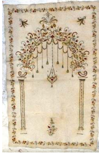
Fotoğraf 10: Özel koleksiyonda bulunan keçe seccade.

Keçe Seccade 9: Bursa Üftade Tekkesinde bulunan 19. yüzyıla ait seccadede doğal krem renkli ince keçe üzerine kırmızı, yeşil, mavi, mor, turuncu renkli iplerle mihrap motifi işlenmiştir. (Fotoğraf 9) Mihrap, iki ince sütun üzerine oturan, karşılıklı simetrik, üzerinde çeşitli çiçekler ve yapraklar olan iki kıvrım dalın yer aldığı mihrap kemerinden oluşur. Mihrap kemerinin tepesinde yuvarlak bir çiçekten çıkan kıvrık yaprakların bulunduğu bir demet, bu çiçekten aşağı doğru sarkan üç zincirle bağlı bir asma kandil yer alır. Kandilin üzerinde iki adet zarif mum bulunur. Mihrap nişinin ayaklık kısmında vazo içerisinde simetrik olarak yerleştirilmiş çeşitli çiçekler yer alır. Mihrabı taşıyan sütunların kaide ve başlıkları simetriktir. Seccadeyi bitkisel hatlı bir sıra bordür çevirir.