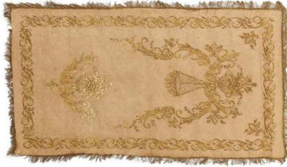
Fotoğraf 14: Ankara Vakıf Eserleri Müzesinde bulunan keçe seccade.

Keçe Seccade 14: Ankara Vakıf Eserleri Müzesinde bulunan 1252 envanter numaralı İnebolu Tevfikiye Camiinden getirilen, 19. yüzyıla ait keçe seccadede, sarı sim ve altın tellerle dival tekniğinde yapılmış bitkisel desenlerden oluşan bir mihrap kemeri ile ayaklık kısmında iri dallar arasında bir vazo içerisinde çiçek demeti ve bir sıra kenar bordürü bulunmaktadır. (Fotoğraf 14) Mihrap kemeri, kıvrım dal ve üzerinde çeşitli çiçeklerden oluşmaktadır. Tepe kısmında, ayaklık kısmındaki çiçek buketinin aynısı bulunmaktadır. Tepeden mihrap içine doğru süslü bir kandil sarmaktadır. Köşeliklerde birer adet küçük çiçek buketleri yer almaktadır. Sarı simden bir sıra saçakla çevrilidir.