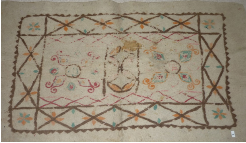
Fotoğraf 18: Bursa Üftade Tekkesinde bulunan keçe seccadede.

bir mihrap kemeri yer almaktadır. 24 Yine aynı müzede bulunan 4063 envanter numaralı keçe seccadede sütunların olduğu yerde birer şamdana benzer motif yapılmışsa da, bunlar taşıyıcı değildir. Sadece mihrabı temsilen bitkisel motiflerden oluşan bir mihrap kemeri bulunmaktadır. Bu örnekte sarı kılıptan kullanılan yerler dival tekniğiyle yapılmıştır. 25 İstanbul Çamlıca'da bulunan İslam Medeniyetleri Müzesindeki Milli Saraylar Koleksiyonuna ait 157/633, 157/634 ve 157/629 numaralı keçe seccadelerde de, sütunsuz bir mihrap kemeri bulunmaktadır. 157/629 numaralı seccade renkli iplerle işleme tekniğinde, 157/633 numaralı seccade sarı sim veya metal iplerle dival tekniğinde, 157/634 numaralı seccade pembe renkli ipele dival tekniğinde yapılmışlardır. 157/633 ve 157/634 numaralı seccadelerin desenleri aynıdır.