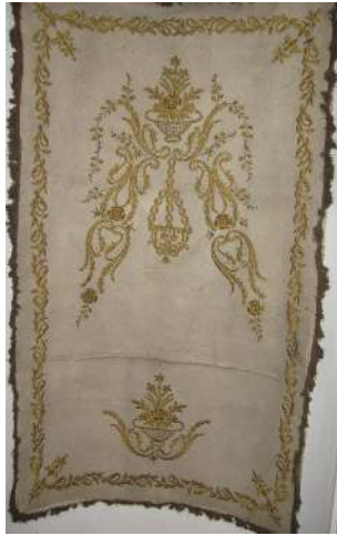
Fotoğraf 15: İstanbul Üsküdar Özbekler Tekkesinde bulunan keçe seccade. (Fotoğraf V.G.M. arşivi)

Keçe Seccade 14: Ankara Vakıf Eserleri Müzesinde bulunan 1252 envanter numaralı İnebolu Tevfikiye Camiinden getirilen, 19. yüzyıla ait keçe seccadede, sarı sim ve altın tellerle dival tekniğinde yapılmış bitkisel desenlerden oluşan bir mihrap kemeri ile ayaklık kısmında iri dallar arasında bir vazo içerisinde çiçek demeti ve bir sıra kenar bordürü bulunmaktadır. (Fotoğraf 14) Mihrap kemeri, kıvrım dal ve üzerinde çeşitli çiçeklerden oluşmaktadır. Tepe kısmında, ayaklık kısmındaki çiçek buketinin aynısı bulunmaktadır. Tepeden mihrap içine doğru süslü bir kandil sarmaktadır. Köşeliklerde birer adet küçük çiçek buketleri yer almaktadır. Sarı simden bir sıra saçakla çevrilidir.