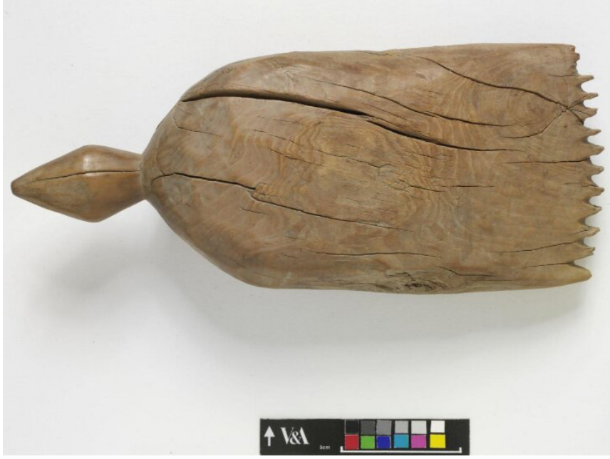
Fotoğraf 7: Kirkit (tarak), weft beater,© Victoria and Albert Museum, Londra 23