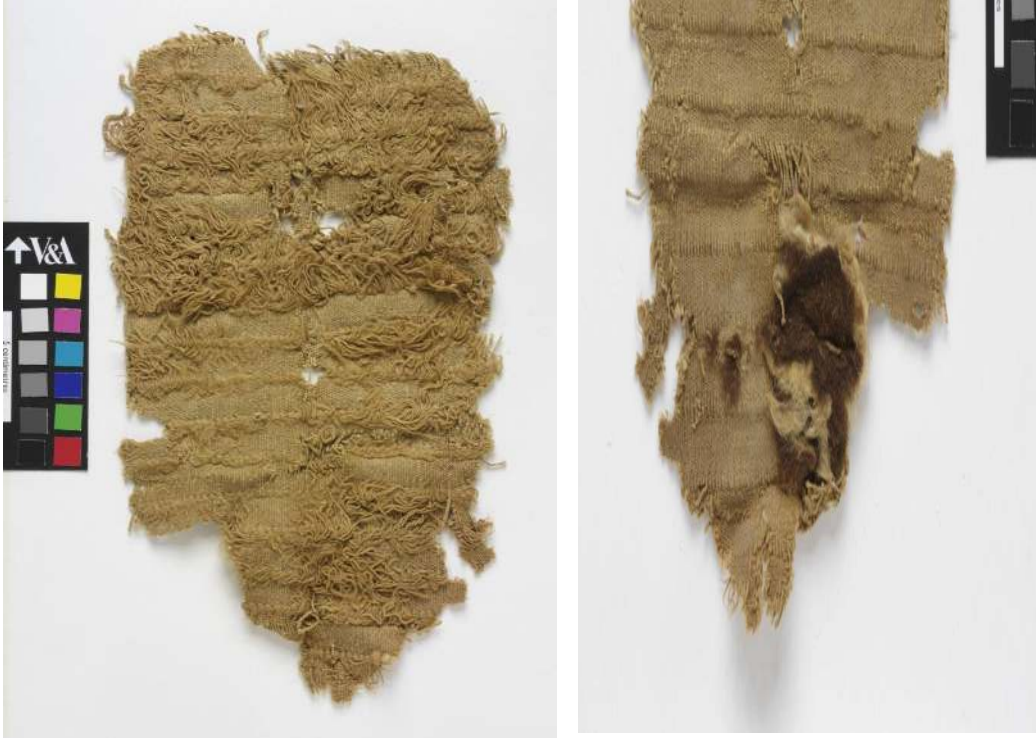
Fotoğraf 4: Çekmeli halı parçası 16