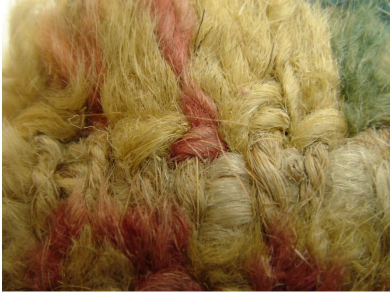
Fotoğraf 2: çekmeli halı ,yakından götüntüsü