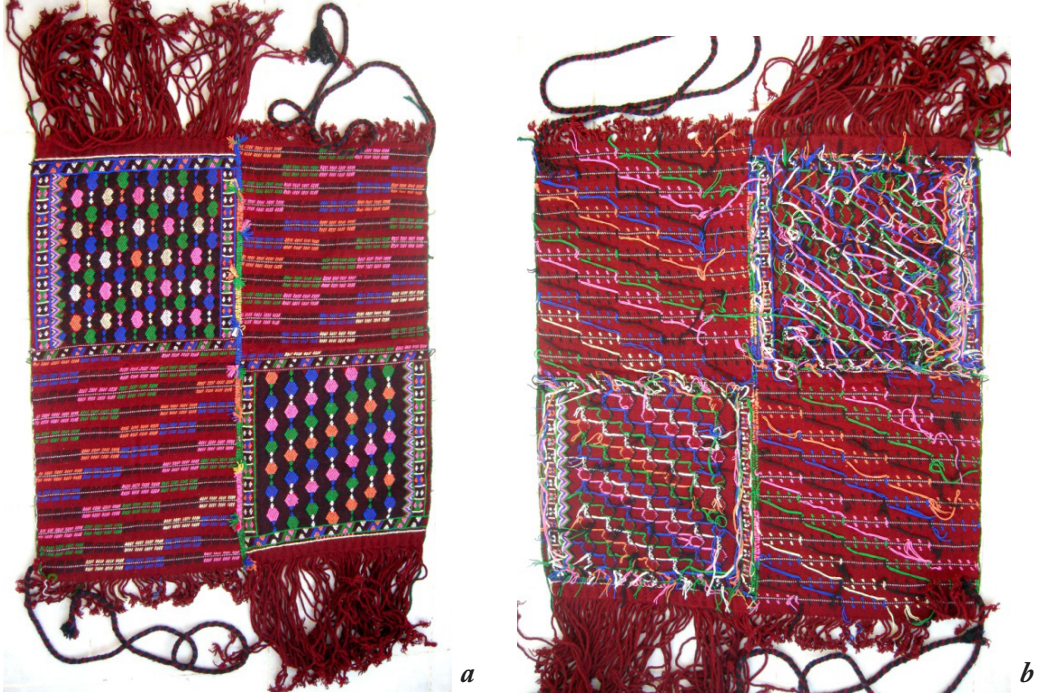
Fotoğraf 10a, b: Balya Şalınmın ön ve arka yüzü