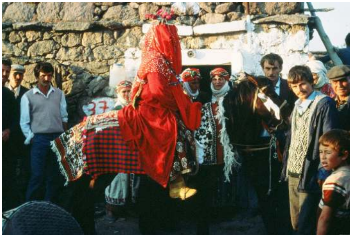
Fotoğraf 15: Çamkalabak'ta gelin atının üzerinde ekoseli (tokatlı) ihram (Atlıhan arşivi, foto: 1990).

İhramlar çok önceden yerleşik yaşama geçmiş köylerde dokunur. Ayvacık bölgesinde Yörükler halı kilim ve benzeri dokumaları, eski yerleşikler de iç ve dış giyim için gerekli dokumaları ve battaniye gibi örtüleri dokurlardı. İhtiyaçlarını kendi aralarında takas ederek karşılardı. İhramlar da arkalıklar gibi evli kadının giyiminde önemli bir yere sahiptir. Fotoğraf 16'da gelinin atının üzerinde, gelin atı halısının üzerine ekoseli (tokatlı) ihram örtülmüştür. İhramlar Ayvacık geleneksel gelin giyiminde bele bağlanmaz. Gelin giyiminde arkalık olarak, uçları nakışlı kenarı oyalı beyaz büyükçe bir yağlık üçgen katlanarak bağlanır. Son yıllarda ihram dokuyanların sayısı çok azalmıştır. Genç kadınlar hiçbir şekilde ihram kullanmıyorlar. Halen bazı Yörük köylerinde kullanılsa da yerleşik köylerin birçoğunda kullanılmıyor. Sadece ihramları değil, dışarıya çıkarken giydikleri feraceler de giyilmiyor.