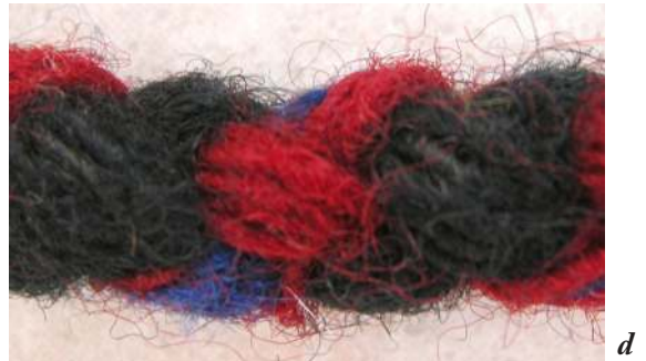
Fotoğraf 11a, b, c, d: Balıkesir- Balya Şalından ayrıntılar (Atlıhan arşivi, foto: 2013).