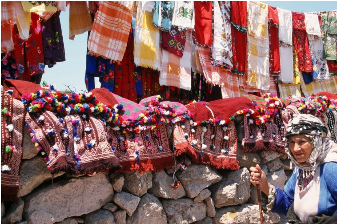
Fotoğraf 14: Çeyiz sergisinde duvarın üzerinde kenarları kozalı ihramlar (Atlıhan arşivi, foto: 1999).