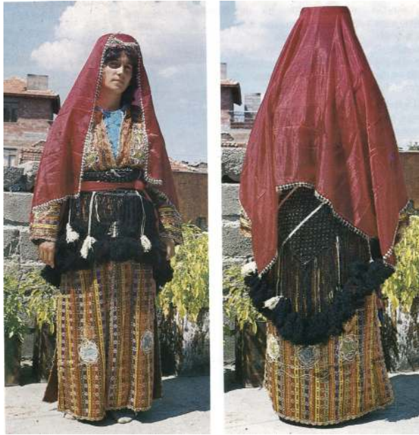
Fotoğraf 1: Gelin giyiminde arkalık [Res:5-6 Bursa Orhanlı İlçesi Harmancı Köyünde "Üçetek"li gelin kıyafetinin ön ve arkadan görünüşleri (Altuntaş ve diğerleri 1993: 4).

Koçu bu konuda; [Memleketimizde İstanbul da dâhil, çok yaygın bir gelenek olarak gelin kızların beline babaları, eğer yoksa erkek kardeşi veya en yakın erkek akrabası bir şal bağlardı. Şalın tabut örtüsü olarak kullanıldığını da hatırlatan aşağıdaki beyit gelinlik çağında ölen kız kardeşi için çağdaş şairlerimizden Tahir Olgun (Tahirülmevlevi) Beyindir. "Bekliyorken ben sana şal bağlama hengamını, Bağladım amma, zavallı kardeşim, tabutuna!."] der. 34