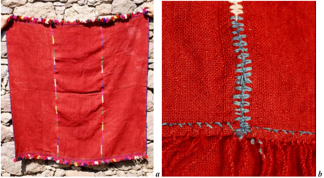
Fotoğraf 13 a, b: Çamkalabak'ta çocuk ihramı ve bir ihram dikişinden ayrıntı (Atlıhan arşivi, foto: 1999).