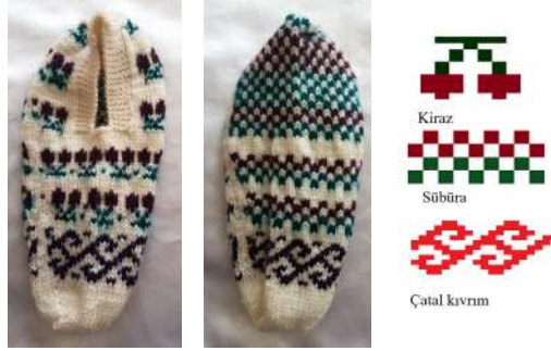
Fotograf 8: Patik Örneği ve Motif Detayı (Tonus ve Duman, 2021)

Kompozisyon: Burun ve topuk bölümleri tek renkli-desensiz bırakılan patik, ağız kısma uygulanan tığ işi ile tamamlanmıştır. Ayak ön üst bölümü dikey eksende ötelemeli olarak yerleştirilen “böğreklî kıvrık” modeli ile süslenirken, tabanda almaşık düzendeki “göççeli yürütme” görülmektedir.