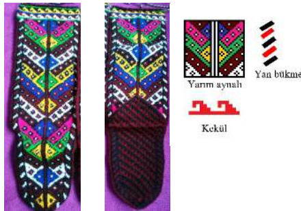
Fotograf 24: Çorap Örneği ve Motif Detayı (Tonus ve Çağlar, 2021)

Topukta “yürütme”, burunda “kör göççe ve kekül”, taban kısmında ise geometrik formlu üçgenler almaşık olarak tasarlanmıştır.