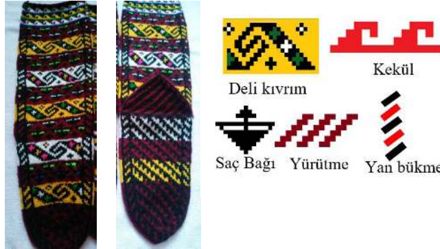
Fotoğraf 22: Çorap Örneği ve Motif Detayı (Tonus ve Çağlar, 2021)

Muskalı, Zara’da “genç delikanlıların giydiği çoraplardandır ve anneler, nazar değmesini önlemek amacıyla kendi oğullarına örerler. Muska şeklindeki üçgenlerin içinde şayet noktalar varsa bu delikanlı nişanlıdır. Üçgenlerin bazılarında yoksa sözlüdür ya da söz kesilmek üzeredir. Şayet nokta hiç konulmamışsa başı bağlı demektir”. 11