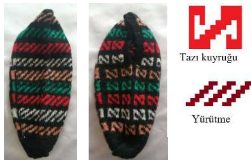
Fotograf 9: Patik Örneği ve Motif Detayı (Tonus ve Duman, 2021)

Kompozisyon: Çatal kıvrım yatay eksende ötelemeli olarak tam tur atarken, kiraz motifi sadece ayak üst ve ağız çevresinde kullanılmıştır. Ayak alt bölümünde ise iki sıra yatay şeritler şeklindeki “sübura” motifi, topuk bölümünün tamamını kaplamış durumdadır.