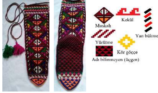
Fotograf 23: Çorap Örneği ve Motif Detayı (Tonus ve Çağlar, 2021)

Kompozisyon: Çorap, başlığa üç sıra halinde yatay olarak uygulanan “kekül” motifi ile tamamlanmıştır. Ayak üst bölümü ile koncun tamamında, düşey yönde sınırları “yan bükme” ile belirlenmiş bir sırada “deli kıvrım”, diğer sırada “saçbağı” modelinin ötelemeli yerleşimi görülmüştür. Çorap tabanı üçgen motifinin diyagonal yerleşiminden oluşurken, topukları ise “yürütme” motifi ile bezenmiştir. Deli kıvrım motifli çoraplar ile ilgili İsmail Acar, Zara’da hem erkek hem de genç kızlar tarafından giyildiğini yazmıştır. 12