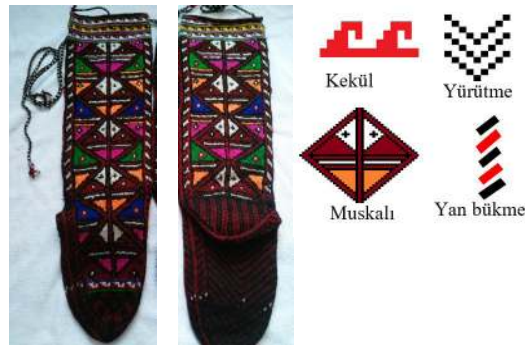
Fotoğraf 21: Çorap Örneği ve Motif Detayı (Tonus ve Çağlar, 2021)

Kompozisyon: Ayak üst bölümünde düşey eksene göre geometrik merkezli “yürütme” motifleri tasarlanmış, onun içi ve kalan diğer boşluklar ise “kelebek ve göççeli yürütme” ile doldurulmuştur. Taban “yürütme” motifinin dikey yönlü simetrik yerleşiminden oluşmuştur.