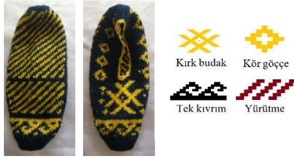
Fotograf 4: Patik Örneği ve Motif Detayı (Tonus ve Duman, 2021)

Ceviz cıynağı (beksimet), Zara’da ceviz kıynağı olarak bilinir ve bu nakışı giyen kadın mutlaka kaynanadır. 9