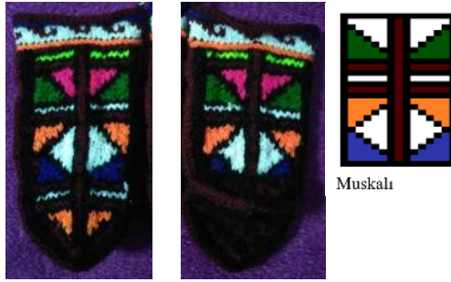
Fotoğraf 25: Çorap Örneği ve Motif Detayı (Tonus ve Çağlar, 2021)

Kompozisyon: Çorap, başlığa iki sıra halinde yatay olarak uygulanan “kekül” motifi ile tamamlanmıştır. Ayak üst bölümü ile koncun tamamında, düşey yönde sınırları “yan bükme” ile belirlenmiş “yarım aynalı” uygulanmıştır. Topuk ve taban kısmında ise geometrik formlu üçgenler diyagonal olarak tasarlanmıştır.