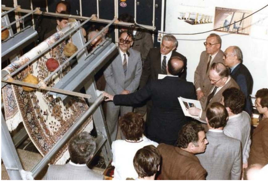
Fotoğraf 6: Mimar Sinan Güzel Sanatlar Üniversitesi Endüstri Tasarımı Bölümü ile Sümerbank için halı tezgâhlarını geliştirme iş birliği projesi (Ö. Küçükerman Arşivi, 1990)