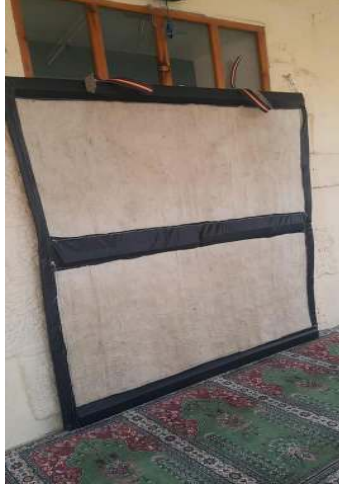
Fotoğraf 28: Afyonkarahisar Erkuş Keçe Atölyesi'nde Eskişehir Çifteler Camisi için üretilen kapı perdesi.