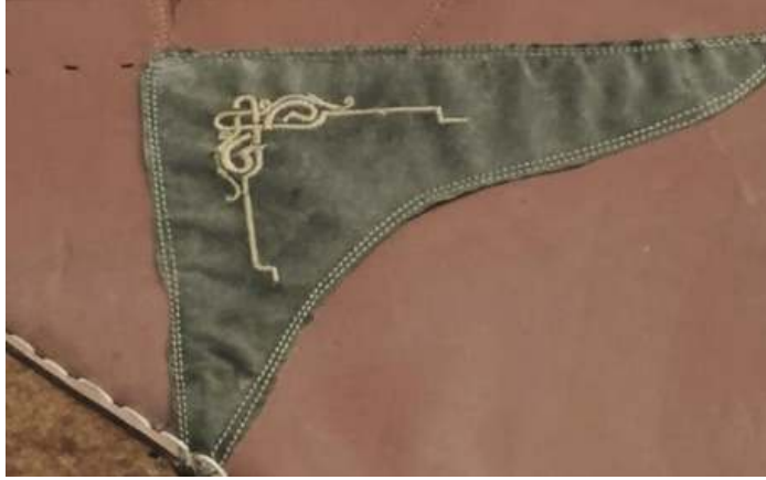
Fotoğraf 7: Mevlevi Türbe Camisi kapı perde işlemleri (Küçükkurt Arşivi, Afyonkarahisar, 2022).