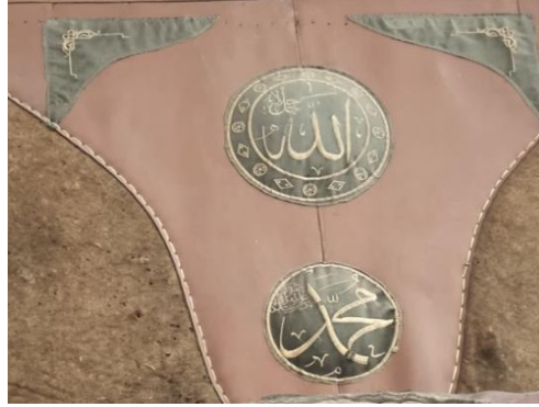
Fotoğraf 17: Mevlevi Türbe Camisi kapı perde ayrıntısı.