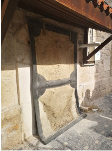
Fotoğraf 25: Emirdağ Çarşı Camisi güney kapısında bulunan kapı perdesi.