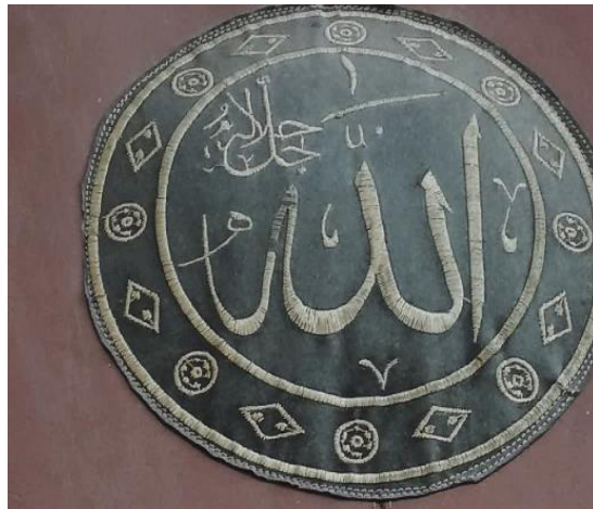
Fotoğraf 9: Mevlevi Türbe Camisi kapı perde işlemleri (Küçükkurt Arşivi, Afyonkarahisar, 2022).