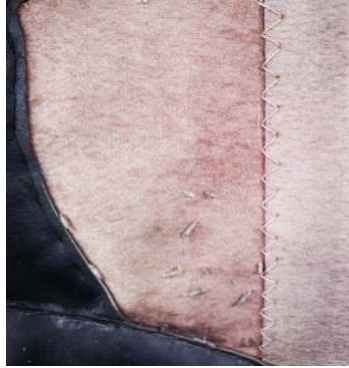
Fotoğraf 31: Ulu Cami kapı perdesinde bulunan güveler (Küçükkurt Arşivi, Afyonkarahisar, 2022).