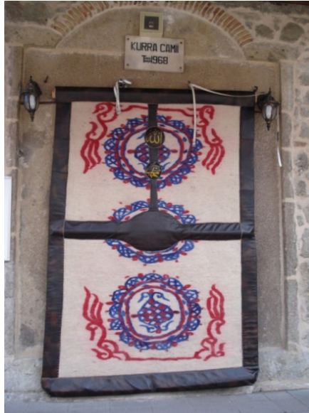
Fotoğraf 18: Kurra Camisi Keçe kapı perdesi. 24