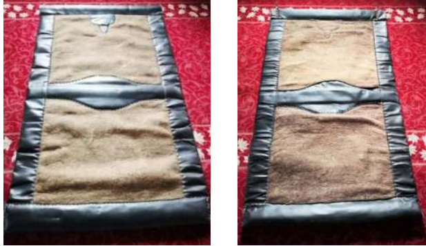
Fotoğraf 20: Kurra Camisi kadınlar girişi kapı perdesinin önü ve arkası (Küçükkurt, Afyonkarahisar, 2022).

4. örnek; Kurra Cami'si kadınlar girişinde bulunmaktadır. Kapı perdesini keçe ustası İsmail Erkuş yapmıştır (Fotoğraf 20). Perde Karaman kuzu yününden, 120 cm x 220 cm ebadında ve 2 cm kalınlığında tek parça üretilmiştir. Perdenin çevresinde ve ortasında dana derisi kullanılmıştır. Perdenin altı, üstü ve ortasına çam ağacından yapılmış çubuklar geçirilmiştir. Derinin dikim işini usta İsmail Erkuş yapmıştır. Perdede herhangi bir süsleme unsuru kullanılmamıştır. Perde iyi durumdadır.