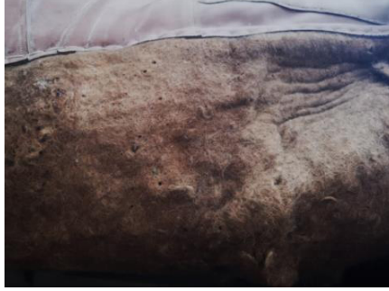
Fotoğraf 30: Mevlevi Türbe Cami'si perde keçesinin güve delikleri (Küçükkurt Arşivi, Afyonkarahisar, 2022).

Perdelerin keçeden üretilmiş olması nedeniyle bakımlarının yapılması gerekmektedir. Güve, toz, güneş ışığı, nem perdeler zarar vermektedir. Bu nedenlerle perdeler kısa zamanda deforme olmaktadır. Perdelerin bahar mevsimi ile kapıdan alınarak dürülüp saklanması esnasında ortam şartlarının uygun olması gerekmektedir. Sürekli nemli ve karanlık ortamlar güvelenme ve küflenmeye zemin hazırlamaktadır (Fotoğraf 30-31). Uzun süre kapıda asılı olan perdeler direk güneş ışığına ve toza maruz kalmaktadır (Fotoğraf 32). Perdelerin kontrollerinin yapılması, yıkanması, zararlılara karşı ilaçlanması, camilerde görevli bulunan yetkililerin perdeleri saklama şartları konusunda bilgilendirilmesi gerekmektedir.