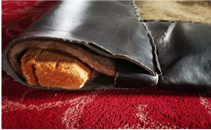
Fotoğraf 6: Perdenin çam kütüğünden ağırlığı.

Deri kısmına uygulanan yazılarla süslenen kapı perdelerinde baskı, boyama ve dival işi işleme tekniği kullanılmaktadır. Genellikle ceylan derisi, oğlak derisi üzerine baskı tekniği kullanılarak yazılar uygulanmaktadır. Deriye uygulanan dival işinde daha çok ince deriler tercih edilmektedir. Deri üzerine desen ve yazılar sim, sırma, ipek iplik kullanılarak oluşturulmaktadır. 19 Daire ve oval kesilmiş deri üzerine çerçeve olarak kare, üçgen, baklava şeklinde küçük motifler yerleştirildiği gibi köşe süslemelerinde rumi ve çiçek dalları kullanılmaktadır (Fotoğraf 7). Genellikle deri üzerine “Allah” ve “Muhammed”, “Allah Celle Celâluh”, “Muhammed Aleyhisselam” yazılmaktadır (Fotoğraf 8-9-10).