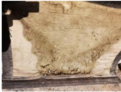
Fotoğraf 32: Emirdağ Çarşısı Camisi güney kapı perdesinde toz, sökülme ve güve zararlısı (Küçükkurt Arşivi, Afyonkarahisar-Emirdağ, 2022).

Son zamanlarda perdelerin üretiminde keçe ve deri yerine ucuz ve üretim kolaylığı nedeniyle sentetik malzemelerin kullanıldığı görülmektedir. Yün ve deri ücretlerinde ki artış keçe perdelerin üretim maliyetlerinin artmasına neden olmaktadır. Keçe ve deri ustalarının malzeme temini konusunda desteklenmesi gerekmektedir.