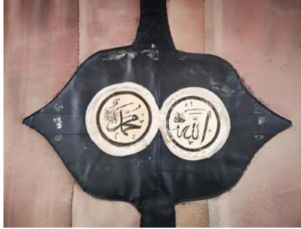
Fotoğraf 22: Ulu Cami kapı perdesinin oğlak derisine basılmış “Allah Celle Celâluh” ve “Muhammed Aleyhisselam” yazısı (Küçükkurt Arşivi, Afyonkarahisar, 2022).