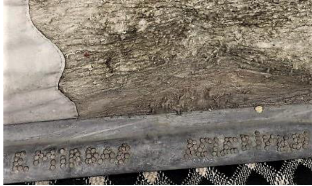
Fotoğraf 14: Perdenin ucuna “Emirdağ Belediyesi” yazılmıştır (Küçükkurt Arşivi, Afyonkarahisar-Emirdağ, 2022).