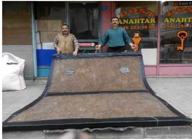
Fotoğraf 27: Şuhut Ulu Cami kapı perdesi (Erkuş Arşivi, Afyonkarahisar, 2015).

8. örnek; Afyonkarahisar-Şuhut ilçe merkezinde bulunan Ulu Cami'nin giriş kapı perdesidir ve Erkuş Kardeşler Keçe Kepenek Atölyesi'nde üretilmiştir (Fotoğraf 27). Perde Karaman kuzu yününden, 250cmx310cm ebadında ve 2cm kalınlığında, iki parça üretilmiştir. Perdenin çevresinde ve ortasında Konya'dan getirtilen dana derisi kullanılmıştır. Derinin dikim işlerini İsmail Erkuş usta yapmıştır. 30 Daire şeklinde kesilmiş dana derisi üzerine baskı tekniği ile "Allah" ve "Muhammed" yazılmış hazırlanan bu parça keçenin üzerine daha sonra dikilmiştir.