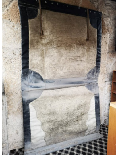
Fotoğraf 26: Emirdağ Çarşısı Camisi kadınlar bölümü girişinde bulunan kapı perdesi (, Afyonkarahisar-Emirdağ, 2022).