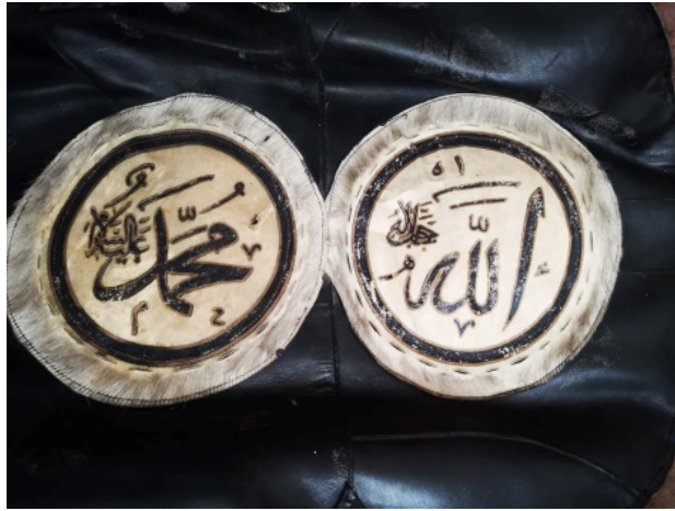
Fotoğraf 8: Ulu Cami kapı perdesinde oğlak derisine basılmış “Allah Celle Celâluh” ve “Muhammed Aleyhisselam” yazısı.