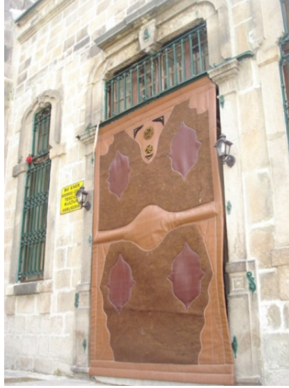
Fotoğraf 15: Mevlevi Türbe Camisi kapı perdesi.