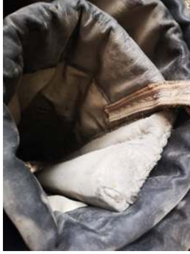
Fotoğraf 12: Rulo yapılmış perde (Küçükkurt Arşivi, Afyonkarahisar-Emirdağ, 2022).