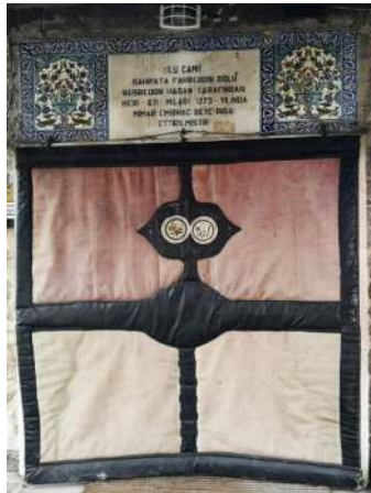
Fotoğraf 23: Ulu Cami keçe kapı perdesinin branda kaplanmış hali