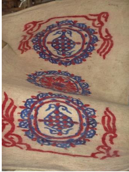
Fotoğraf 4: Yaşar Kocataş'ın yapmış olduğu saraçlanmak üzere deri ustasına gidecek Kurra Camisi kapı perdesi (Yalçınkaya Arşivi, Afyonkarahisar, 2009).

Perdelerin dayanıklılığını artırmak için çevresi deriyle çevrelenmektedir. Bazı keçe ürünlerinin dayanıklılığını artırmak ve süslemek için deri ile çevreleme işlemi Pazırık Kurganı buluntularında tespit edilmiştir. Pazırık 1. Kurgan'dan çıkan eşyalar arasında, MÖ. 5. yüzyıla tarihlendirilen 120cm uzunluğunda ve 60 cm genişliğinde olan ince kırmızı keçeden yapılmış eğer örtüsünün kenarları, deri şeritlerle süslenmiştir. 16