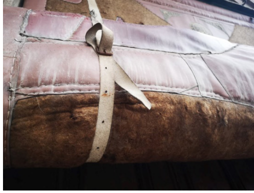
Fotoğraf 13: Deri kuşak.