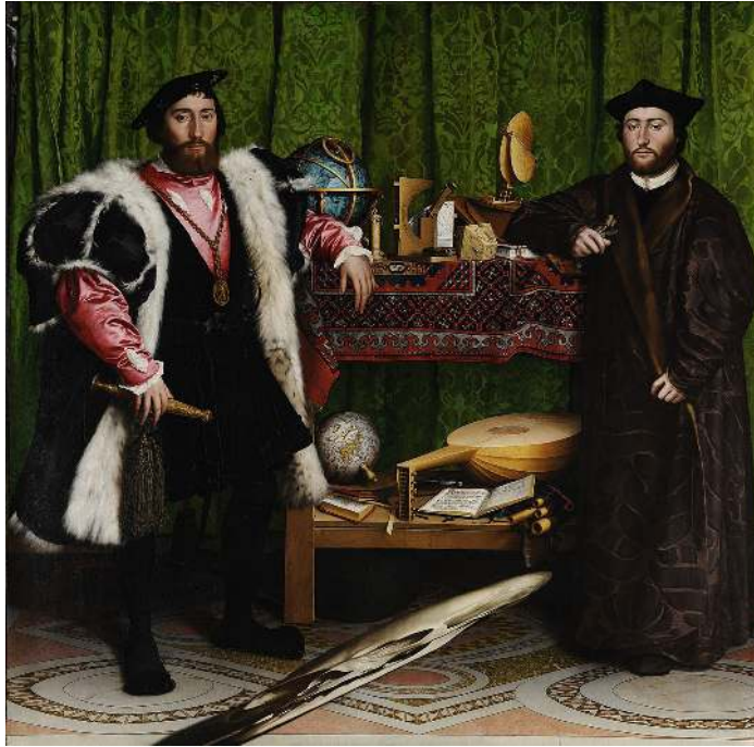
Fotoğraf 6: Bergama Halısı (III. Tip Holbein halısı), Hans Holbein'in "The Ambassadors" isimli tablosu, The National Gallery

Avrupalı ressamardan Hans Holbein tablolarında resmedilen ve III. ve IV. grup Holbein halılarının Bergama olarak gösterilen örnekleri acaba bu erken Menemen halıları olabilir mi? Çünkü 15.- 16. yüzyıllarda Uşak kadar önemli bir halı merkezi olarak görünen Bergama'nın Hazine kayıtlarında adı hiç geçmemektedir (Fotoğraf 6-7).