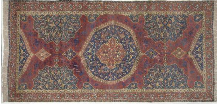
Fotoğraf 3: Uşak Halısı, Madalyonlu, Victoria & Albert Museum, Env. No. T.71-1914

Türk halı merkezleri ve desenleri hakkında 1640 tarihli Narh defteri de önemli bilgiler içermektedir. 16 Örneğin; “Germiyan Kulasının Mısır nakışlı seccadesi” ve “Menteşe’nin manendi Acem seccadesi” kayıtlarından Mısır ve İran seccade desenlerinin taklit edildiği anlaşılıyor. Ayrıca Kula’nın “direkli”, Selendi’nin “peleng nakışlı” (üç benek ve bulut motifi), seccadeleri ile Uşak’ın “kırmızı üzerine ortası sofralu kaliçesi” (madalyonlu veya yıldızlı Uşak), Selendi’nin “beyaz üzerine karga nakışlı hamam kaliçesi” gibi açıklamalar, bizi Batı Anadolu halıcılığı ve desenleri konusunda aydınlatıyor (Fotoğraf 3-4). Bu kaynakta adı geçmeyen ancak bugün dünya müzelerinde örnekleri bulunan “akrep” motifli Selendi halıları da mevcuttur. 17