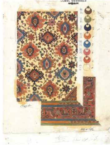
Fotoğraf 8: “Isparta Fabrikasının Tarihi Koleksiyonundan, 19. yüzyıl yapımı bir Uşak halısı modeli”, alt yazısıyla verilmiştir, Ö. Küçükerman, 1990, s.44.