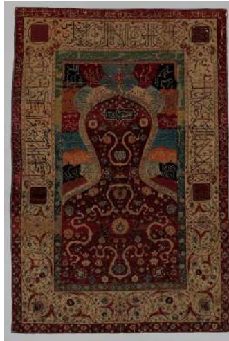
Fotoğraf 10: Topkapı Sarayı Halı Seccadesi, TSM, Env. No. 13/2042

Bugün Milli Saraylara bağlanmış olan Topkapı Sarayı koleksiyonunda bulunan 37 adet seccade, Osmanlı saray seccadeleri grubunda olup; Anadolu halı seccadelerinden farklıdır (Fotoğraf 10). Bunların yanı sıra ortası madalyonlu köşelerde çeyrek madalyonun yer aldığı taban halıları da desenleri itibarıyla saray halıları grubuna dâhil edilirler. Bu halılarda ortadaki madalyonun dışında kalan zemin kıvrık hançeri yapraklar, aralarında natüralist çiçeklerle doldurulmuştur. Bu desen İran kökenli, Yavuz Sultan Selim'in Tebriz'i fethinden (1514) sonra beraberinde getirdiği nakkaş Şah Kulu'nun geliştirdiği "saz" üslubudur ki; çini, taş, maden, dokuma gibi sanat kollarında uygulanmıştır. Saray seccadeleri grubuna döndüğümüzde bu seccadeler, İran, Memluk, Uşak seccadelerinin desen özelliklerini gösterir. Menşeleri ve tarihlenmesi hakkında halâ kesin bir karara varılamayan ve son olarak 19. yüzyıl Hereke mamulâtı olarak kabul edilen bu halılar 39 , daha sonra yapılan boya analizleri 40 , bazılarının mihrap konturlarında kullanılan metal tel analizleri 41 ile bazıları 16. yüzyıl İran, bazıları Osmanlılar tarafından 19. yüzyılda kopya olduğu ortaya çıkmıştır.