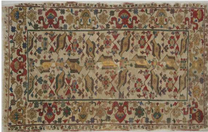
Fotoğraf 2: Uşak Halısı, Karga Nakışlı, 16. yüzyıl, Victoria and Albert Museum, Env. No. 457-1884, https://collections.vam.ac.uk/item/O100815/carpet/?carousel-image=2011FB0968

Masa halıları grubunda görülen desenlerden biri de beyaz zemin üzerine kuş desenli veya “karga nakışlı” olmaktadır. Macar kaynakları 1621 yılında Macar elçisi için İstanbul’dan bazı halıların satın alındığını bildirmektedir. Halıların kaydından beyaz zemin üzerine üç benek desenli bir halıyla, kuş desenli üç masa halısı alındığı anlaşılmaktadır 15 (Fotoğraf 2).