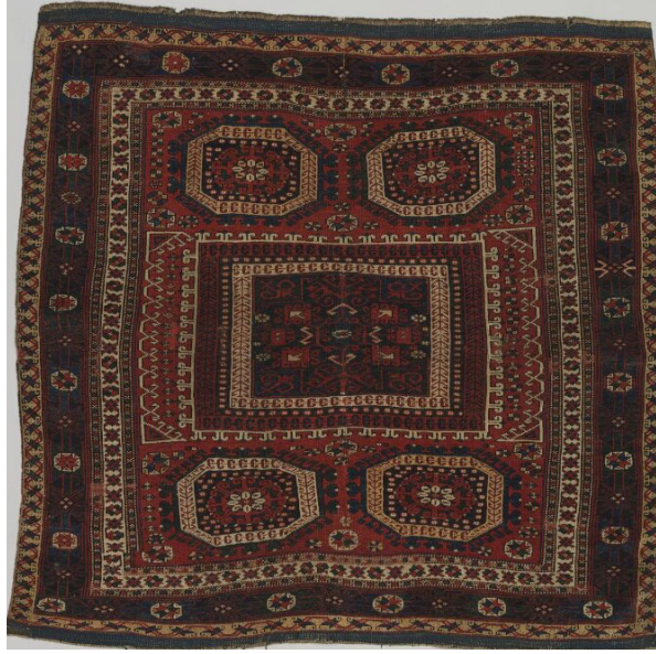
Fotoğraf 7: Bergama Halısı, Holbein'in resmettiği halıların benzeri, V&A Museum, Env. No. T.31-1956

Belgeler, saraydan Uşak'a siparişlerin devam ettiğini göstermektedir. Sultan III. Ahmed'in (1703 – 1730), H.1139/ M.1726 tarihinde Uşak kadısına yazdığı hükümde; Topkapı Sarayındaki Hırka-i Şerife Odası ve etrafında kullanılmak üzere dokunması ferman olan kaliçelerin bir gün evvel tamamlanıp, gönderilmesi istenmektedir. Bunlar bitmeden Mısır ve tüccar için halı dokunmaması, sanatında usta olanların özenle işlemesi tembih olunmaktadır. 27