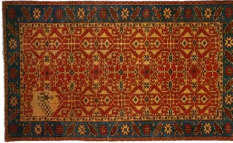
Fotoğraf 5: Avrupa Armalı Halı örneği, NY Metropolitan Museum of Art, Env. No.62.231 https://www.metmuseum.org/art/collection/search/451698

Uşak halılarının şöhreti 16. yüzyılın sonlarında bütün Avrupa'ya yayılmıştı. Avrupalı aristokrat aileler ve kiliseler, Uşak'a üzerlerinde kendi armaları bulunan halı siparişleri veriyordu (Fotoğraf 5). Bunlardan biri bugün Stockholm'de özel bir koleksiyonda bulunur. 1614 – 1633 yılları arasında Lemberg Baş Piskoposu olan Jan Andrej Prochnicki armasına sahiptir. Arma beyaz zemin üzerine kuş desenli bir halının ortasında yer alır. 20 Ancak bu halıların siparişi pahalıya mal olduğundan Batılılar tarafından taklit edilmiştir. 1585 tarihini taşıyan, yıldızlı Uşak deseninde, orijinal olup olmadığı tartışmalı bir halı vardır. 21 İşçiliği ve malzemesi açısından başarılı bulduğumuz bu halı kanaatimizce orijinaldir. Batılılar, Türk halılarını taklit etmekte başarılı olamamışlar, ortaya çıkan örnekler; kaba, zevksiz ve ölçüleri oranlısız olmuştur. Bugün Victoria & Albert Museum'da böyle Türk halı desenlerinin taklit edildiği armalı, biri 11 Mayıs 1603, diğeri 1672 tarihli iki halı başarısız taklitlere örnektir. 22