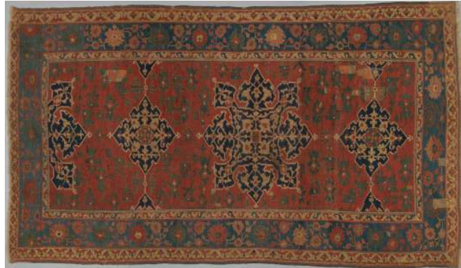
Fotoğraf 4: Uşak Halısı, Yıldız Madalyonlu, NY Metropolitan Museum of Art, Env. No. 22.100.110 https://www.metmuseum.org/art/collection/search/447568

17. yüzyılın ünlü gezgini Evliya Çelebi Seyahatnamesinde Uşak’tan bahsederken “...sanayiinin meşhuru Uşşak halısı ancak Acem İsfahan’ında ve Mısır şehrinde işlenir, amma kaliçeleri yedi iklime dağılmış divanhane ve cami halıları işler ki; nakışı bukalemuna ibret numune halılar olur” demektedir 18 . Genellikle temel renkleri; zeminde kullanılan koyu kırmızı ile desende kullanılan koyu mavi renk, Uşak halılarının karakteristiğidir. Evliya Çelebi Afyon’dan sonra uğradığı Boyalı’yı anlatırken; “toprağında bir çeşit kırmızı kök hâsıl olur. Uşşak kaliçelerinin boyası bundandır, onun için Boyalı derler” demektedir. 19