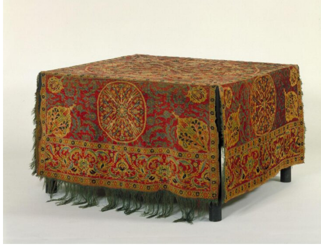
Fotoğraf 1: Masa halısı, Victoria and Albert Museum, Env. No. 151-1883 https://collections.vam.ac.uk/item/O67146/table-carpet-table-carpet-unknown/?carousel-image=2006AT3276

Masa halılarından bir diğere; İngiltere’de Hardwick Hall’de bulunan 1601 tarihli büyük bir evin envanter kaydında rastlanmıştır. Eser; “galeride üzeri kakmalı, iki kare şeklinde masa üzerinde, kenarları karanfil desenli ve beyaz bordürlü, güzel iki Türk halısı” olarak kayıtlıdır. 14