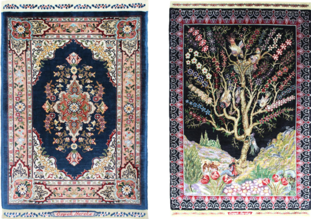
Fotoğraf 3-4: Hereke ipek halı örnekleri 1980, 10x10, 41 cm. x 30 cm (Polat 2018, s. 49-51)

Hereke halılarındaki kompozisyon planları madalyonlu (göbekli), birim desenli, ½ simetrik desenli, mihraplı, yekpare, yollu desenli ve geometrik desenli olmak üzere gruplandırılmaktadır. Saray halıları renk motif ve desen özellikleri bakımından büyük bir uyum içindedir ( Fotoğraf 3-4 ). Kullanım alanına göre taban, seccade, kelle, yastık, karyola halıları olarak gruplandırılmaktadır (Altınbaş 1977, s. 11).