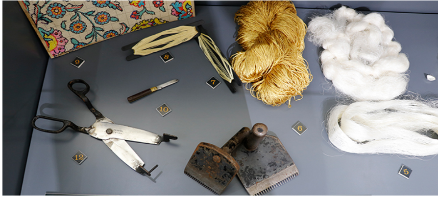
Fotoğraf 2: İpek halı dokuma araç-gereçleri.

İpek halı dokumak için dikey tezgâh, ipek iplikler, makas, kirkit, mekik ve desen hazırlığı gerekmektedir ( Fotoğraf 2 ). İlk olarak çözgü sistemi kurularak işe başlanır. Halı ağızlığı, zinciri dokunur ardından kareli kâğıda çıkarılan desenden faydalanılarak ilme atmaya başlanır ( Fotoğraf 2 ).