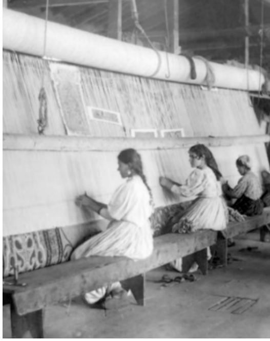
Fotoğraf 1: Hereke Fabrikası ( https://www.millisaraylar.gov.tr/fabrikalar/hereke-hali-ve-ipek-li-dokuma-fabrikasi , Erişim tarihi: 01.11.2024)