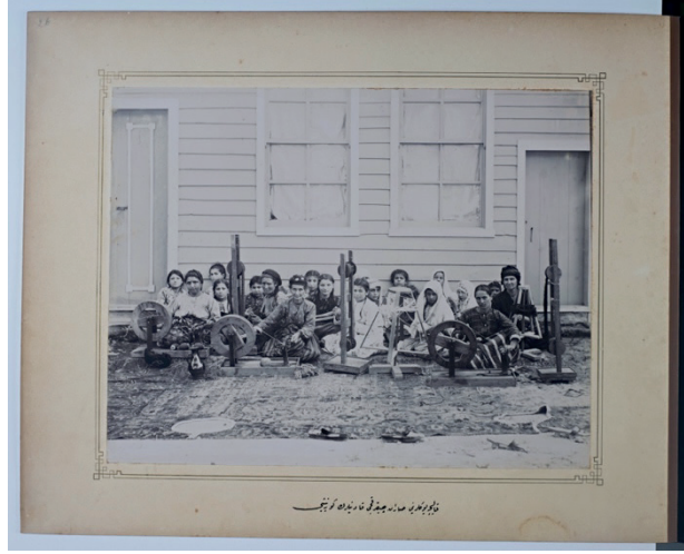
Resim 24: Hereke Fabrikası'nda çıkırık kullanan kadınlar