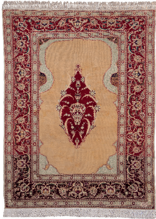
Resim 8: Hereke Halı Seccade, Milli Saraylar Koleksiyonu, Env. No. 13/794.