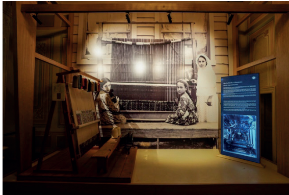
Resim 26-27-28: Yıldız Sarayı Halı Müzesi güncel görüntüler.