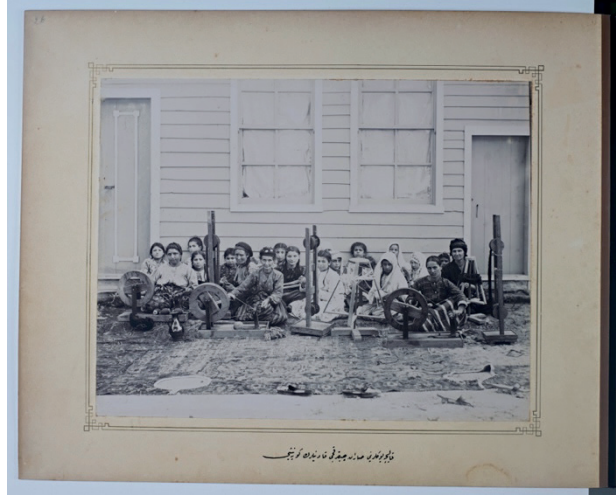
Resim 24: Hereke Fabrikası'nda çıkırık kullanan kadınlar, Milli Saraylar Koleksiyonu, Env. No. 90453-0026.