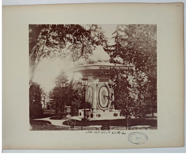
Resim 1: Yıldız Sarayı Hasbahçe’de bulunan III. Selim Çeşmesi, Milli Saraylar Koleksiyonu, Env. No. 90552-0026