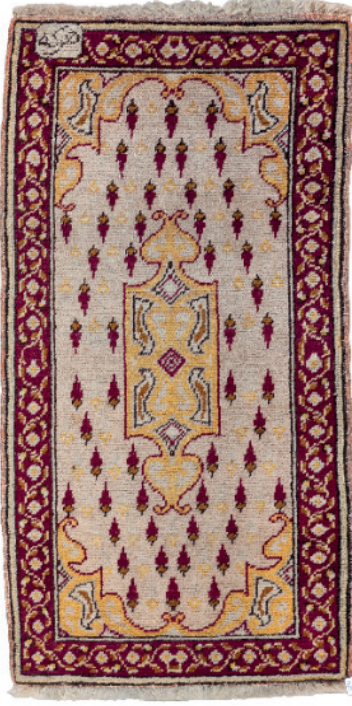
Resim 9: Hereke Halı Seccade, Milli Saraylar Koleksiyonu, Env. No. 12/2262.