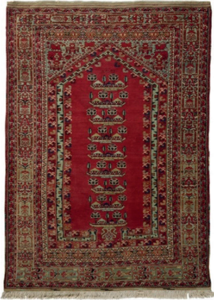
Resim 10: 1303 tarihli Manzaralı Kula halı seccade, Milli Saraylar Koleksiyonu, Env. No. 1/165.