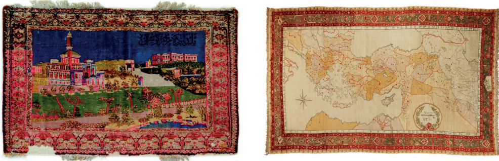
Resim 13-14: Yıldız Sarayı tasvirli duvar halısı (solda), Uşak İmalı Haritalı Duvar Halısı (sağda) Milli Saraylar Koleksiyonu, Env. No. 101/401, 11/1194.