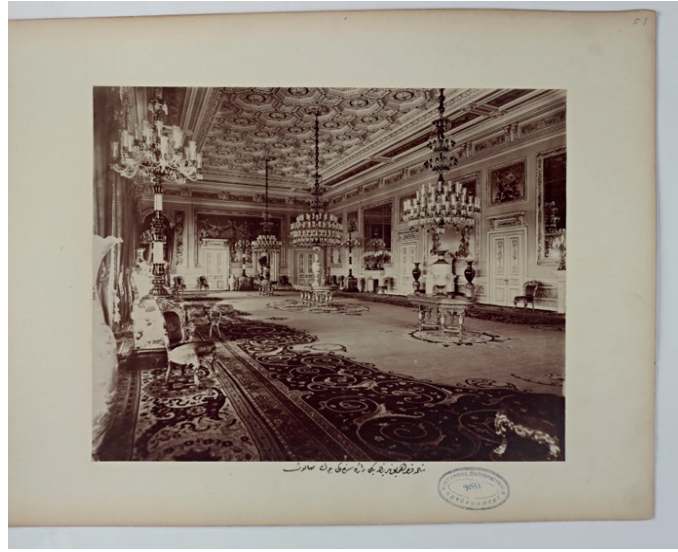
Resim 7: Yıldız Şale Köşkü Tören Salonu, Yıldız Albümleri, Milli Saraylar Koleksiyonu, Env. No. 90552-0053.