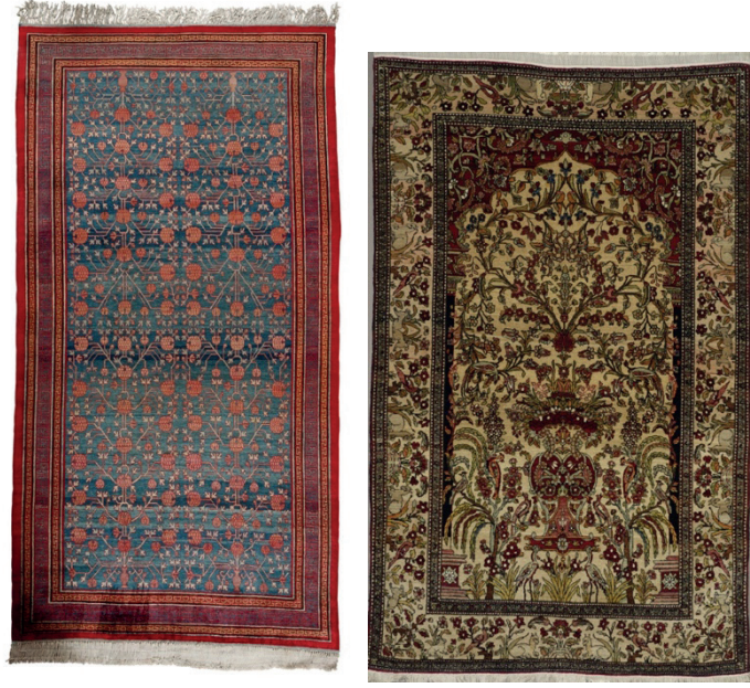
Resim 11-12: İpek Semerkant halı (solda), İsfahan halı seccade (sağda) Milli Saraylar Koleksiyonu, Env. No. 3/472, 162/33.