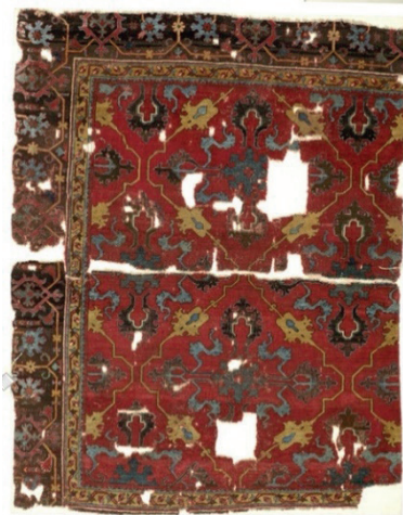
Resim 15: 17. yüzyıl Uşak Halısı, Milli Saraylar Koleksiyonu