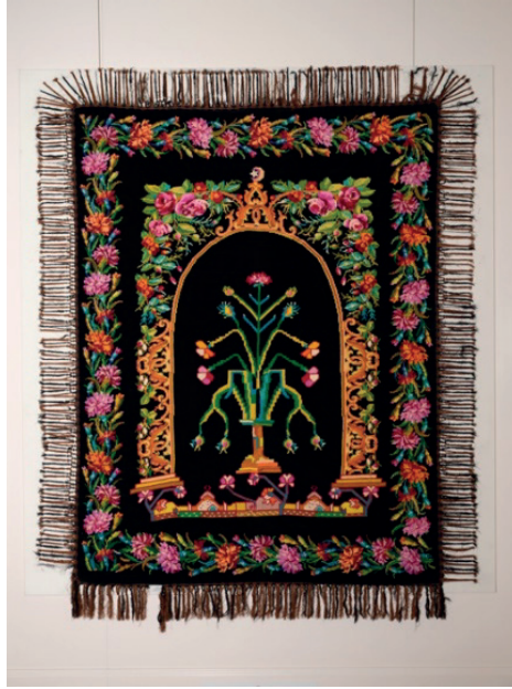
Resim 25: İşlemeli seccade, Milli Saraylar Koleksiyonu, Env. No. 40/388.