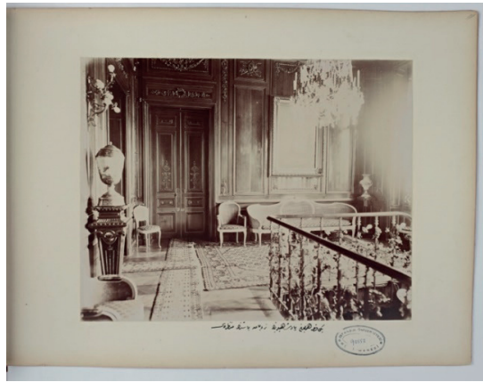
Resim 6: Yıldız Sarayı Yeni Kasır'da merdiven bařından ekilen fotoęrafta yerde Hereke yol halısı, Yıldız Albmleri, Milli Saraylar Koleksiyonu, Env. No. 90552-0011.