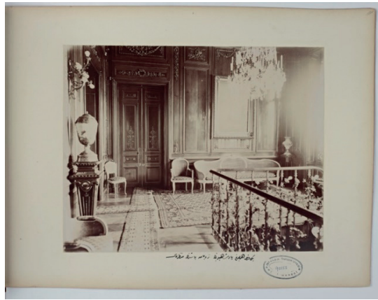
Resim 6: Yıldız Sarayı Yeni Kasır'da merdiven başından çekilen fotoğrafta yerde Hereke yol halısı, Yıldız Albümleri, Milli Saraylar Koleksiyonu, Env. No. 90552-0011.