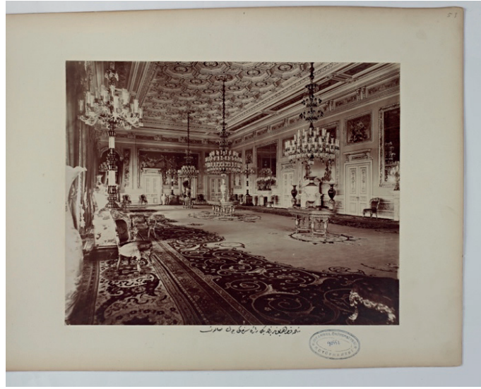
Resim 7: Yıldız Şale Köşkü Tören Salonu, Yıldız Albümleri, Milli Saraylar Koleksiyonu, Env. No. 90552-0053.