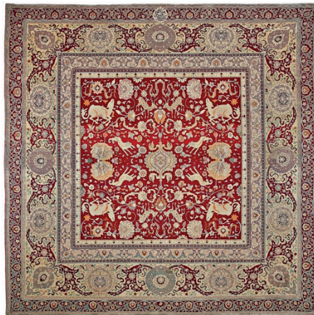
Resim 19: Hereke Halı (üzerinde “bin dokuzyüz sergisine mahsus Hereke Ma'mülatı” yazısı bulunmaktadır.), Milli Saraylar Koleksiyonu, Env. No. 3/470