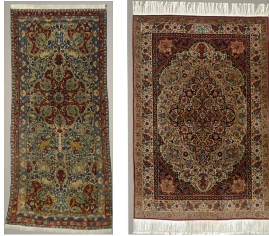
Resim 16-17: Hareketli hayvan figürlerinden oluşan İsfahan Halı (solda), Kirman halı seccade, üzerinde “Fermayış-i, cenab-ı ecel muhtarul melik (yüce hükümdarın seçkin zatının buyruğu üzerine)” ibaresi bulunmaktadır (sağda), Milli Saraylar Koleksiyonu, Env. No. 162/114, 101/398.