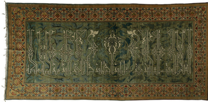
Resim 23: Sultan II. Abdülhamid Han'a hediye edilen yazılı duvar halısı, Milli Saraylar Koleksiyonu, Env. No. 11/1326.