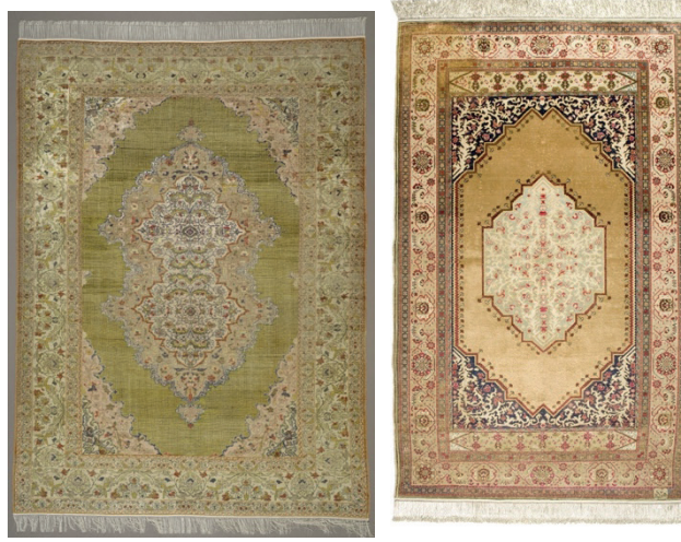
Resim 20-21: Hereke ipek halı (solda), Kayseri ipek halı (sağda) Milli Saraylar Koleksiyonu, Env. No. 13/291, 11/1168.