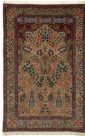
Resim 18: Kirman halı seccade (üzerinde Hafız Şirazi'nin Farsça şiirinden bir bölüm bulunmaktadır), Milli Saraylar Koleksiyonu, Env. No. 162/57