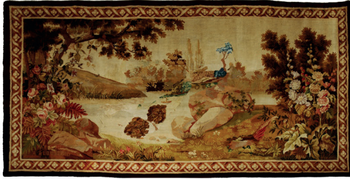
Resim 22: Fransız Aubusson duvar halısı, Milli Saraylar Koleksiyonu, Env. No. 64/1882