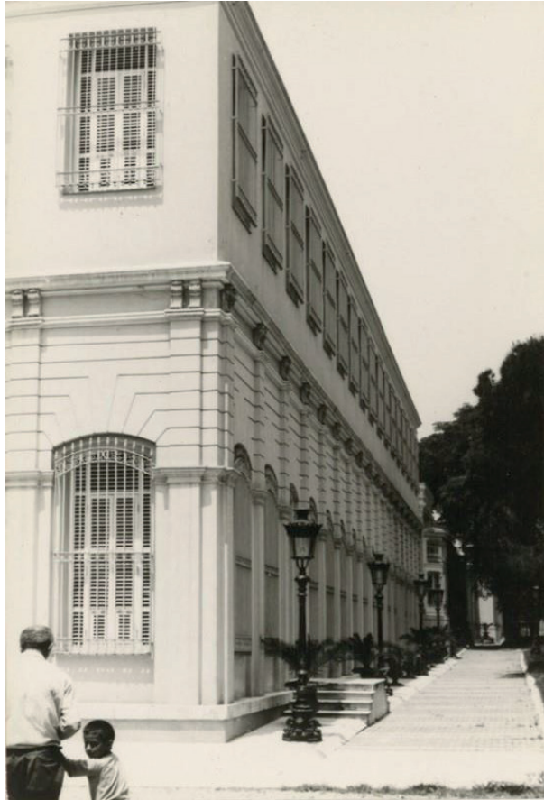
Resim 2: Marangozhane ve Güzel Sanatlar Binaları, Salt Araştırma.