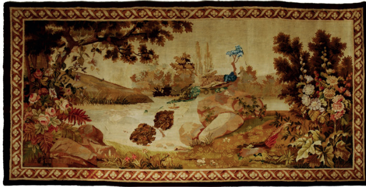
Resim 22: Fransız Aubusson duvar halısı, Milli Saraylar Koleksiyonu, Env. No. 64/1882