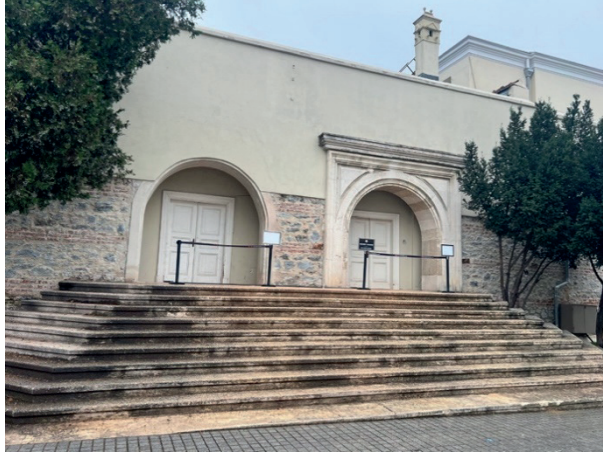
Resim 3: Marangozhane ve Gzel Sanatlar Binası genel grnm.